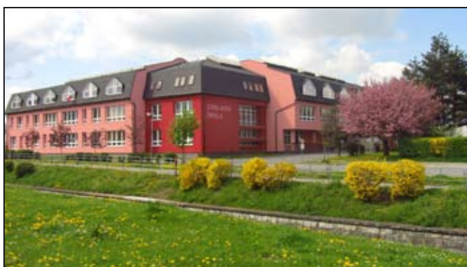
Základní škola ve Vodní ulici.

Rádi byste navštívili moderní školu a dozvěděli se, jak se tu žije dětem a pedagogům? Toužíte nahlédnout do všech zákoutí školy a nasát tvůrčí a přátelskou atmosféru? Chcete se přesvědčit, jak realizujeme v praxi Komenského myšlenku škola hrou? Nebo byste rádi vybrali dobrou školu pro své budoucí prvňáčky?