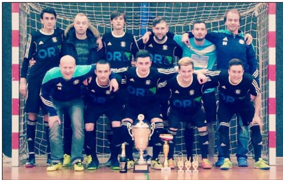
Šakalí hněv má základnu v Mohelnici.

Penaltoví specialisté z Kroměříže brali po dalším úspěšném rozstřelu bronzové medaile. Zanzibar Lanškroun obsadil sice nepopulární čtvrté místo, svými výkony však prokázal svůj ligový potenciál.