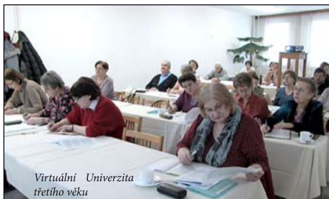
Virtuální Univerzita třetího věku