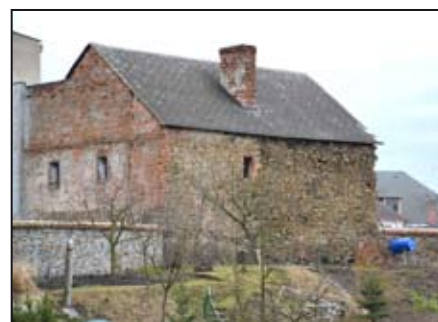
Tzv. Brusův dům v Mohelnici (dle tradice rodiště Antonína Brusa)