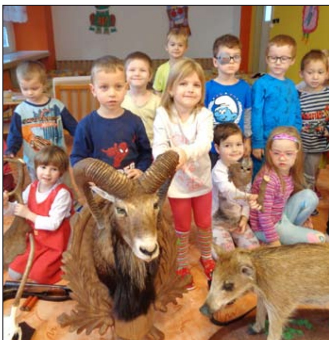
Beseda s myslivcem děti zaujala.