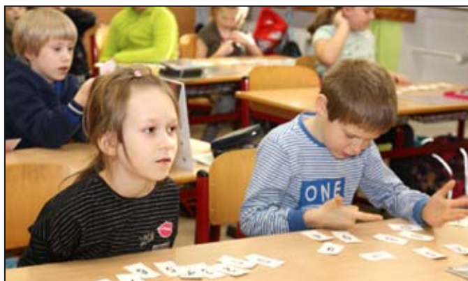
Předškoláci na návštěvě v první třídě.