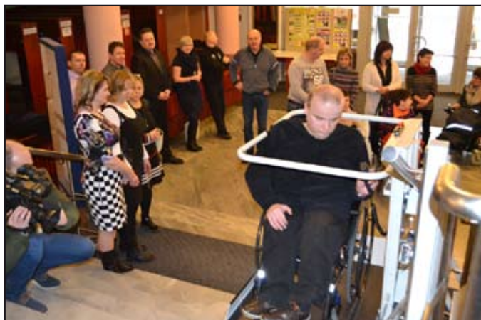
Pomocí schodištvé plošiny se imobilní občané snáze dostanou do sálu kulturního domu.