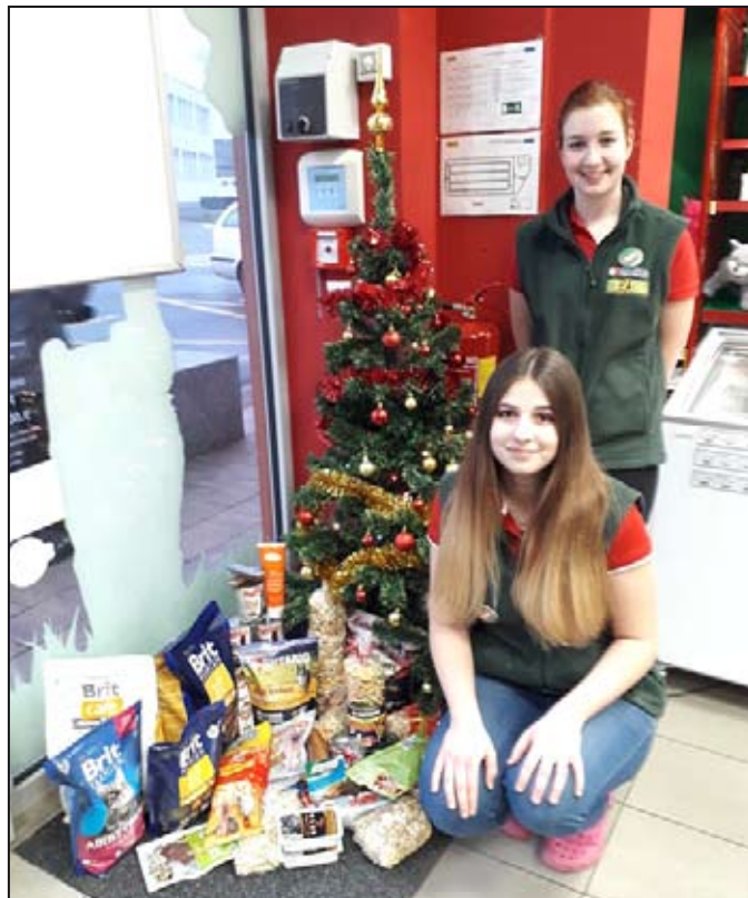
Lidem není lhostejný osud opuštěných zvířat.