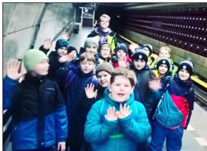
V Praze se nám líbilo.