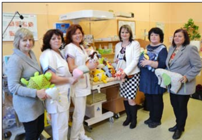
Hračky dětem pomohou překonat pobyt v nemocnici.

Členky Spolku ručních řemesel Mohelnice v rámci svých tvůrčích aktivit ušily a upletly hračky, kterými chtějí potěšit děti pobývající v nemocničním zařízení. S velkým ohlasem byla již v srpnu přijata tato aktivita na dětské a kojeneckém oddělení Šumperské nemocnice. Členky Spolku nechtějí zůstat pouze u jedné akce, proto jsme se rozhodly obdarovat našimi hračkami malé pacienty i v dalších nemocničních zařízeních.