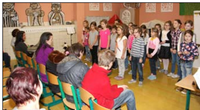
Součástí jarmarku byla i různá vystoupení dětí.

nebo si vyzkoušeli zdobit perníčky. Návštěvníci jarmarku si mohli odnést drobné výrobky s vánoční tematikou – nejrůznější ozdoby a dekorace, pečený čaj, keramické výrobky, andělky a jiné dárečky. Žáci umocnili vánoční atmosféru pásmem vánočních koled, pochlubili se pohybovými dovednostmi z kroužku zumbly a gymnastiky a pro nejmenší návštěvníky zahráli dvě pohádková představení. Potěšilo i malé občerstvení.