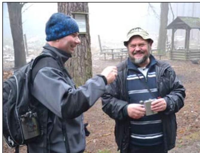
Na výšlapech je vždy veselo.