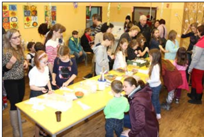
Vánoční jarmark na Mlýnské se stal tradicí.

Ve třídách i v jídelně školy se konaly vánoční dílny, kde žáci pod vedením učitelů vyráběli vánoční přání, dekoraci z chvojek, drobný šperk