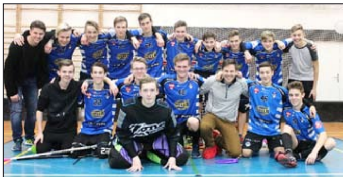
Junioři skvěle reprezentují město.