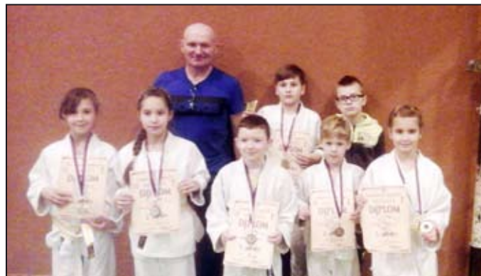
Z přeboru Moravy.