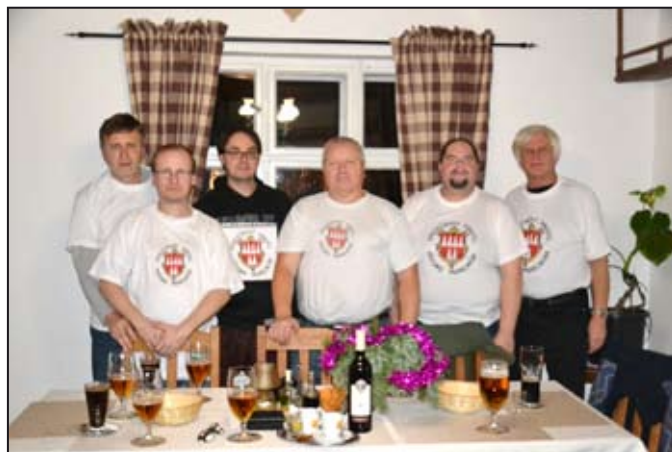
Společnost přátel historie Mohelnicka