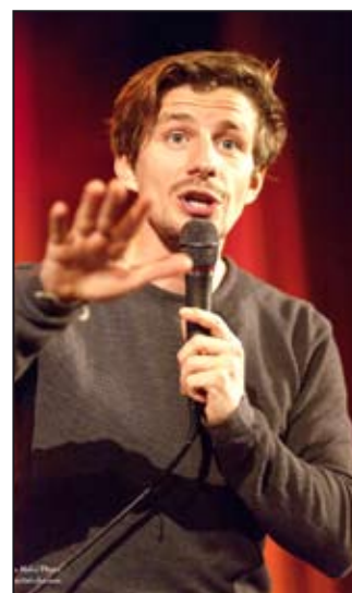
Fotografie z průběhu slavnostního vyhlášení.