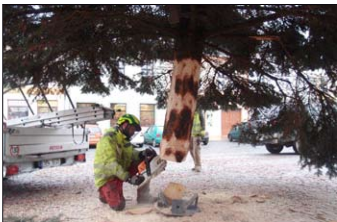
Montáž vánočního stromu je hodinářská práce.

K tradičním mohelnickým akcím bezesporu patří slavnostní rozsvícení vánočního stromu na náměstí Svobody.