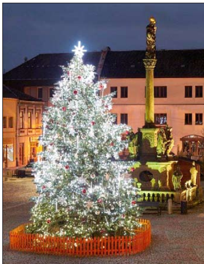
Mohelnický vánoční strom, foto Jiří Ferbíněk