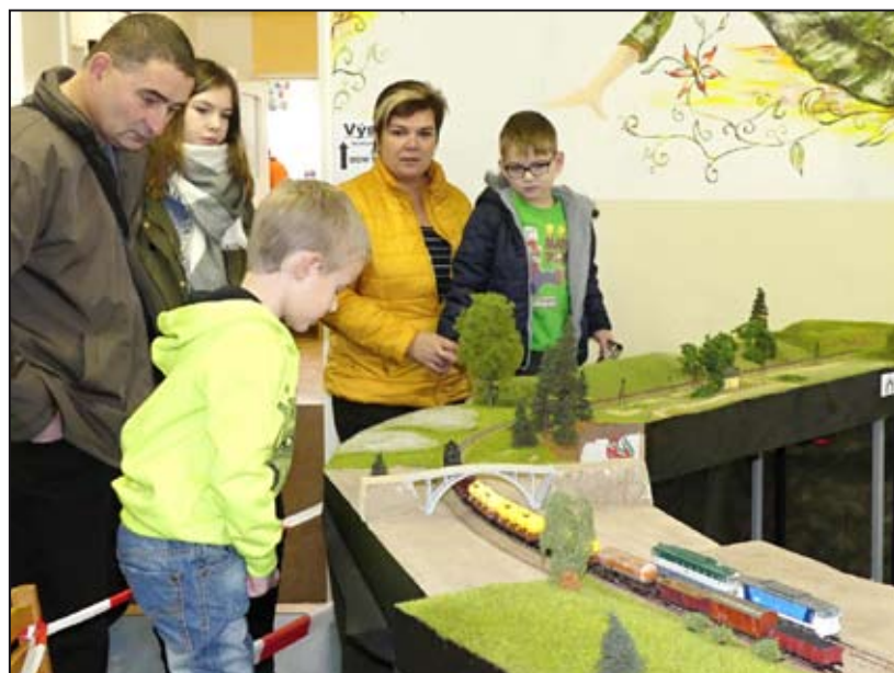
„U modulového kolejiště“