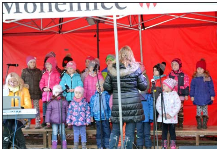
Holubičky z MŠ Hálkova.