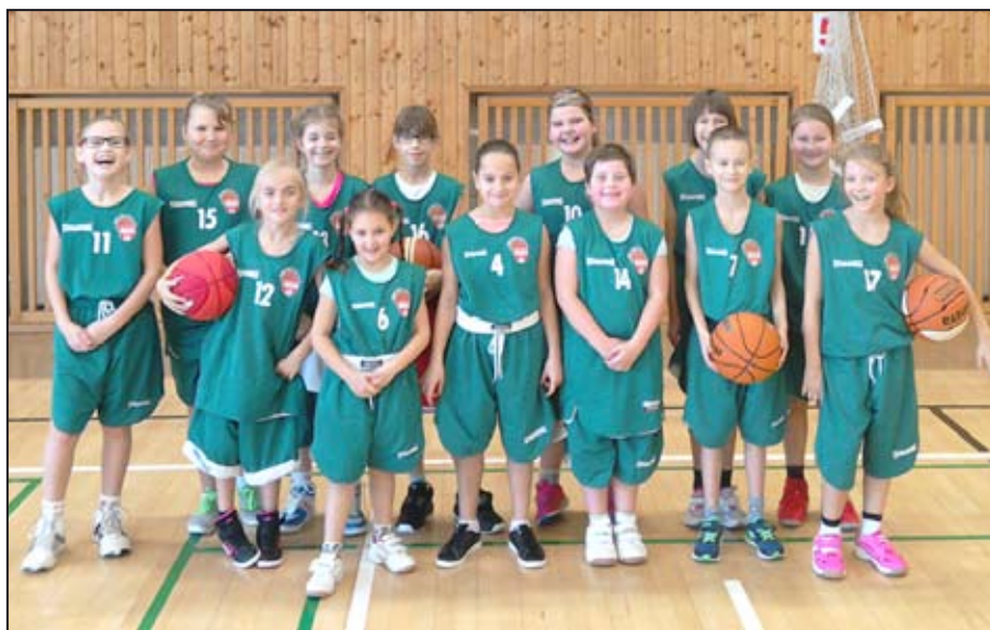
Naši nejmladší košíkáři