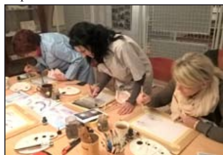
Foto z minidílňny.

Velkou novinkou je rozšíření stávajících operačních programů o Operační program Životní prostředí. Výzvy budou zaměřeny na založení nebo zlepšení stavu biocenter a biokoridorů, protierozní opatření a celkovou revitalizaci funkčních ploch a prvků veřejné zeleně, společně s obnovou a zakládáním doprovodných vodních prvků. Předpokládá se, že výzvy budou vyhlášeny od srpna příštího roku do února 2019 s celkovou alokací 10 mil. Kč. Všechny aktuální informace budou s dostatečným předsti-