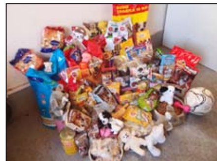
Děti z Mlýnské předaly opuštěným psům velké množství dárek.