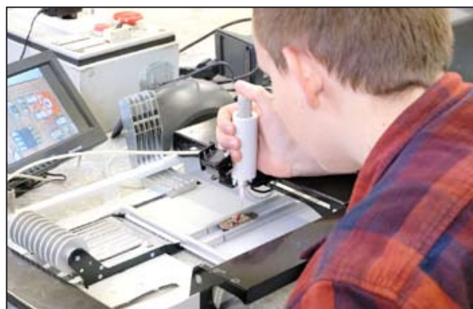
Studenti SPŠE se zúčastnili tvůrčí soutěže.