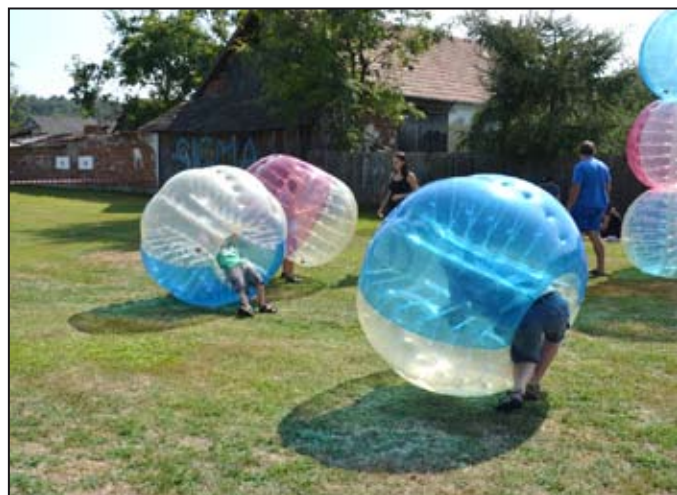
Zorbing byl zárukou legrace

Sobotní ráno 26. srpna bylo pošmurné až mírně deštivé, ale brzy opět zavládlo slunečné a horké počasí, což pořadatelé akce „Den mikroregionu na kole“ uvítali s potěšením. Jako každoročně se účastníci sešli na hřišti ve Stavenici na hodu škrpálem. Tuto soutěž již řadu let pořádají hasiči ve Stavenici, a byla součástí celého soutěžního odpoledne. Akce začala cyklovýletem po okolních lesích. Další soutěže pak následovaly. Hod šipkami, střelba ze vzduchovky, hod granátem na cíl. Téměř všichni dospělí se zápolení účastnili s mladickým elánem. Pro děti zde byla trampolína a zorbing koule, do kterých mohly vlézt a kutálet se po hřišti. K tomu všemu pouštěl hudbu mohelnický DJ Jarďa. Samozřejmostí bylo občerstvení-klobásky z udirny a výborné makrely. J.V