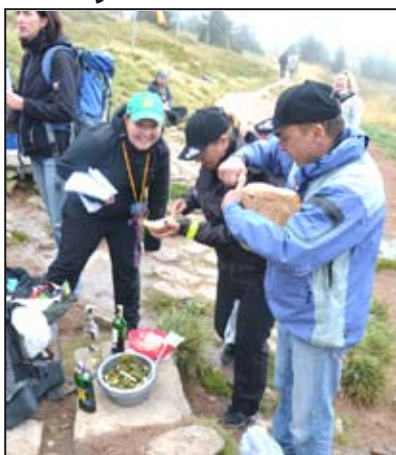
V přírodě vyhládne

Jako každý první víkend v září opět letos vyrazili milovníci přírody na další, již 28. ročník turistického pochodu K prameni Moravy. Přestože v pátek na většině území pršelo a studeně foukalo, opět počet příchozích nezklamal. Stále party z různých koutů Moravy i Polska přišly podpořit pořadatele svou účastí. Díky tomu, že tento den pořádá Staré Město pod Sněžníkem pochod na vrchol K. Sněžníku, počet příchozích byl opět o něco vyšší než minulý ročník. Samozřejmě, že kromě diplomů za