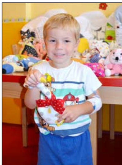
Jeden z malých pacientů si hned hračky vyzkoušel

„Chci touto cestou poděkovat všem členkám Spolku ručních řemesel, které ušily krásné hračky a zavínovačky. Všechny dámy je šily z vlastních materiálů, ve svém volném čase a udělaly tím radost dětem, které musí být v nemocnici,“ řekla místostarostka Jana Kubíčková a dodala: „Ráda bych požádala podnikatele, ale i občany, kteří by se chtěli na této bohužel akci podílet, aby Spolku ručních řemesel věnovali jakýkoliv finanční příspěvek na nákup materiálu pro výrobu dalších dárek.“ PRo