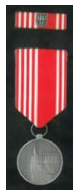
Medaile Stříbrný jehlan