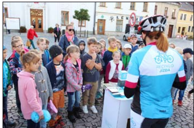
Žáci ZŠ Vodní na setkání s Recyklojízdou