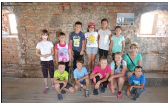
Děti si prohlédly Mohelnici a okolí z věže