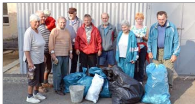
Turisté nasbírali obrovské množství odpadků