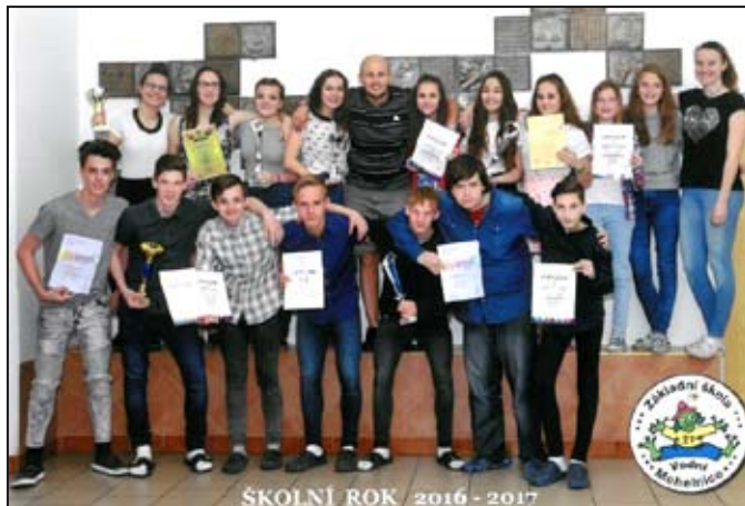
Sportovci z Vodní

Po dvou letech se naši škole podařilo zaznamenat opět velký sportovní úspěch, a sice zvítězit ve sportovní aktivitě škol okresu Šumperk ve školním roce 2016/2017.