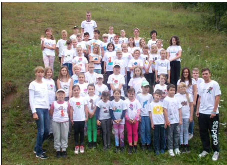
1. turnus Kocourkov