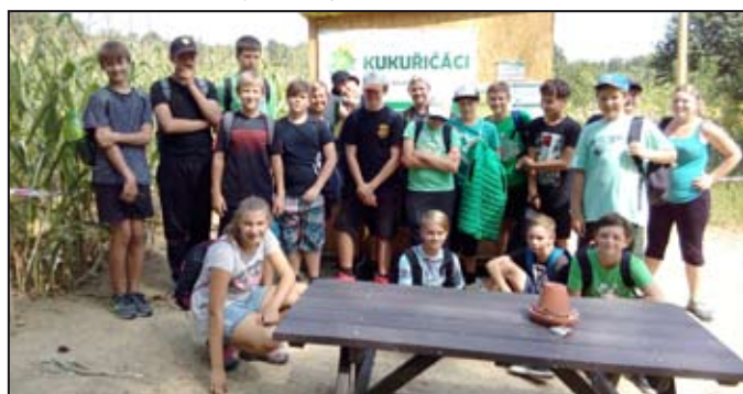
Z bludiště se všichni vrátili.

S rozšířenou nabídkou příměstských táborů o prázdninách přišli pracovníci DDM Magnet Mohelnice. Nabídku přivítali a náležitě