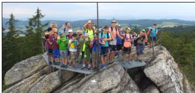
Výlety se florbalistům líbily

rozzrůstá jak základna nejmenších, tak i starších ročníků. Avšak nové členy vítáme nadále, stačí přijít za námi na trénink. Všechny informace jsou uvedeny na stránkách klubu – www.fbcmohelnice.cz. Nejbližší domácí tur-