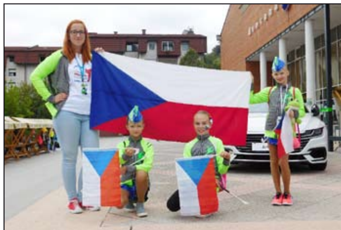
Mažoretky Žabky skvěle reprezentovaly

Po zbytek našeho pobytu jsme si už dopřávaly zaslouženého odpočinku. Užívaly jsme si krásy města Laško, ale také soutěžní atmosféry z pohledu fanoušků.