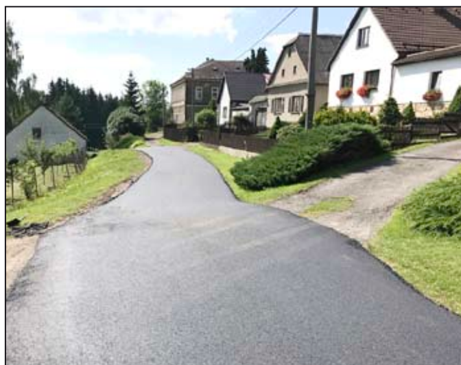
V místní části Studená Loučka byl položen nový asfaltový koberec

3. V měsíci srpnu byly dokončeny opravy komunikací na Studené Loučce, v Podolí a v městském parku, kde byl položen nový asfaltový povrch a upraveny některé spojovací chodníčky.