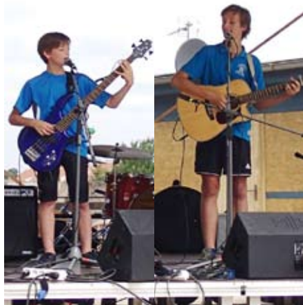
Na Slatinické struně

Vše však nakonec dopadlo úplně jinak. Duo 2 Ká si získalo jak ohlas publika, které jim v diváckém hlasování přiřklo 1. místo, tak uznání odborné poroty, která jim také udělila 1. místo. Kluci si tak domů odvezli krásný putovní pohár, pěkné ceny a pozvání na další ročník Slatinické struny. (LK)