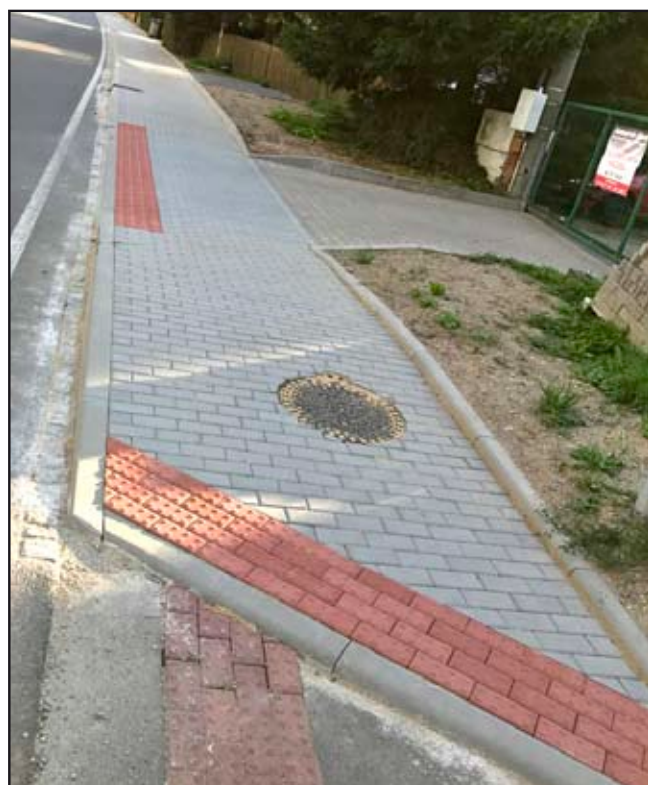
Dokončený chodník v místní části Újezd

Prodám pěkný cihlový byt 2+1 v Mohelnici.