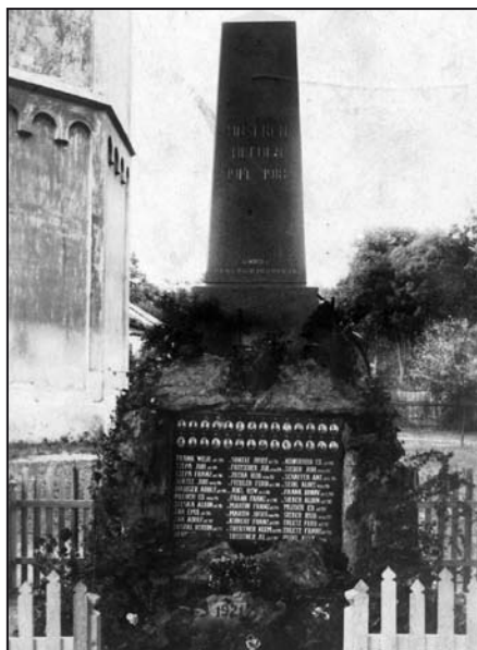
Pomník z roku 1921

Od první světové války (1914-1918) nás dělí sto let. Připomínají ji stovky pomníčků, roztroušených po celé zemi. Většina z nich byla u příležitosti výročí zahájení tzv. Velké války uvedena do dobrého stavu. Ten studenoloučský si musel počkat do letošního roku, kdy se zásluhou Městského úřadu v Mohelnici dočkal generální opravy. Po jednom z křížů (z roku 1844) v areálu kostela je již druhou opravenou památkou v tomto prostoru, který je i s kostelem od roku 2012 zapsán do seznamu chráněných kulturních památek. Mohelnické radnici za to patří velký dík.