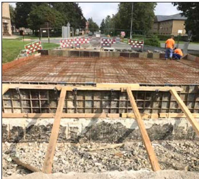
Ukončení opravy mostu na ul. 1. máje je plánováno na 25. září

1. Skončí práce na Havlíčkově náměstí a okolních ulicích, bude dokončena oprava ulice Růžová a Staškova, dokončí se oprava mostu 1. máje, oprava chodníku okolo kostela svatého Stanislava na ulici Nádražní, ukončí se práce na smíšené stezce kolem potoka Mírovka.