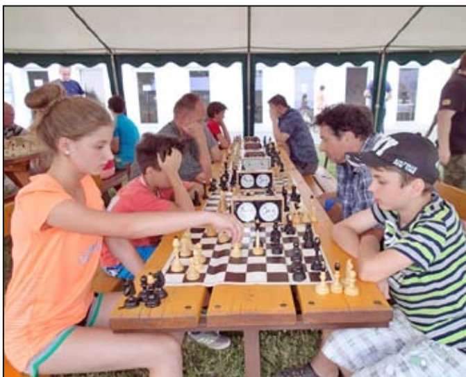
Šachové zápolení přilákalo množství zájemců

Kdy je Mezinárodní den žen či Svátek práce, ví skoro každý. Ale víte, že existuje i Mezinárodní den šachu? Slaví se 20. července, tedy v den, kdy v roce 1924 byla založena Mezinárodní šachová federace, která nyní sdružuje 181 národních federací a patří mezi největší a nejstarší mezinárodní sportovní federace na světě. Ustavení dne šachu navrhl UNESCO a slaví se již od roku 1966.