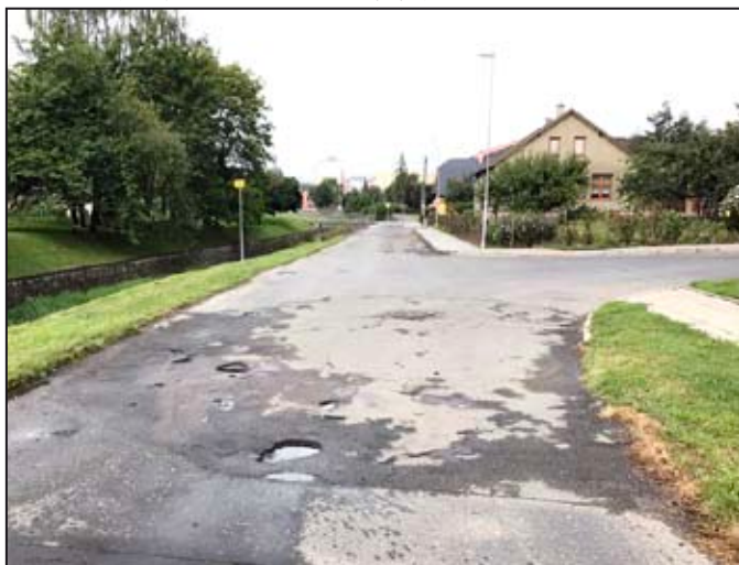
Ulice Vodní-Lidická se v září dočká opravy, bude položen nový asfaltový koberec

2. Začnou práce na opravě komunikací v Křemačově, na druhé části cyklostezky Libivá-Květín, na opravě chodníku, vozovky a parkovacích stánků na začátku ulice 1. máje a konci ulice Staškova, na opravě chodníku a vozovky na ulici Za Humny, na opravě komunikace na ulici Vodní a části ulice Lidická, na spojnici ulic U Hřiště a Generála Svobody, na prodloužení ulice U Potoka na ulici Masarykova, na rekonstrukci chodníku na ulici Třebovská a na celkové opravě povrchů komunikací v centru města na ulici Smetanově, ulici Lékárnická a části ulice Hradební.