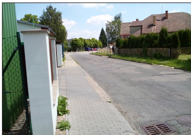
Ulice Za Humny se dočká nového asfaltového povrchu

Když hodíte použitou baterii do popelnice na směsný odpad, skončí na skládce nebo ve spalovně. V obou případech se z ní uvolňují škodlivé látky, včetně těžkých kovů, které znečišťují ovzduší, půdu, podzemní a povrchové vody. Když ale absolvujete pár kroků navíc k nejbližšímu sběrnému místu, pak nejenže přírodu neznečišťujete, ale navíc ji šetříte, protože díky recyklaci z použitých baterií získáváme druhotné suroviny, zejména kovy, které mohou sloužit k výrobě nových produktů. Sběrných míst je v České republice už přes 20 tisíc. Asi nejznámější jsou červené venkovní kontejnery na třídění drobných elektrospotřebičů a baterií. Na popularitě získává odevzdávání baterií v obchodech. Kdykoli tedy půjdete nakoupit do supermarketu, můžete zde odevzdat i baterie. A pokud ještě nevíte, kde máte nejbližší sběrné místo, určitě ho najdete na interaktivním vyhledávači mapa.ecobat.cz .