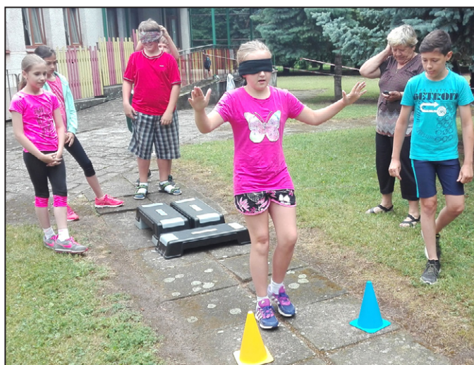
V roli nevidomého s navigátorem

V pátek 23. června se v prostorách Domu dětí a mládeže Magnet Mohelnice uskutečnil další ročník soutěže „Den bez úrazu“ aneb „Proto pozor, proto bacha“. Akce v rámci projektu „Dětství bez úrazu“ určená šestičlenným družstvům z 5. ročníků ZŠ, zábavnou formou informuje děti o prevenci dětských úrazů v dopravě, doma, ve škole, v přírodě a při sportu. Soutěžní klání bylo završením celoročního vzdělávání dětí v této oblasti. Děti absolvovaly deset stanovišť, kde plnily úkoly vztahující se k problematice úrazů dětí. Vyzkoušely si jízdu zručnosti na kole, řešily dopravní situace, vyhledávaly nebezpečná místa a nebezpečné předměty v místnosti i v přírodě. Též si vyzkoušely chůzi poslepu, učily se bezpečně padat a porovnávaly se soupeři svoji obratnost a postřeh. Soutěžního dopoledne se zúčastnila 3 družstva ze ZŠ Vodní Mohelnice, 2 družstva ze ZŠ Mlýnská Mohelnice a 2 družstva ze ZŠ Loštice. První místo si s celkovým součtem 130 bodů vybojovalo družstvo 5. C ze ZŠ Mlýnská, druhé místo s počtem bodů 124 družstvo 5. B ze ZŠ Vodní a třetí místo se 117 body obsadilo družstvo 5. B ze ZŠ Loštice. Miroslav Škopík