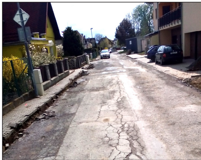
Jedna z ulic v lokalitě Havlíčkova náměstí