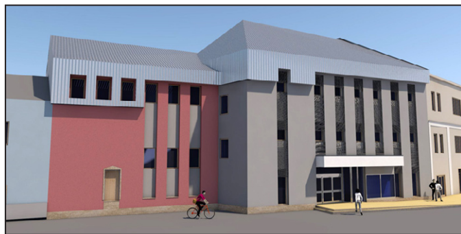
Vizualizace fasády podle architekta