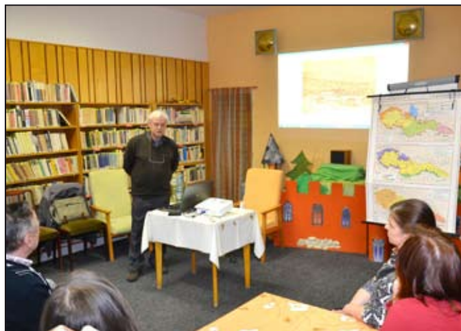
Pan Nesět mapuje Pochody smrti.