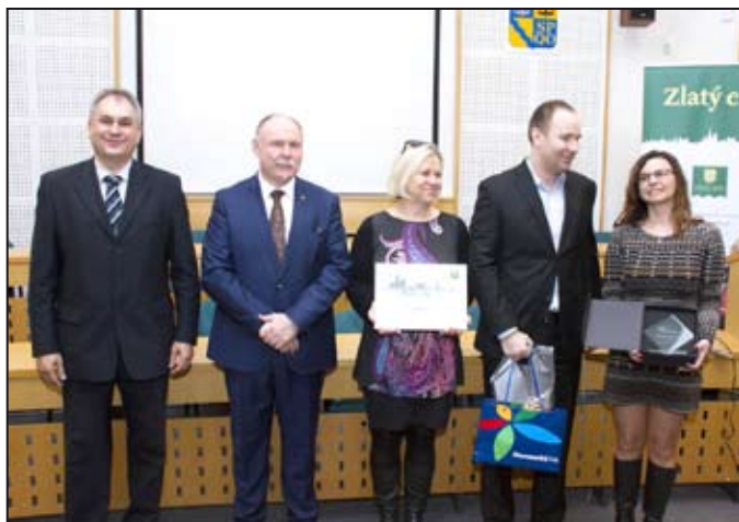
Zástupci města s vedením Olomouckého kraje.