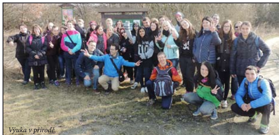
Výuka v přírodě.

Stejně jako v předešlých letech, tak i letos, se žáci naší školy zúčastnili 14. března výukového programu – Škola v lese. Využili jsme prostředí CHKO Litovelské Pomoraví v okolí obce Moravičany, kde jsme pozorovali jarní přírodu, rostliny a zvířata. Ke konci akce se žáci učili plést velikonoční pomlázky z vrbového proutí.