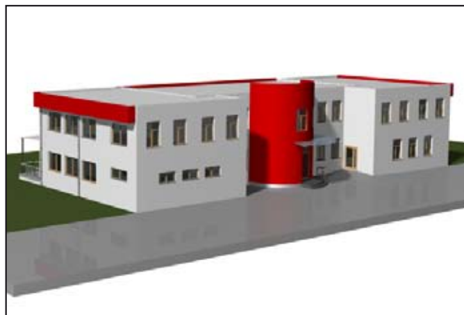
Projekt DDM po rekonstrukci.

Na začátku volebního období radnice nechala zpracovat projekt na kompletní rekonstrukci DDM, který získal stavební povolení. Projekt řeší zastřešení teras, bezbariérovost objektu a nové instalace elektro, topení, kanalizace a vody. V letošním roce byla vypsána dotace z operačního programu, a protože Mohelnice byla