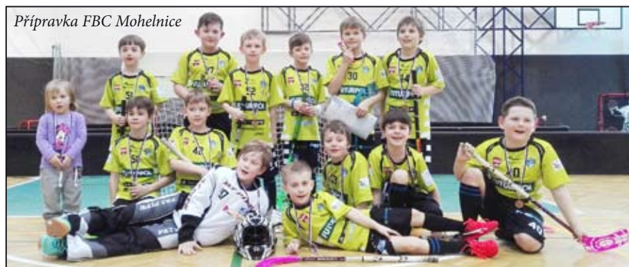
Přípravka FBC Mohelnice