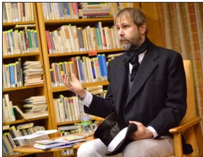
Hans Christian Andersen přečetl pohádku