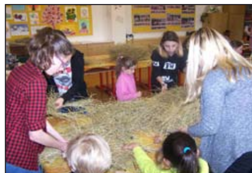
Jarohrátek se zúčastnil rekordní počet zájemců.