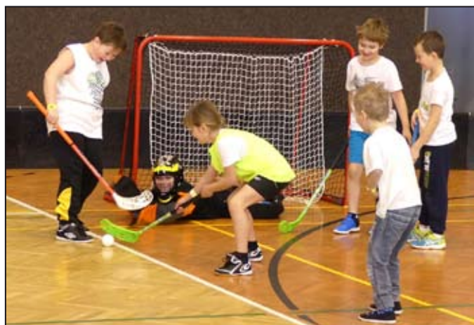
O nebezpečné situace nebyla nouze.