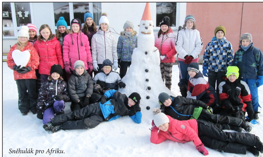
Sněhulák pro Afriku.

Společnost Kola pro Afriku shromažďuje v naší republice starší a nepotřebná kola, která jsou opravena a měla by se dostat dětem do Afriky, pro něž je to mnohdy jediný způsob, jak se dostat do školy. Projekt Sněhuláci pro Afriku by měl pomoci vydělat peníze na přepravu těchto kol do Afriky. Naším dětem se podařilo s pomocí rodičů nashromáždit částku 3252 Kč.