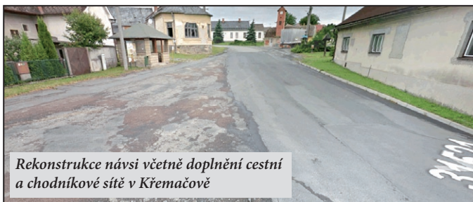
Rekonstrukce návsí včetně doplnění cestní a chodníkové sítě v Křemačově