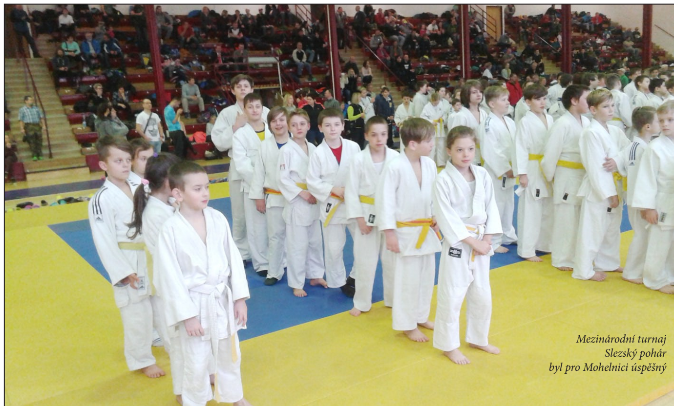
Mezinárodní turnaj Slezský pohár byl pro Mohelnici úspěšný

V sobotu 19. února se mladí judisté T. J. Sokol Mohelnice účastnili tradičního mezinárodního turnaje judo v Opavě. V konkurenci 270 závodníků z ČR, Polska a Slovenska naši zástupci vybojovali dvě zlaté a jednu bronzovou medaili.