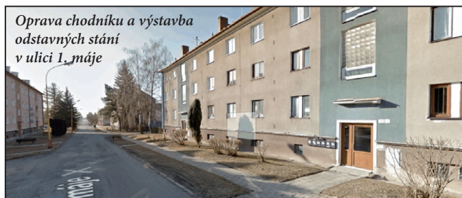
Oprava chodníku a výstavba odstavných stání v ulici 1. máje