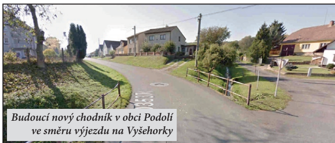
Budoucí nový chodník v obci Podolí ve směru výjezdu na Vyšehorky