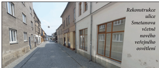
Rekonstrukce ulice Smetanova včetně nového veřejného osvětlení