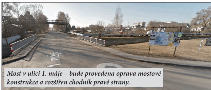
Most v ulici 1. máje – bude provedena oprava mostové konstrukce a rozšíření chodníků pravé strany.