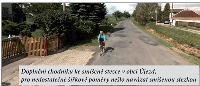
Doplnění chodníku ke smíšené stezce v obci Újezd, pro nedostatečné šířkové poměry nešlo navázat smíšenou stezkou