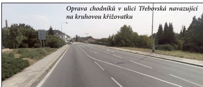
Oprava chodníků v ulici Třebovská navazující na kruhovou křižovatku