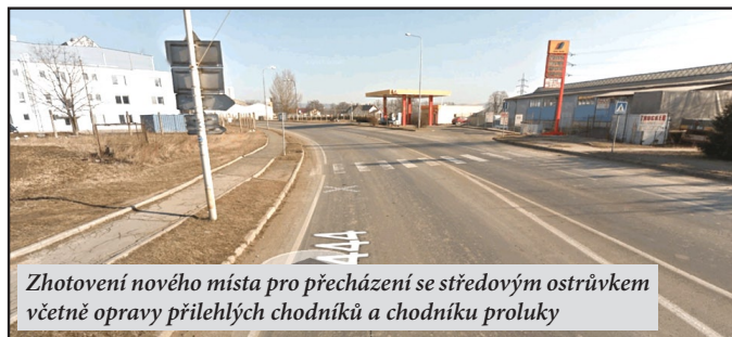
Zhotovení nového místa pro přecházení se středovým ostrůvkem včetně opravy přilehlých chodníků a chodníku proluky