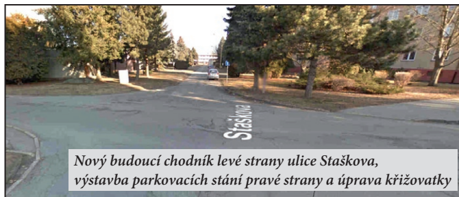
Nový budoucí chodník levé strany ulice Staškova, výstavba parkovacích stání pravé strany a úprava křižovatky