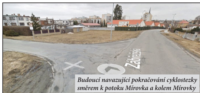
Budoucí navazující pokračování cyklostezky směrem k potoku Mírovka a kolem Mírovky

Neméně významným projektem je projekt na rozšíření cyklostezek v celkových nákladech přes 20 mil. Kč. Jedná se o 2 úseky napojující se na již stávající cyklostezku do Libivé. Prvním úsekem je pokračování cyklostezky z Libivé do Květína. Druhým úsekem je prodloužení cyklostezky z ulice Květná na ulici Stanislavova a na ulici Lidická podél potoka Mírovky z obou stran.