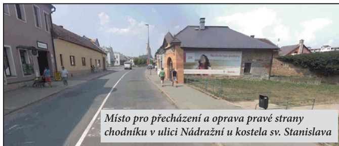
Místo pro přecházení a oprava pravé strany chodníku v ulici Nádražní u kostela sv. Stanislava