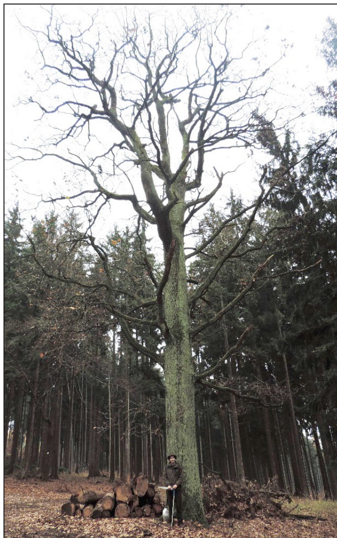
„Dědek“ – nejstarší strom v městských lesích.