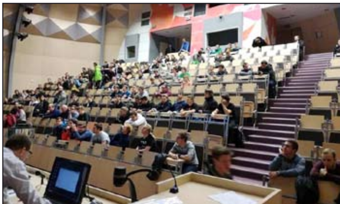
Soutěž v Brně

Žáci SPŠE Mohelnice se tradičně zúčastnili soutěže Merkur perFEKT Challenge, jejíž 4. ročník uspořádala 29. 11. 2016 Fakulta elektrotechniky a komunikačních technologií VUT Brno. Soutěž je určena pro čtyřčlenné týmy středoškoláků, které si předem vyberou některé z nabízených témat a na místě v časovém limitu sestavují a oživují konstrukci ze stavebnice Merkur. Letos patřila mezi nabízená témata například automatická třídička odpadů, pásovec sledující světlo nebo hybridní motor.