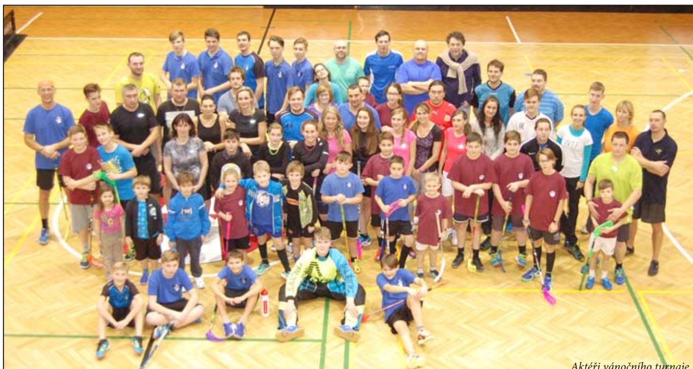
Aktéři vánočního turnaje

Mohelnický zpravodaj. Měsíčník. Vydává Město Mohelnice, U Brány 2, 789 85 Mohelnice, IČO 00303038, DIČ CZ00303038. Evidenční číslo MK ČR E 12893. Redakce: Mohelnické kulturní a sportovní centrum, s.r.o., Lazebnická 2, 789 85 Mohelnice, tel.: 583 430 915. Redaktor: Mgr. Petra Rosipalová <rosipalova@mksdk.cz>. Redakční rada: Ing. Ivo Višinka, Šárka Hamplová, Mgr. Dana Šafářová. Redakční radu jmenuje Zastupitelstvo města Mohelnice. Příjem plošné inzerce: Adéla Karabcová, <karabcova@mksdk.cz>, tel.: 583 430 915. Vychází prvního dne daného měsíce a nese i jeho pořadové číslo. Uzávěrka: 20. dne ve 12 hodin předchozího měsíce. Výtisk zdarma. Náklad: 4 300 ks. Tisk: Tiskárna Křupka Mohelnice. Nevyžádané rukopisy a obrazové materiály se nevracejí. Redakce se nemusí ztotožňovat s názory prezentovanými ve článkách dopisovatelů. Nepodepsané příspěvky nezveřejňujeme. V redakci jsou k nahlédnutí Zásady pro vydávání Mohelnického zpravodaje. Vydavatel neodpovídá za věcný obsah uveřejněných inzerátů. Vydavatel si vyhrazuje právo zveřejnit publikované materiály na internetu. Přetiskování redakčních materiálů bez souhlasu redakce není dovoleno. Za případné chyby se omlouváme. Periodický tisk územního samosprávného celku.