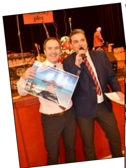
Výherce první ceny – zájezdu