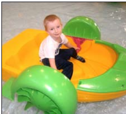
Ondra na lodičce

Na konci roku 2016 byla otevřena v Olomouci herna Krokodýlek. Herna i herní prvky v ní jsou zaměřeny na pirátskou tematiku. Do této herny jsme se rozhodli jet v neděli 22. ledna s nejmladšími dětmi oddílu Karate Mohelnice.