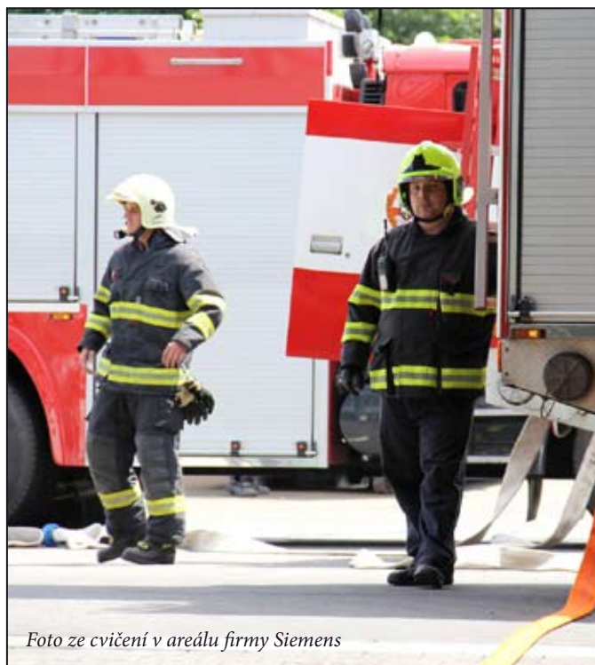
Foto ze cvičení v areálu firmy Siemens

V červnu hasiči v rámci oslav 140. výročí založení uspořádali dětský den, kde byla vystavena technika, byly provedeny ukázky zásahu, jako je dopravní nehoda, požár automobilu, slanění hasiče z automobilové plošiny. Večer