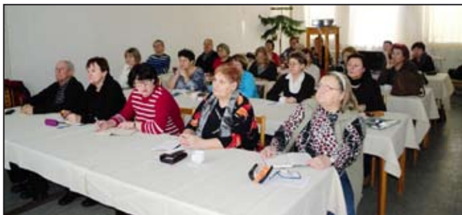
Posluchači mohelnické VU3V na společné přednášce