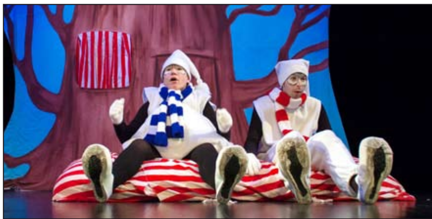
Foto z představení Pohádky z Pařezové chaloupky

V neděli 12. března v 15 hodin v domě kultury zahraje divadlo Scéna Zlín Pohádky z Pařezové chaloupky. Jedná se o veselou pohádku plnou hravosti, humoru a písniček. Aby dětem čekání rychle uteklo, připravili jsme pro ně výtvarnou soutěž. Namalujte obrázek s Křemílkem a Vochemůrkou, na druhou stranu napište jméno a věk, připište kontakt na rodiče a přineste do 7. března do Infocentra domu kultury. Vylosování výherci se mohou těšit na vstupenku do kina. PRo