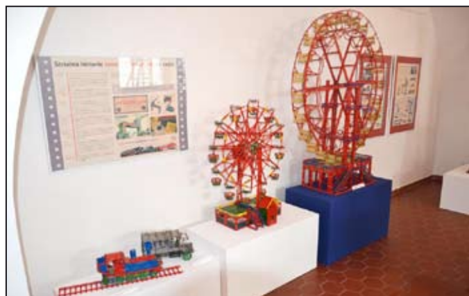
Foto z výstavy