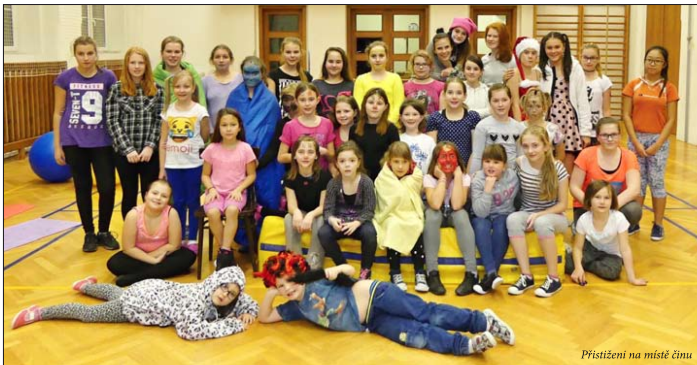
Přistižení na místě činu