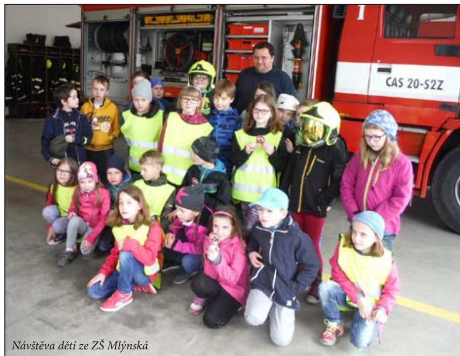
Návštěva dětí ze ZŠ Mlýnská