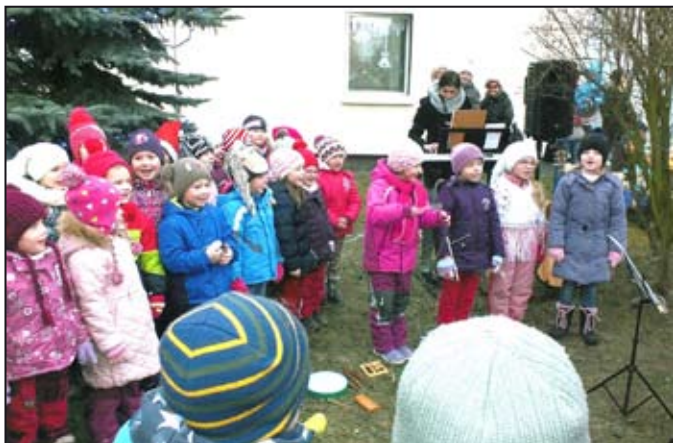
Dětem i rodičům se odpoledne líbilo