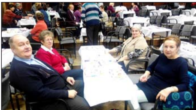
Jednoho ze závěrečných seminářů, který se konal 18. ledna v Zábřehu, se zúčastnilo 208 posluchačů ze 14 konzultačních středisek. Mezi nimi byli i studenti z Mohelnice.

Po šesti úspěšně absolvovaných kurzech jsou posluchači pozváni ke slavnostní promoci do auly ČZU v Praze, kde si převezmou „Osvědčení o absolutoriu U3V“. To však neznamená konec studia, absolventi cyklu mohou následně pokračovat studiem nového cyklu, výběrem dalších šesti tematických kurzů. PRO