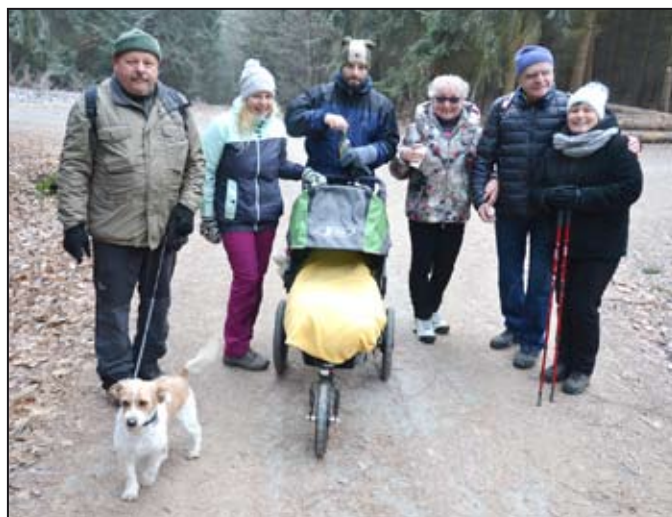
Turisté si novoroční výšlap oblíbili