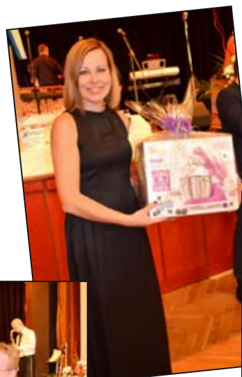
Výherkyně elektrického šlehače