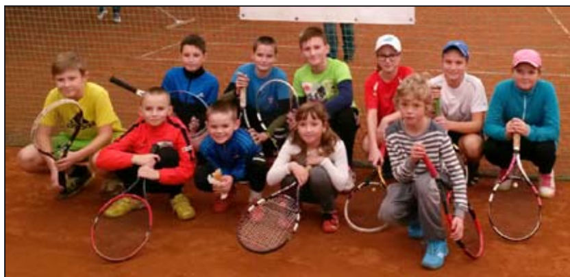
Mohelnické tenisové mláďá

V novém roce přejeme všem našim mladým sportovcům pevné zdraví a mnoho úspěchů nejen na poli sportovním. TK Mohelnice