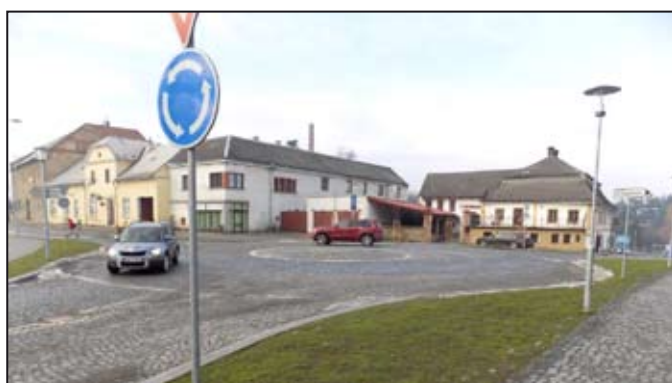
Na fotografiích jsou dvě z rekonstrukcí v našem městě – ulice Stanislavova a kruhový objezd na Třebovské ulici, foto: odbor SURI