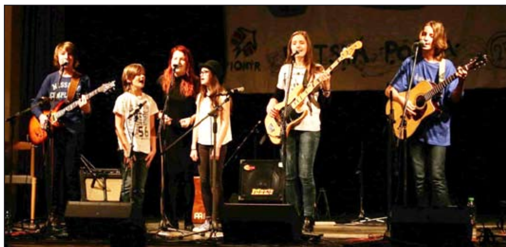
Večerní galakonzert k 25. výročí dětské Porty