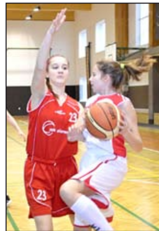
Foto z utkání s OSK Olomouc