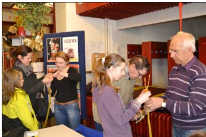
Loni mělo pletení pomlázek veliký úspěch.

Navíc se děti mohou přijít podívat do kina na zbrusu nový animovaný film Kung Fu Panda 3, a to v pátek 25. března v 10 hodin. PRO