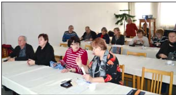
VU3V – virtuální univerzita třetího věku nabízí zajímavé kurzy.

Dům kultury ve spolupráci s Provozně podnikatelskou fakultou v Praze již několik let nabízí vzdělávací kurzy pro seniory, tzv. univerzitu třetího věku (U3V). Protože studenti nemusí jezdit na přednášky až do Prahy a vše se odehrává pomocí internetu, studiu se říká virtuální. Tento způsob výuky je určen především pro vzdělávání seniorů, kteří se z různých důvodů nemohou zúčastňovat prezenčních přednášek U3V v sídlech vysokých škol a univerzit (vzdálenost, zdravotní a časové důvody, finanční náročnost na dopravu apod.).