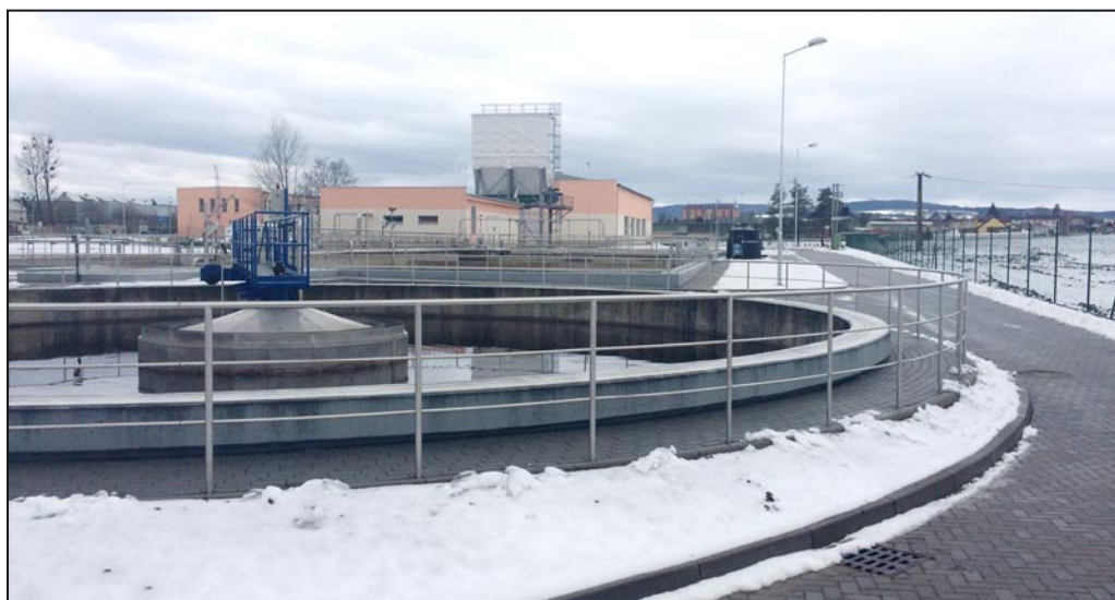
Modernizovaná a intenzifikovaná čistička odpadních vod Mohelnice, foto: MB

Vážení občané města Mohelnice a přilehlých obcí, dovoluji vám prosím, abych na začátku nového roku 2016 alespoň ve zkratce zrekapituloval to nejzásadnější, s čím jsme se společně setkávali den co den na území města Mohelnice v roce 2015, a představil projektové priority a stavební akce, které společnost Vodohospodářská zařízení Šumperk, a.s. (VHZ) v kooperaci s vedením města Mohelnice připravuje pro rok 2016.