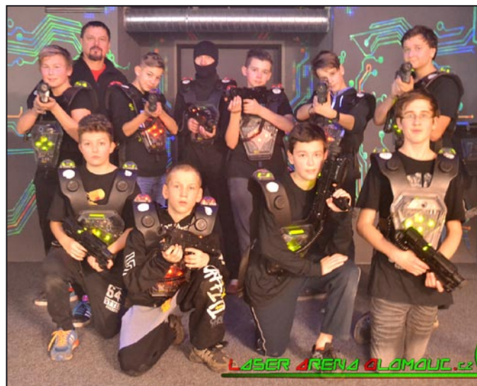
Lasergame i aquapark si mladí nohejbalisté užili.