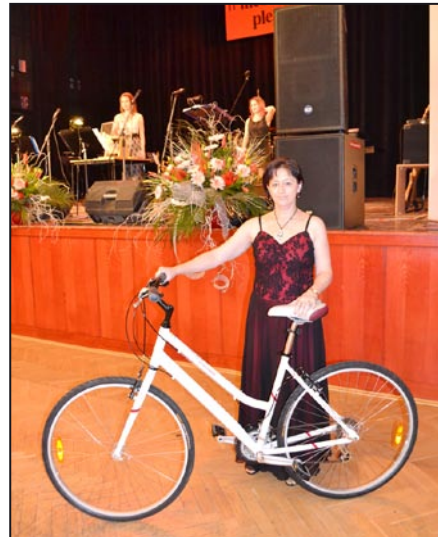
V tombole bylo i jízdní kolo

Skupina „Legends se vrací“ (foto vpravo), přilákala na parket množství tanečníků, jak je vidět ze spodní fotografie.