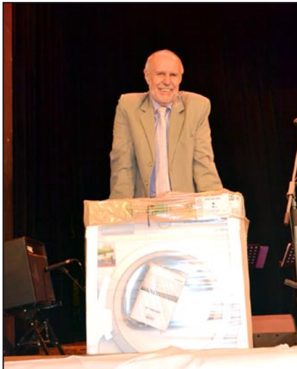
Šťastný výherce sušičky