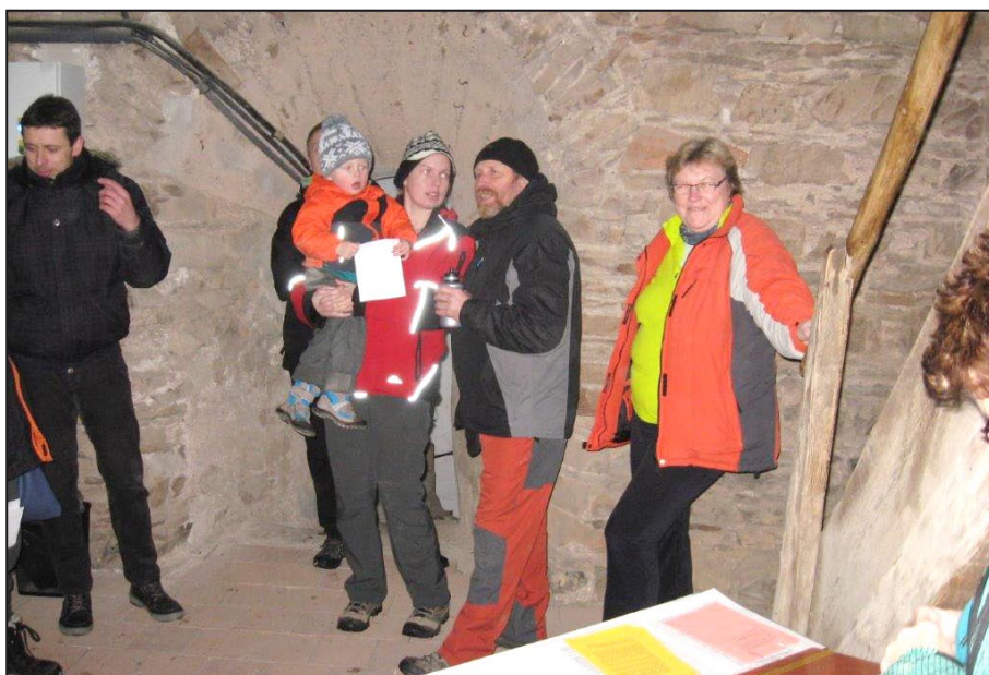
Novoročního výstupu se lidé nezalekli.