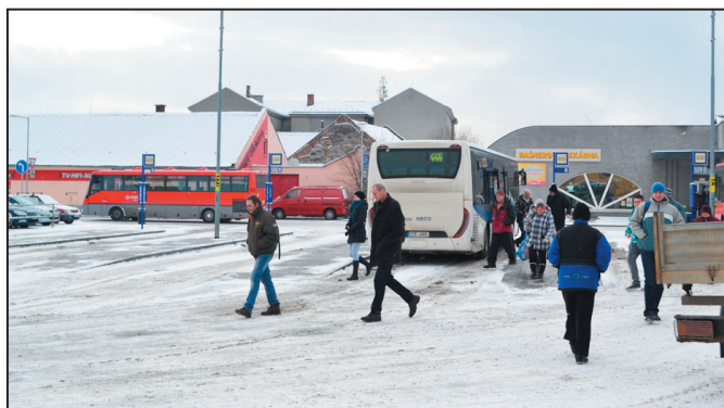
Autobusové nádraží je v plném provozu

Dešťové vpusti nesbírají vodu z vozovky ulice Okružní, jedna z mnoha chyb, která se bude na jaře opravovat.