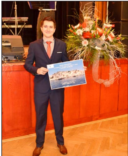
Výherce první ceny – zájezdu

Kromě tance bývá na plesu populární tombola. Letos byla opravdu hodnotná. Hrál se o zájezd, sušičku, televizor, jízdní kolo, počítač, pobytový poukaz, dárkový certifikát a mnoho dalších cen. PRO