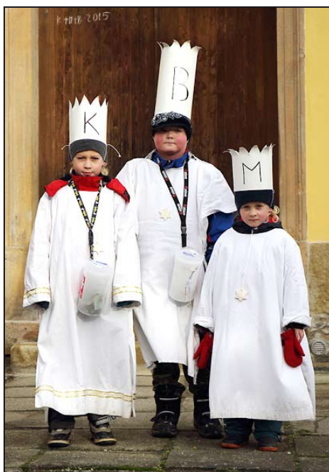
Foto z loňského ročníku sbírky