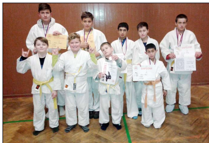
Mohelničtí reprezentanti byli opět úspěšní

Mohelnický zpravodaj je k dispozici také pro mobilní telefony, tablety a stolní počítače na webových stránkách: