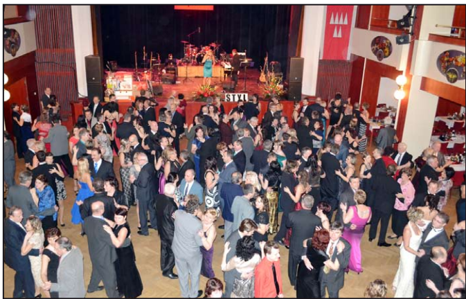
Ilustrační foto z 10. Městského plesu