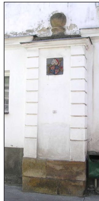
Východní brána v Mohelnici