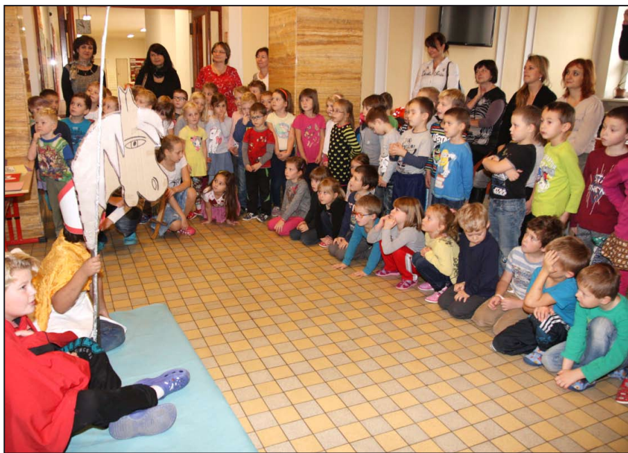
Sv. Martin přijel na bílém koni