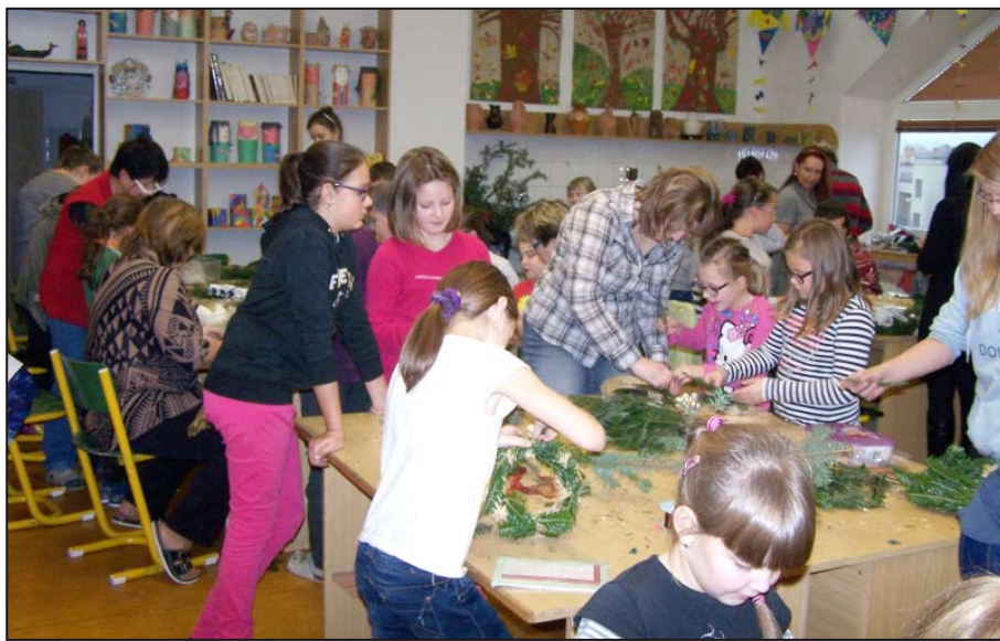
Děti si vyzkoušely, jak se tvoří adventní věnce a jak je vidět z prvního snímku, moc se jim povedly.