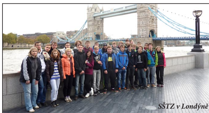
SŠTZ v Londýně

dí. Obohacující je také vnímání jiné kultury a mentality lidí. Sbor pedagogů při SŠTZ Mohelnice a žáci školy děkují touto ces-