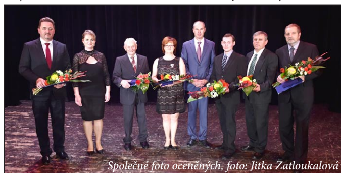
Společné foto oceněných

Nemalou měrou se na pěkném večeru podílely firmy Kámen Zbraslav a.s. a Swietelsky stavební s.r.o., které akci finančně podpořily. Tato společenská událost se stala pro všechny přítomné kulturním a společenským zážitkem.