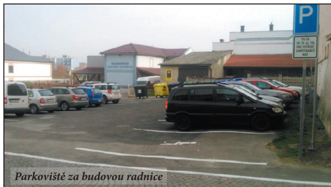
Parkoviště za budovou radnice