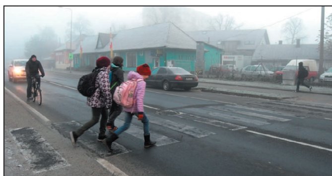
Jeden ze zrušených přechodů na Družstevní ul.

Na popsanou situaci vedení města okamžitě zareagovalo a připravuje rekonstrukci všech přechodů a míst pro přecházení na ulicích Nádražní a Družstevní, včetně vytvoření nových smíšených stezek a rekonstrukce stávajícího veřejného osvětlení od pošty po hřbitov a zařadilo tuto inves-