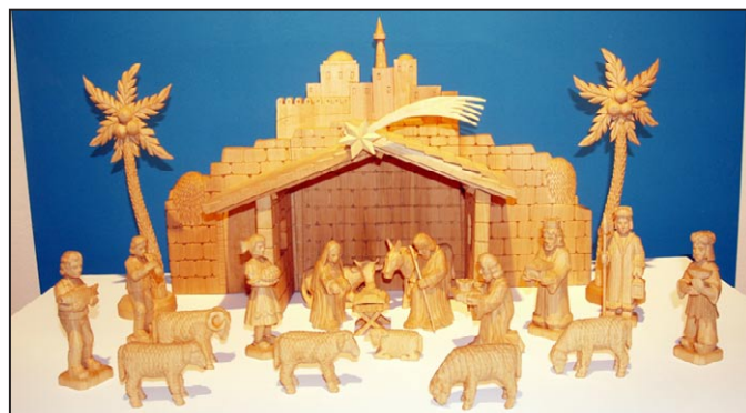
Betlém Lubomíra Ledra z Libiny.

Vánoční atmosféru si mohou od 25. listopadu navodit návštěvníci v mohelnickém muzeu. Ručně vyřezávané betlémy regionálních neprofesionálních autorů, zejména těch současných, představuje výstava s názvem Řezbářské betlémy.