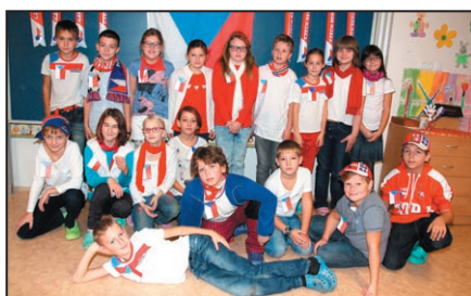
Ze škol / str. 9 a 11