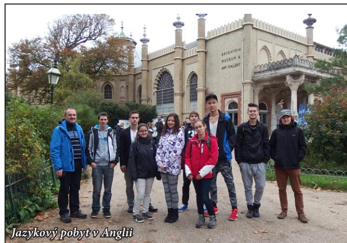
Jazykový pobyt v Anglii