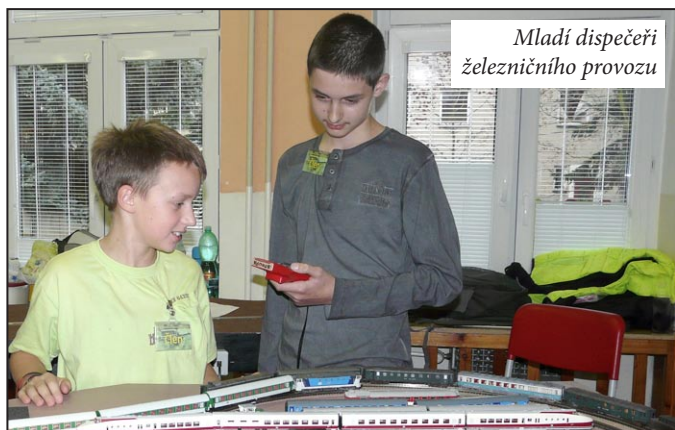
Mladí dispečerů železničního provozu

VYUŽIJTE SLEVOU 8% DO KONCE ROKU A POJEĎTE NA VÍKEND DO TERMÁLU. DÍTĚ OD 2 DO 12 LET NA PŘÍSTÝLCE ZDARMA.