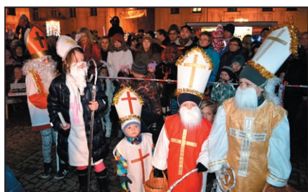
Rozsvícení vánočního stromu / str. 4