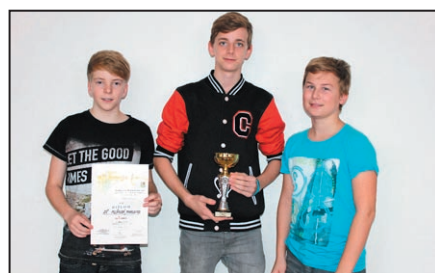
Ze sportu / str. 14-15