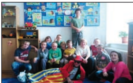
Ze škol / str. 7, 8