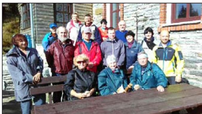
Závěrečného výšlapu se zúčastnilo množství turistů