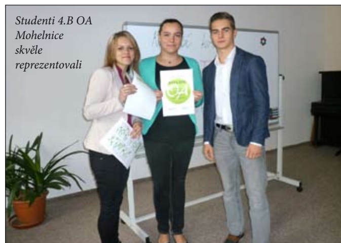
Studenti 4.B OA Mohelnice skvěle reprezentovali