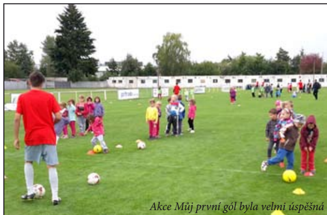
Akce Můj první gól byla velmi úspěšná