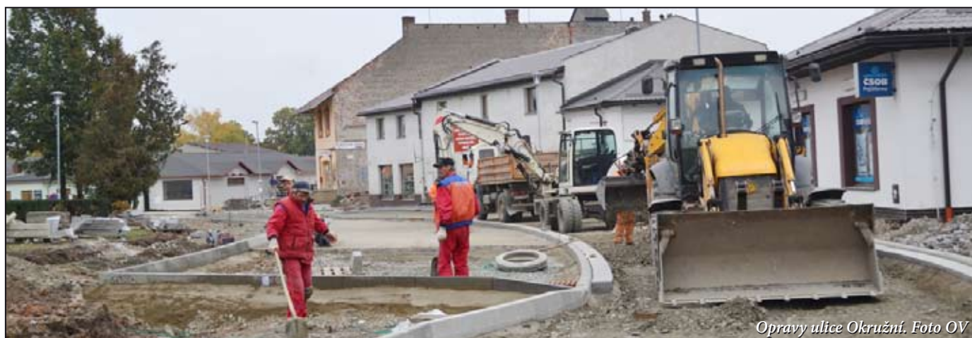
Opravy ulice Okružní.