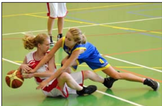
Ze zápasu s SKB Zlín