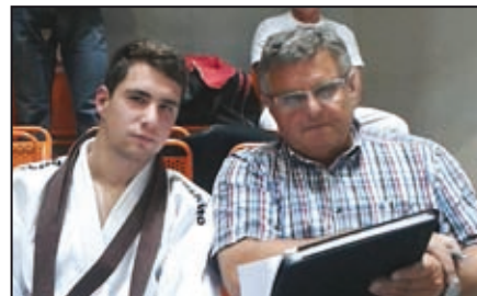
Sport / str. 13, 14