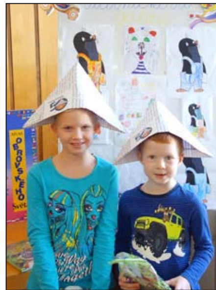
Soutěž s Večerníčkem