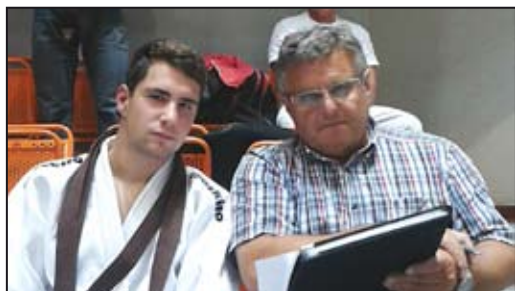
Porada s trenérem