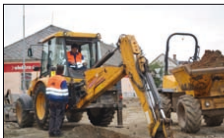
Rekonstrukce mohelnických ulic / str. 3