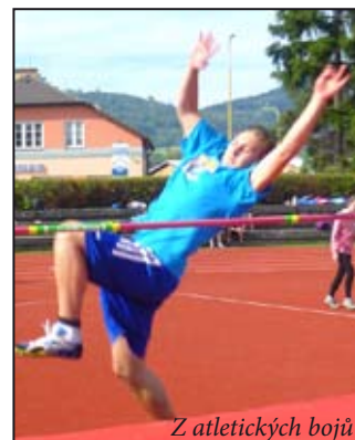
Z atletických bojů

Poslední „venkovní“ soutěží podzimu byla malá kopaná. Oblastní kolo se odehrálo na umělé trávě mohelnického stadionu. Přihlášené školy - Loštice, Úsov, Vodní a Mlýnská si to mezi sebou „rozdaly“ o jedno postupové místo do okresu. První zápas odehrála Mlýnská proti ZŠ Loštice. Hráči této školy byli o hlavu větší a i fyzicky na tom byli lépe. Mohelničtí se dlouho drželi a podávali vyrovnaný výkon. Nakonec je soupeř porazil 2:1. Druhé utkání bylo proti ZŠ Úsov. Zde měla Mlýnská menší převahu, a tak dokázala zápas dovést do vítězného konce, a to v poměru 4:2. Posledním soupeřem byla ZŠ Vodní, což byli papíroví favorité celého turnaje. Po úvodních seznámovacích minutách poměrně vyrovnaného utkání se začínala postupně ukazovat herní převaha soupeře, která se projevila i v konečném skóre, když utkání skončilo 3:0 pro Vodní. A tak se Mlýnská v tomto turnaji umístila na 3. místě, druhá byla ZŠ Loštice a vítězem a postupujícím ZŠ Vodní. Milan Horký, učitel TV