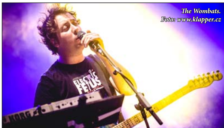
The Wombats.