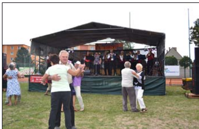
Návštěvníci využili možnosti si zatančit.