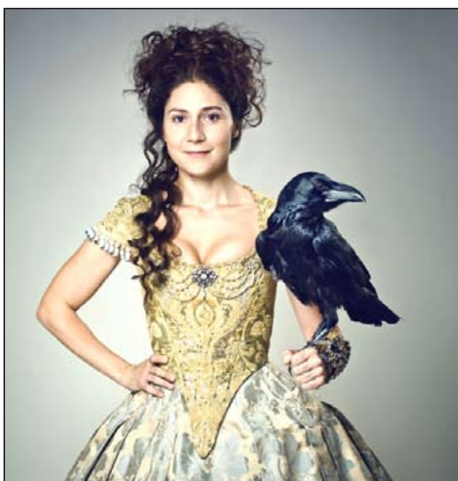
Digitální promítání zahajuje filmem A. Nellis Sedmero krkavců