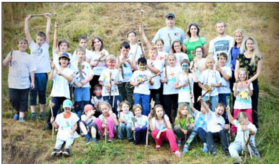
Turnus 3.-10. 7. 2015