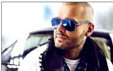
Pozvánka na EHD / str. 7