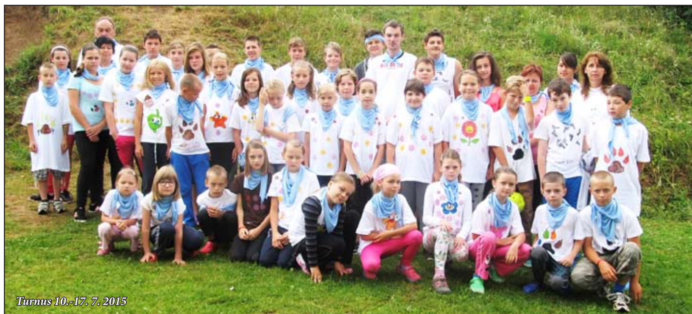
Turnus 10.-17. 7. 2015