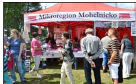
Mikroregion / str. 11