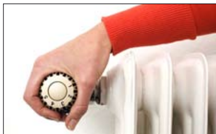
Příprava nové energetické koncepce / str. 5