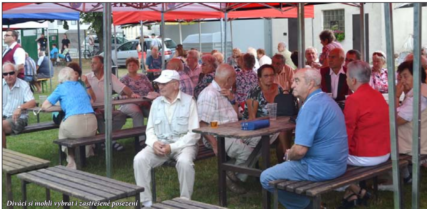
Diváci si mohli vybrat i zastřešené posezení