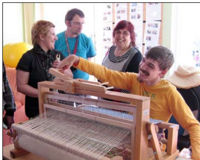
V Okýnku se nikdo nenudí