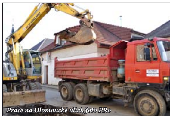
Práce na Olomoucké ulici

Názor starosty: Chybné rozhodnutí začít s rekonstrukcí kanalizace ulice Okružní na podzim roku 2014, v úseku, který nevede nikam. Kanalizace ulice Okružní teče do ulice Olomoucká, která měla být udělána jako první. V obou ulicích se počítalo s rekonstrukcí vodovodu, zatímco v ulici Olomoucká ho provádí jedna firma společně s kanalizací, v ulici Okružní ho prováděla firma, která podle vyjádření zhotovitelské firmy OHL ŽS a.s., neměla dělat v Mohelnici žádné práce. Jako subdodavatele ji schválilo bývalé představenstvo, a výsledek? Práce předané 40 dní po řádném termínu. Další problémy? Neřešené přípojky a přepojení občanů do nové kanalizace. Není vyřešeno dodnes a v těchto dnech se téměř po roce dořešuje. Z mého pohledu absolutní ne-