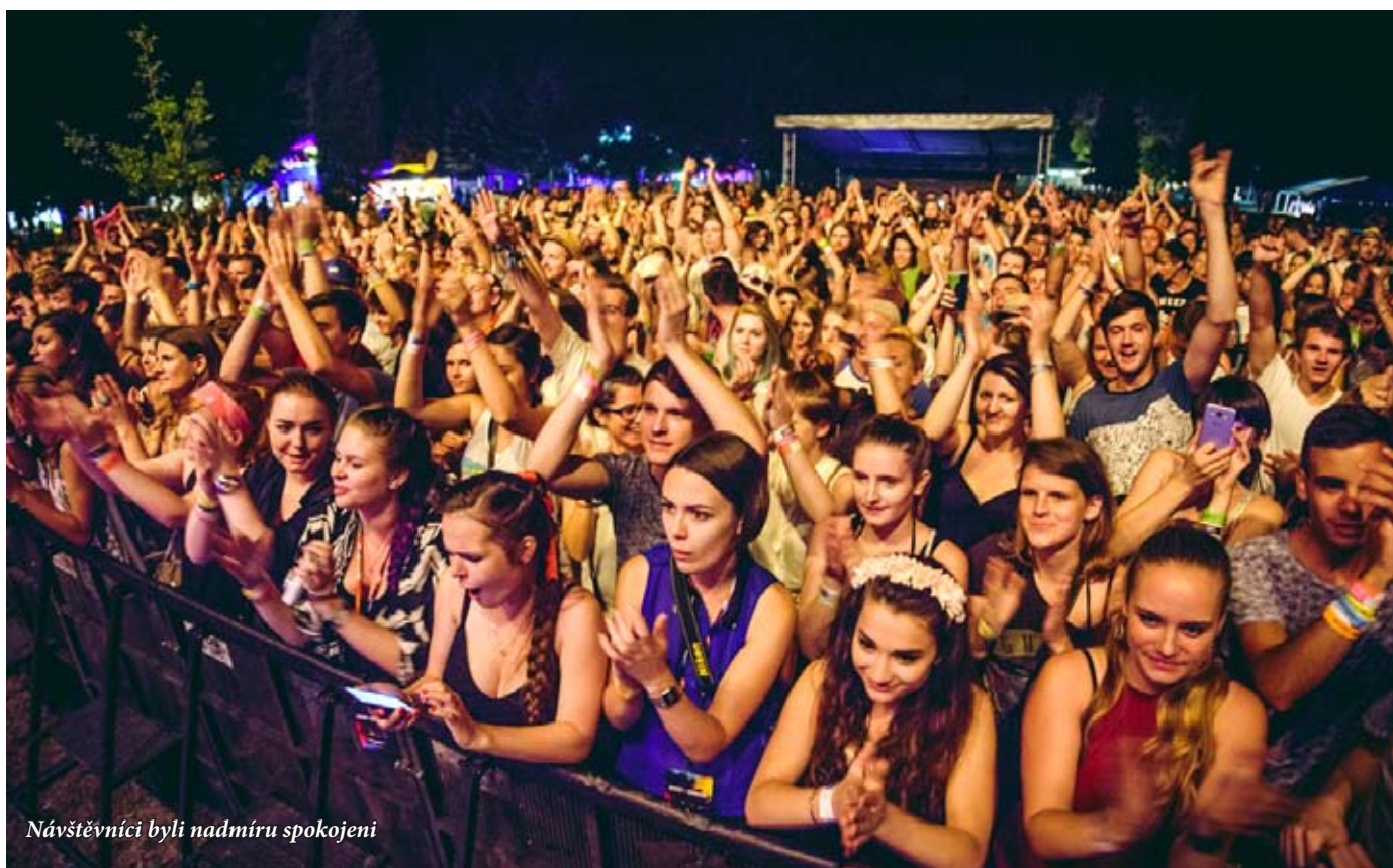
Návštěvníci byli nadměru spokojeni