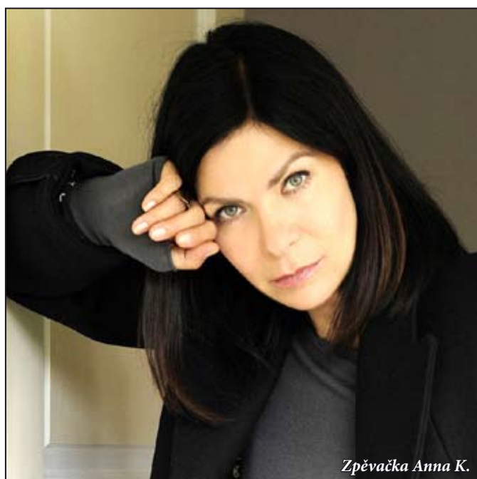
Zpěvačka Anna K.