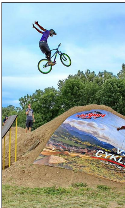
Adrenalinové zážitky jsou pro závod typické.

k dispozici tři jízdy a následně se hodnotila nejlepší jízda.