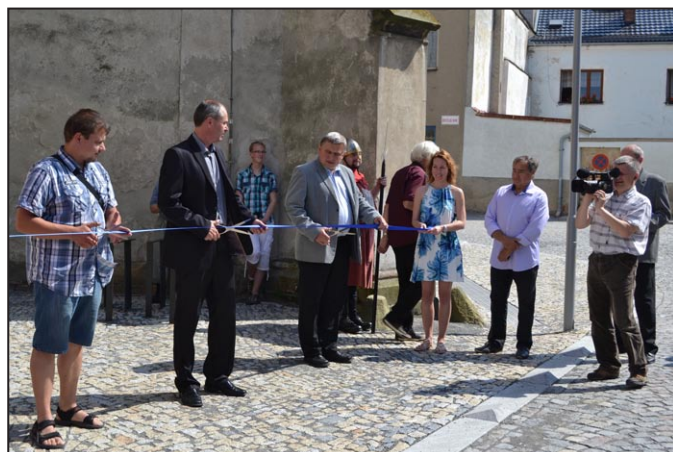
Přestřižením pásky byla věž oficiálně otevřena, foto: OU