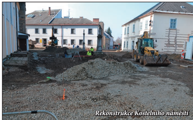
Rekonstrukce Kostelního náměstí