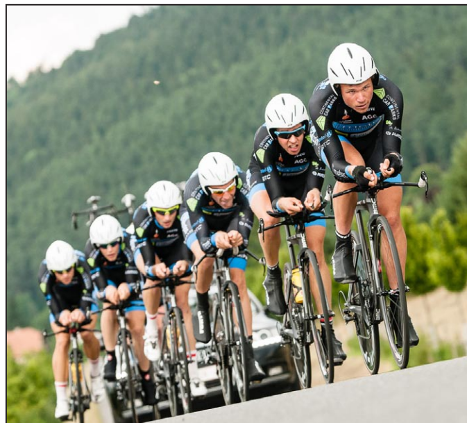
Z loňského ročníku