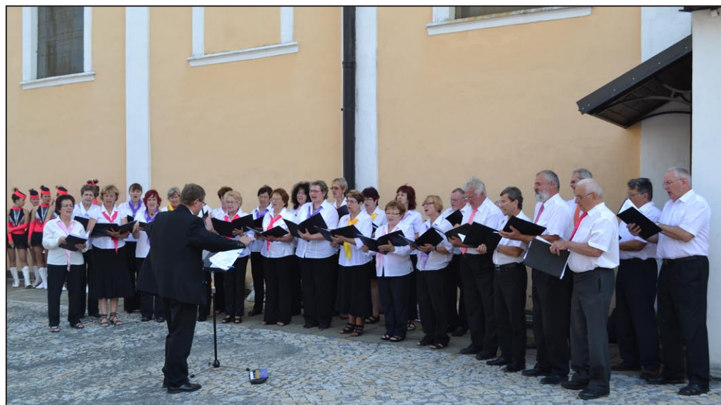
Pěvecký sbor Carmen

Mimo uvedenou dobu na objednání v Infocentru (tel. 583 430 915).