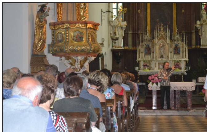
Diváci v zaplněném kostele vychutnávali koncert.