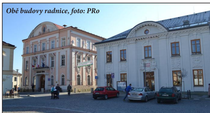
Obě budovy radnice, foto: PRO

Kompletní zápisy jednání jsou k dispozici na webu města www.mohelnice.cz