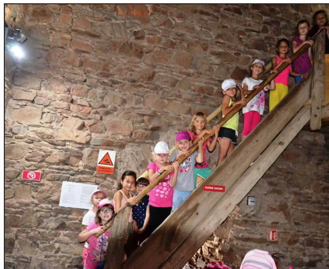
Návštěvníci věže