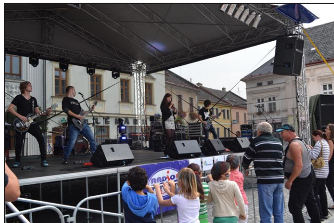
Skupina Toxic Company vystupovala loni na Dnech evropského dědictví.