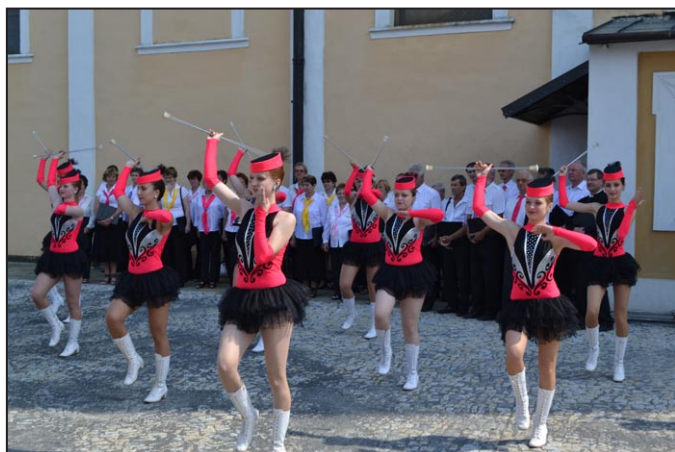
Mažoretky ZUŠ Mohelnice