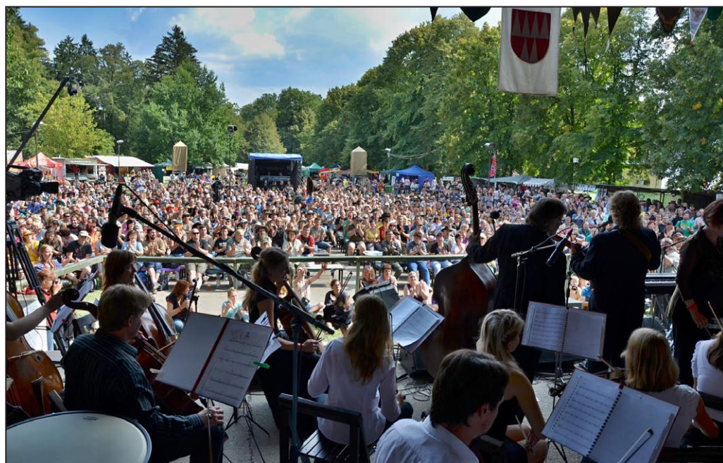
Nezmaři & Symfonický orchestr ZUŠ Uničov na 38. ročníku