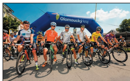
Cyklistický závod / str. 15