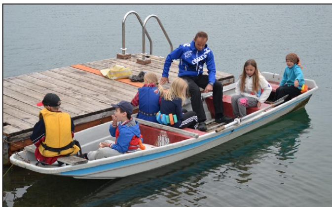
Z Mohelnického vandru