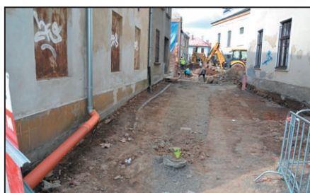
Aktuální uzavírky ve městě / str. 4