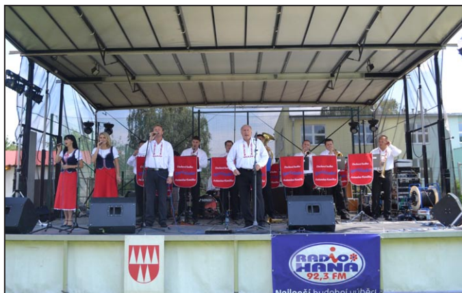
Loni na festivalu zahrála např. Boršičanka.