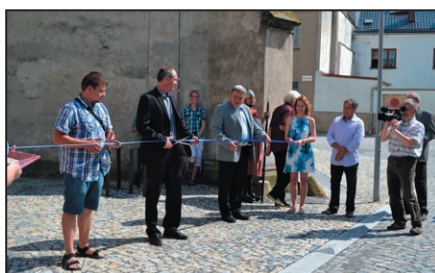
Otevření věže / str. 5