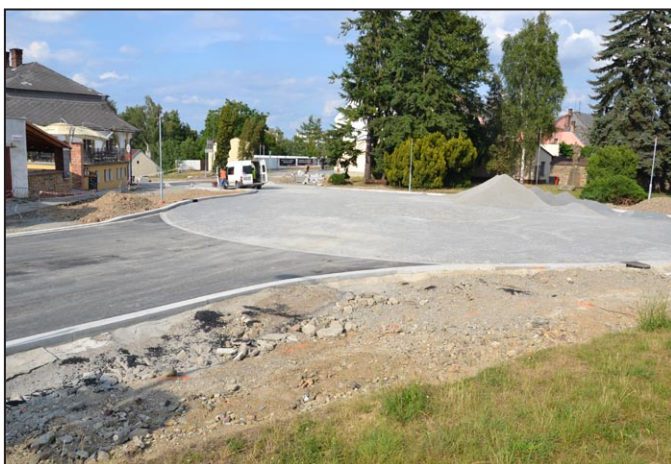
Kruhový objezd U Bruse je téměř dokončen

V rámci rekonstrukce kanalizace ve městě Mohelnice, kterou stavebně provádí firma OHL ŽS a.s., Burešova 938/17, 602 00 Brno 2 probíhají práce pod ochranou těchto aktuálních uzavírek - úplná uzavírka ulice Vodní do 25. 7. 2015, místní část Podolí do 30. 8. 2015 a uli-