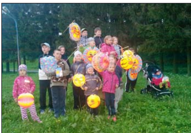
Děti měly krásné lampiony.