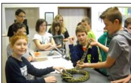
Školní akce / str. 8