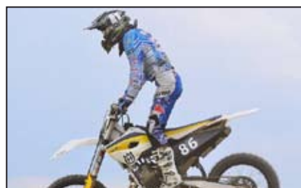
Sport / str. 14-15