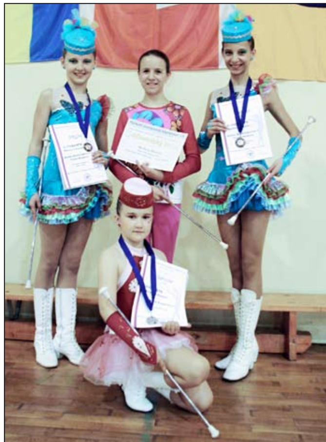
Všechny úspěšné reprezentantky.