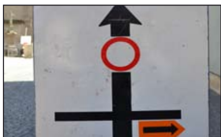
Uzavírky ve městě / str. 3