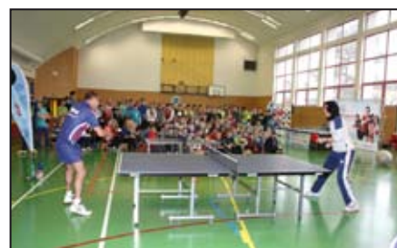
Sport / str. 14-15