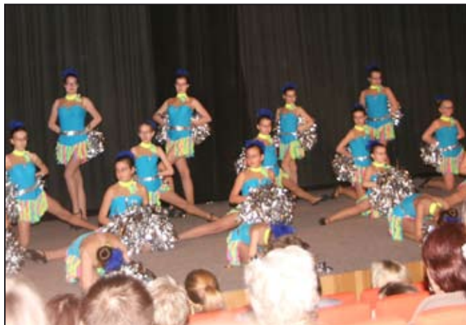
Rio a Madagaskar – ZUŠ Mohelnice