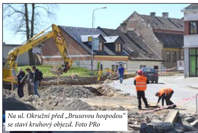
Na ul. Okružní před „Brusovou hospodu“ se staví kruhový objezd.

Mimo akci kanalizace v současné době probíhá