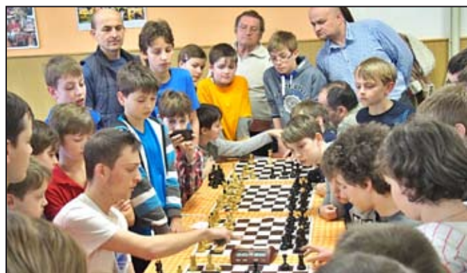
O dramatický závěr turnaje se postaral souboj o 1. místo v nejstarší kategorii.