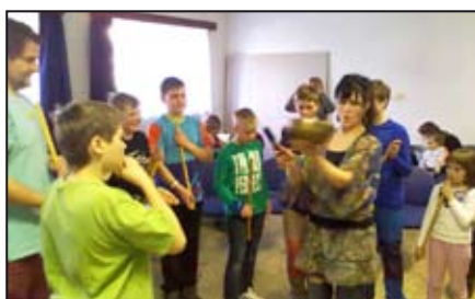
Mikroregion Mohelnicko / str. 8