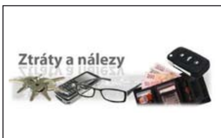
Ztráty a nálezy / str. 4