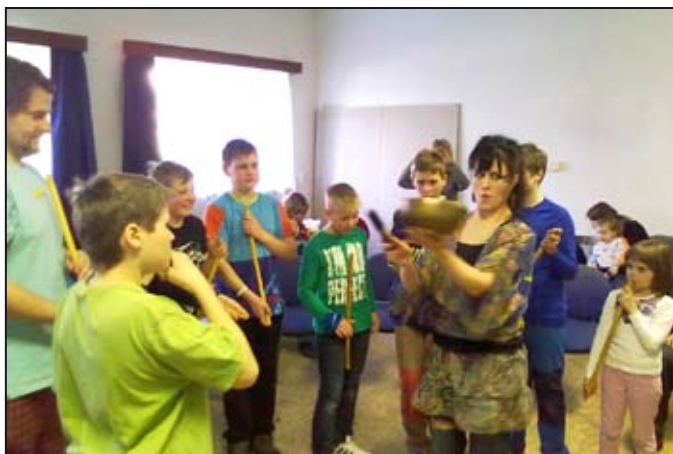
Muzikofiletika v praxi

Na Velký pátek 3. 4. 2015 si osadní výbor Květina připravil pro všechny děti bez rozdílu věku akci hodinu muzikofiletiky.