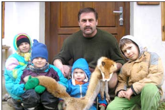
Noc s Andersenem na Studené Loučce byla velmi napínavá

Pracovníci Domu dětí a mládeže Magnet Mohelnice zvou nejen všechny děti a rodiče, ale i ostatní občany města ke zhlédnutí výsledků práce dětí ve volném čase. Vstup zdarma!