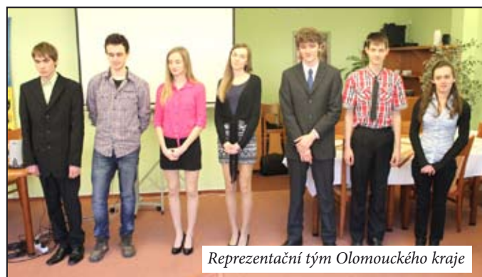
Reprezentativní tým Olomouckého kraje