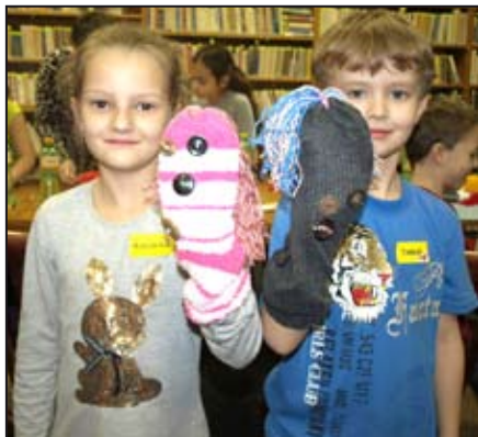
Děti si vyráběly lichožrouty