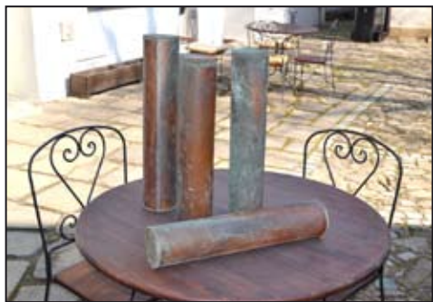
Schránky z věže vydaly své tajemství.

V minulosti bylo již v Mohelnickém zpravodaji uvedeno několik krátkých článků k historii kostela sv. Tomáše v Mohelnici i jeho věže. Zatímco kostel patří Římskokatolické farnosti v Mohelnici, tak jeho věž je od nepaměti majetkem města Mohelnice, neboť byla součástí obrany města nejen před blížícím se nepřítelem, ale i pro včasné hlášení požáru uvnitř města.