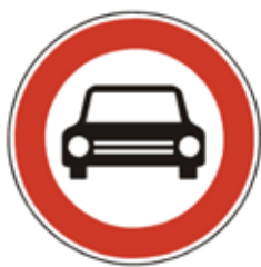
Uzavírky silnic / str. 3