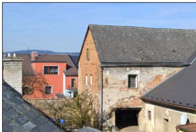
Středověký dům v Hradební ulici

Zdeněk Doubravský, Vlastivědné muzeum v Šumperku