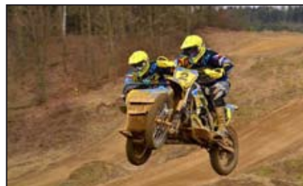
Sport / str. 14-15