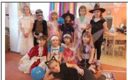
Zápis do školek / str. 6