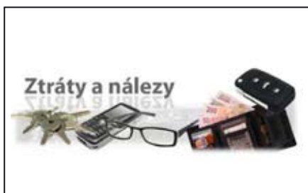
Ztráty a nálezy / str. 3