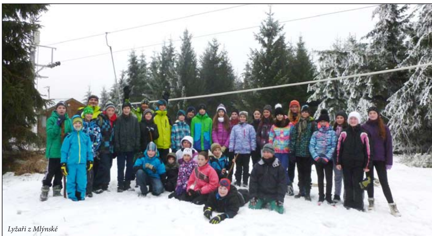
Lyžaři z Mlýnské