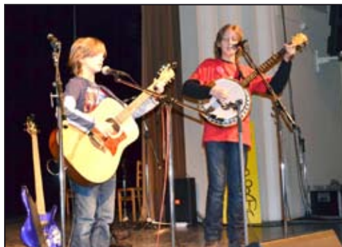
Duo Dvě Ká