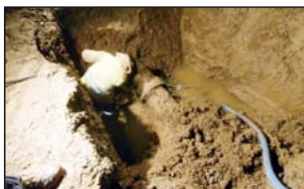
Rekonstrukce kanalizace / str. 2