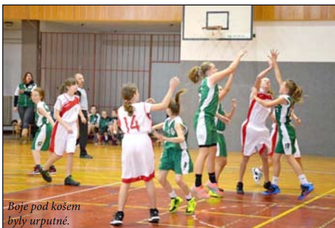
Boje pod košem byly urputné.

V sobotu 31. ledna naše mladé basketbalčky sehrály dvě utkání ve Šlapanicích. První zápas byl vyrovnaný, ale v tom druhém zápase soupeřky jasně přehrály.