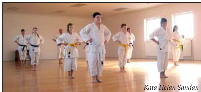
Kata Heian Sandan