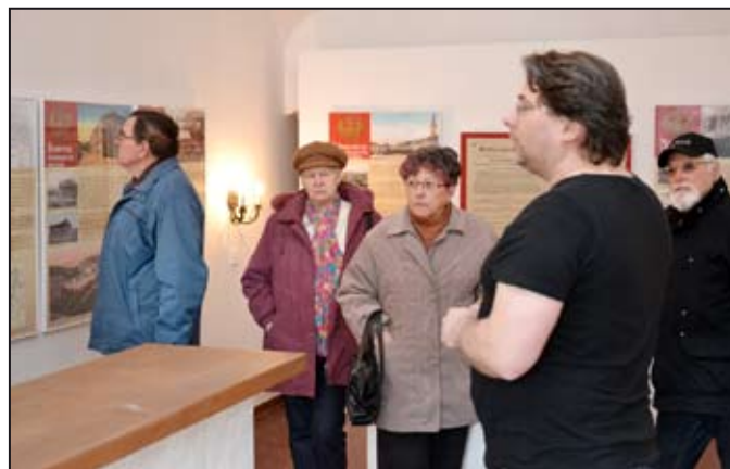
Členy oddílu turistiky výstava plně zaujala