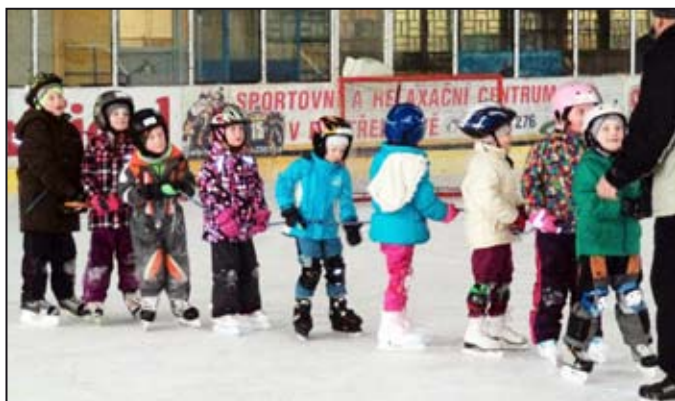
Bruslení se dětem moc líbí.