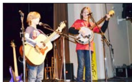
Úspěch na Portě / str. 11