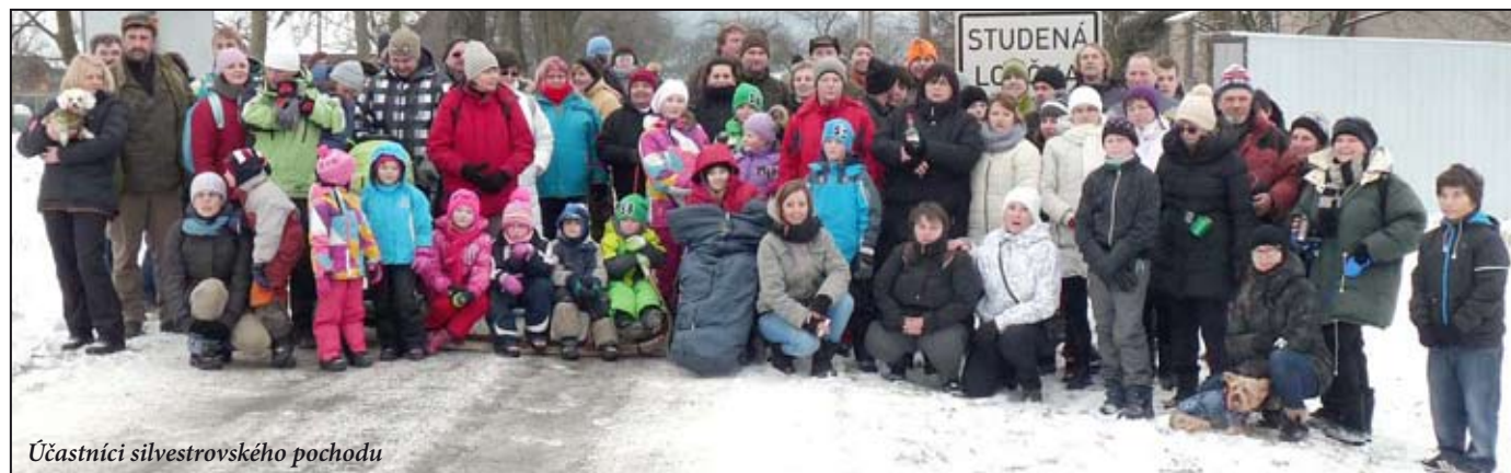
Účastníci silvestrovského pochodu