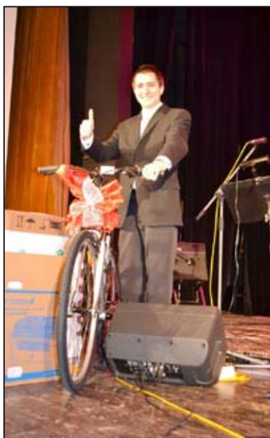
Výherce jízdního kola