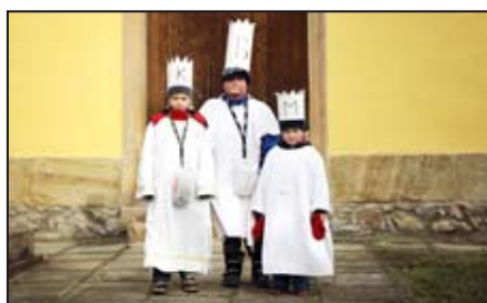
Výsledky Tříkrálové sbírky / str. 3