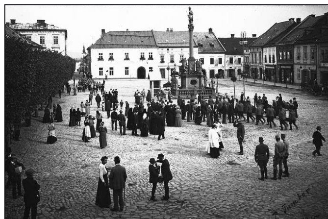
Slavnost při odhalování „štítu vítězství“

autor: Eduard Teichmann, HISTORIE DER STADT MÜGLITZ, překlad: Ctirad Štipl, kronikář měsata Mohelnice