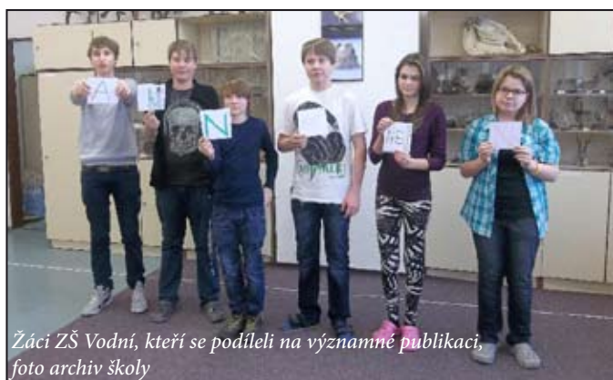
Žáci ZŠ Vodní, kteří se podíleli na významné publikaci, foto archiv školy

Pod vedením Mgr. Světlany Kadlčkové, která je koordinátorkou environmentální výchovy, se žáci ZŠ Vodní podíleli na vzniku této publikace. Do pilotního ověřování aktivit, které jsou součástí této