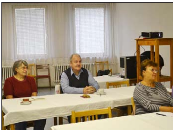
Mohelnická VU3V je již dobře známá.