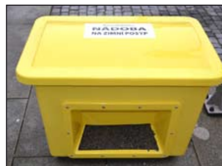
Žluté nádoby s posypem najdete např. na náměstí Svobody

Radnice tímto děkuje všem majitelům domů na náměstí za aktivní přístup ke vzniklé situaci a za to, že tak radnici přivedli k popsání nápadu. Snad se nám podaří společnými silami udržovat náměstí po opravách krásné a schůdné! Odbor SÚRI