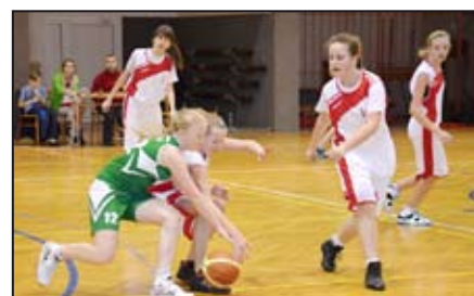
Basketbalistky tvrdě bojují / str. 15