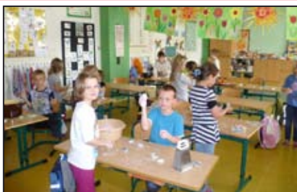
Začínají zápisy do škol / str. 7