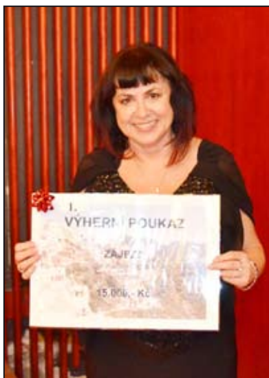
Výherkyně 1. ceny - zájezdu