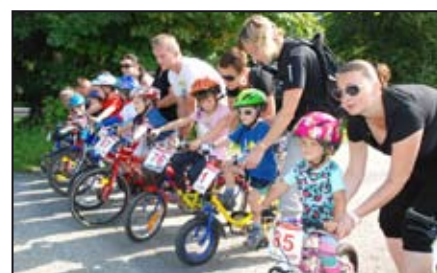
Cyklisté poměřili síly / str. 14