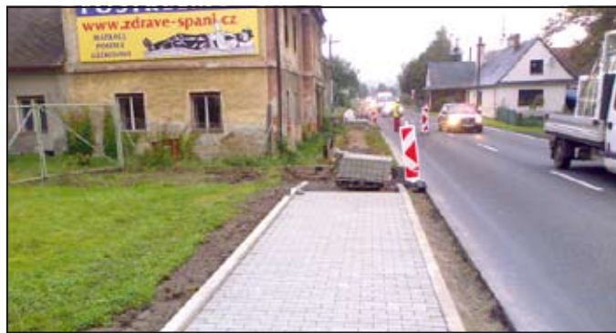
Stavba chodníku v Libivé pokračuje rychlým tempem.

řený funkcí starosty mohelnické radnice. V místě stavby dočasně omezí řidiče zúžená vozovka, dotyčnou částí obce musí projíždět sníženou rychlostí. Kromě nového chodníku v Libivé opravila Mohelnice v poslední době vícero místních komunikací v samotném městě i jeho místních částech. Obyvatelé na všechny tyto investice reagovali bez výjimky kladně. Pavel Kuba (J. Kropáč)