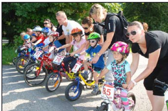
Cyklistického závodu se zúčastnila rovná stovka dětí.

a kategorie mladších žáků – 11 – 12 let. Starší žáci (13 – 15 let) již absolvovali 1 malý okruh dlouhý 24 km na trati vyvedené do okolí Mohelnice. Trasa hlavního závodu představovala 50kilometrový okruh, který vedl po zaváděcím asfaltu do Křemačova, z ostra do Mírova, Svojanova a Maletína, kde byla pro závodníky připravena první občerstvovací stanice. Závod pokračoval kolem větrné elektrárny na Jahodnici a lesem kolem dalších elektráren nad Svojanovem přes Žipotín, Studenou Loučku, a znovu nad Mírov, kde bylo místo pro druhou občerstvovačku. Pak už se závodníci vraceli k Mohelnici, kde si v parku obkroužili trasu dětí vedoucí do cíle, s projíždkou brodu řeky a sjezdem schodů. Po závodě čekalo na závodníky všech kategorií občerstvení v Motoarestu ATC Morava, pro vítěze byly připraveny hodnotné ceny a pro všechny