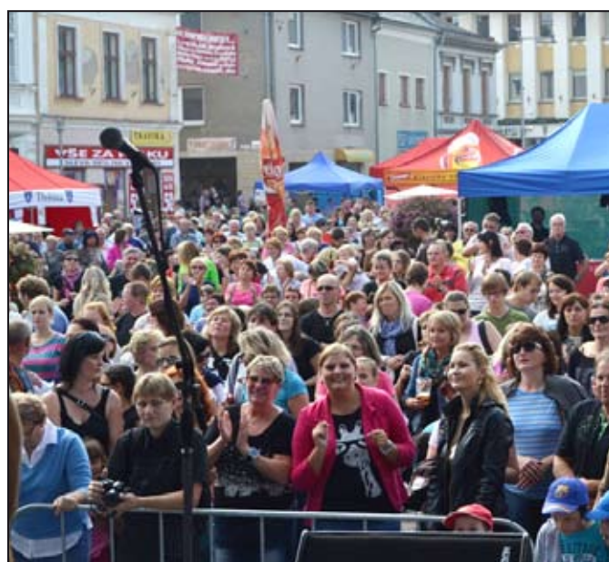
Dny evropského dědictví a přidružené akce přilákaly do Mohelnice davu lidí.

V sobotu 13. září od dopoledních hodin se na pódiu na náměstí Svobody vystřídal množství interpretů z hudebního světa. Program se rozjel pořadem pro děti, následoval koncert dechové hudby Mohelanka. Největší hvězda dne Petr Kolář se skupinou zpíval snad pro největší počet diváků v historii konání Dnů evropského dědictví. Bára Basičková zazpívala největší hity a překvapila repertoárem od slavných kolegů. Ready Kirken a místní kapela Toxic company rozezpívali publikum. Obdivuhodnou show připravila skupina Claymore – skotské sukně, dudy, housle, ale i elektrická kytara diváky nadchly. Revival skupiny Nightwish sice koncertoval za deště, ale to přítomné nerozhodilo a vychut-