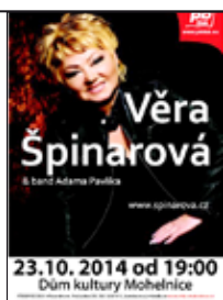
Do Mohelnice zavítají hvězdy / str. 15