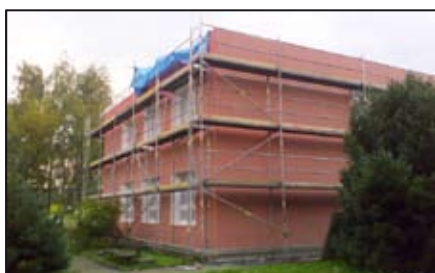
Město zateplilo další budovu / str. 3