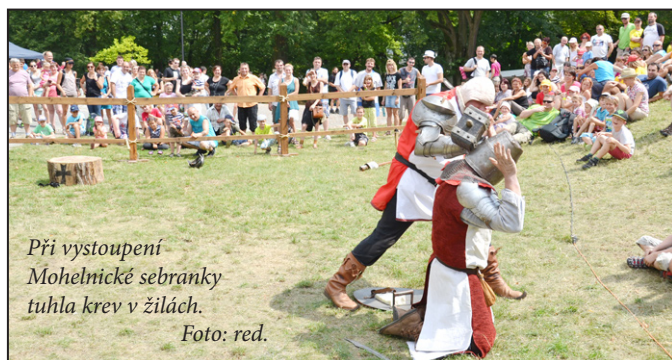
Při vystoupení Mohelnické sebranky tuhla krev v žilách.