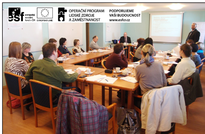
Vzdělávání úředníků mohelnické radnice má přispět ke kvalitnějšímu výkonu jejich práce, což mají zaznamenat i sami občané.

V rámci projektu se uskutečnily i takzvané workshopy, které měly za úkol průběžně informovat účastníky o projektu, vyhodnocovat výsledky projektu a řešit případné připomínky či náměty účastníků.