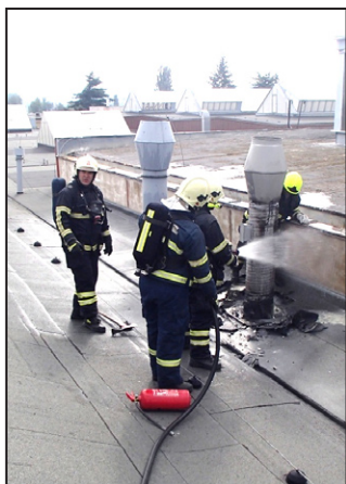
Mohelničtí hasiči patří mezi nejvytíženější jednotku v regionu. K zásahu vyjíždí každý druhý den.

Odpovědi na množící se dotazy k problematice výjezdů jednotky sboru dobrovolných hasičů města Mohelnice jsou sice jednoduché, ale problematika je značně rozsáhlá. Na začátku je nutno podotknout, že město zřizuje a spravuje jednotku sboru dobrovolných hasičů na základě § 68 zákona č. 133/1985 Sb., o požární ochraně ve znění pozdějších předpisů.