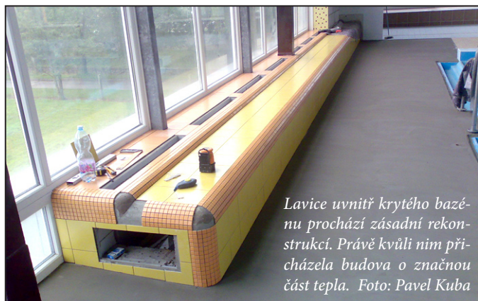
Lavice uvnitř krytého bazénu prochází zásadní rekonstrukcí. Právě kvůli nim přicházela budova o značnou část tepla.

Krytý bazén v Mohelnici se dočká dalšího velmi podstatného vylepšení. Měření speciálními detektory odhalilo, že budova má stále velmi vysoké tepelné ztráty, a radnice tak za její vytápění utrácela peníze zbytečně.