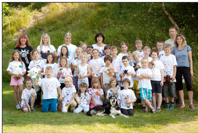
Letních táborů se zúčastnily desítky nadšených dětí.

Za všechny táborníky Dagmar Zajíčková a Eva Skřivánková - hlavní vedoucí tábora