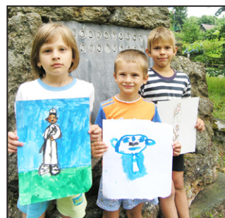
Děti poznaly útrapy války, naštěstí jen z vyprávění.