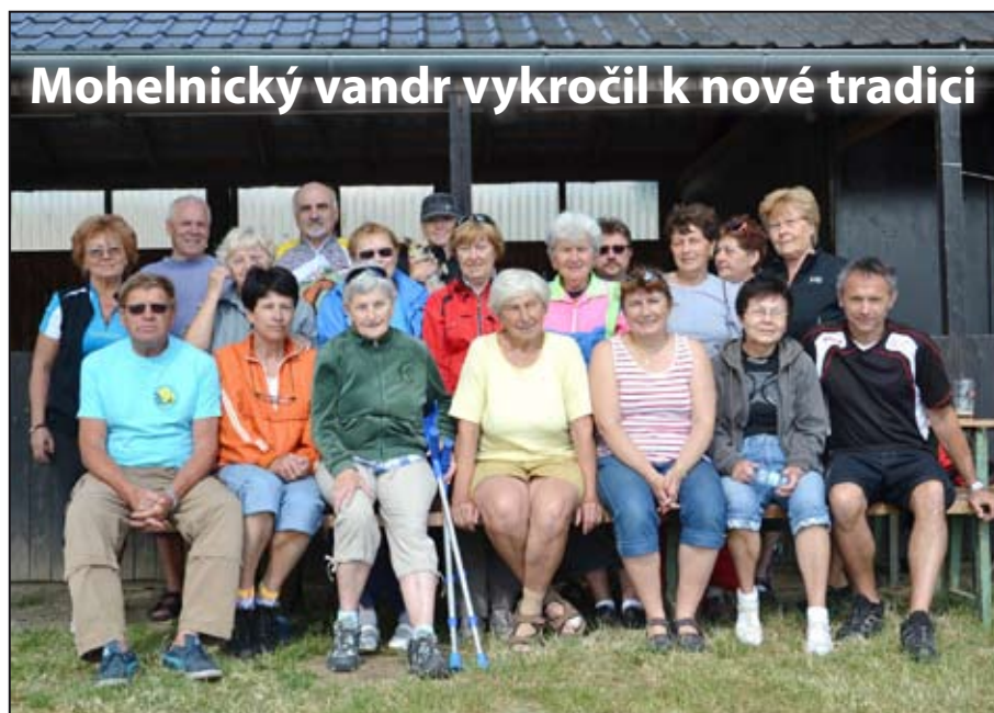
Prvního ročníku Mohelnického vandru se zúčastnilo sto pět a třicet lidí.