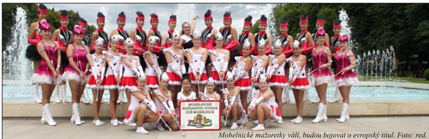
Mohelnické mažoretky válí, budou bojovat o evropský titul.