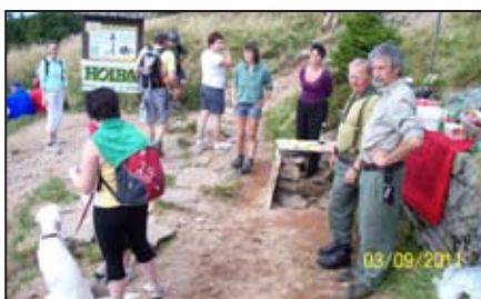
Výšlap k prameni Moravy / str. 4