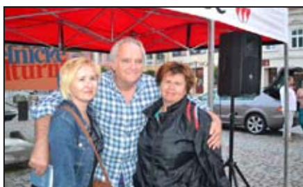
Angličan pobavil Mohelnici / str. 3