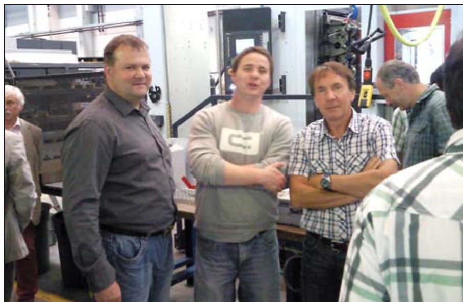
Mohelničtí učitelé nabírali zkušenosti v zahraničí.