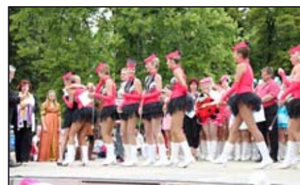
Mažoretky jedou do Evropy / str. 11