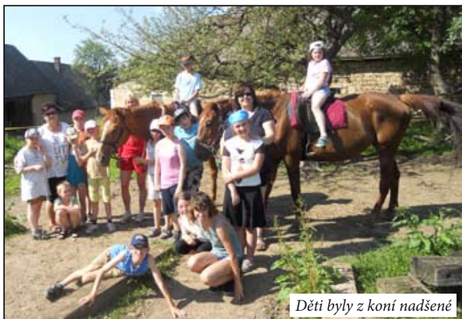
Děti byly z koní nadšené