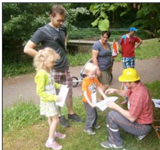
Znáte Bořka všechno správi...