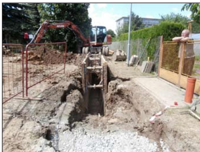
Výkopové práce k šachtě 12 – U Potoka, foto: AM

Projekt byl zahájen předáním staveniště na Horních Krčmách, lokalitě U Potoka a Dolních Krčmách. Od 5.5.2014 probíhají stavební práce na Horních Krčmách, od 12.5.2014 v lokalitě U POTOKA a od 9.6.2014 začaly výkopové práce na Dolních Krčmách. Další výstavba v jednotlivých lokalitách se bude rozvíjet postupně, dle priorit a stupně připravenosti podrobné projektové doku-