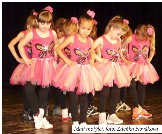
Malí motýlci, foto: Zdeňka Nováková