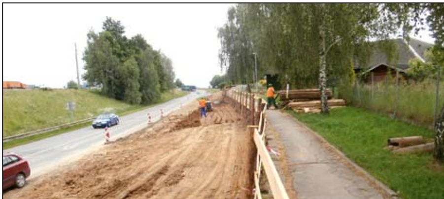
Hutnění výkopu kanalizace pod cyklostezkou

Na jaře letošního roku byly zahájeny stavební práce na zakázce Cyklostezka Mohelnice – Loštice, místní část Žádlovice. Tato cyklostezka bude spojit Újezd přes Dolní Krčmy a ulici U Potoka s Mohelnicí, dále Mohelnici přes Dolní Válc a Horní Krčmy s obcí Žádlovice. Staveniště bylo řádně předáno a práce se rozběhly téměř na všech stavebních úsecích. V úsecích, kde se kříží práce na cyklostezce s rozsáhlým projektem „Horní Pomoraví II“