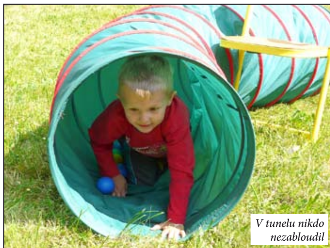
V tunelu nikdy nezabloudil