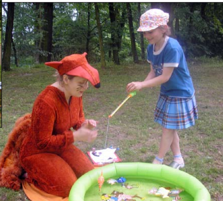
Už se chytne, mňam mňam