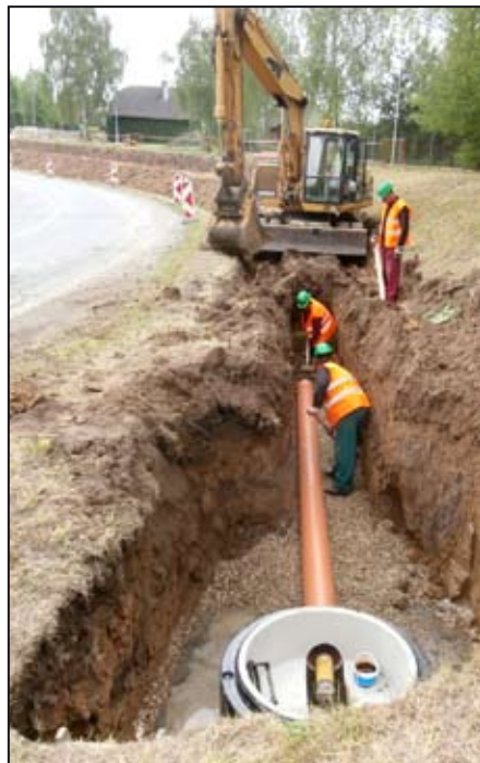
Položení 1. kanalizačního potrubí

Od 5.5.2014 probíhá na území města Mohelnice výstavba splaškové kanalizace a kanalizačních přípojek pro bezpečné a hygienické odvedení splaškových vod z domácností