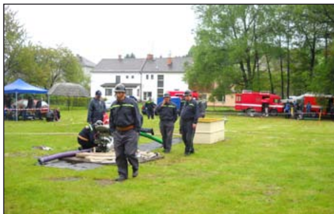
Připravené hřiště pro okrskovou soutěž

Sledujte novou podobu Mohelnické televize – www.mohelnickatelevize.cz