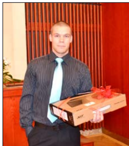
Výherce první ceny – notebooku.