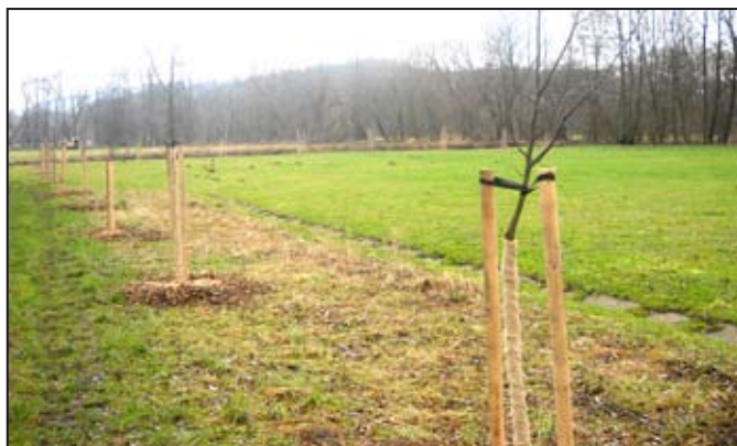
Nové stromy.