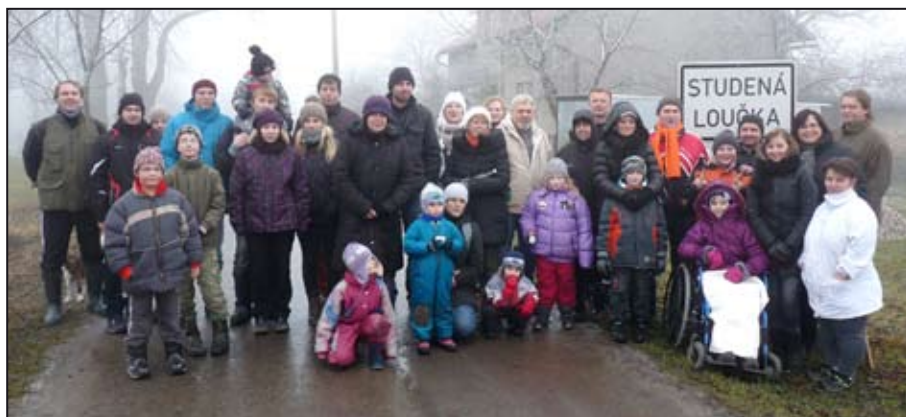
Účastníci silvestrovské vycházky