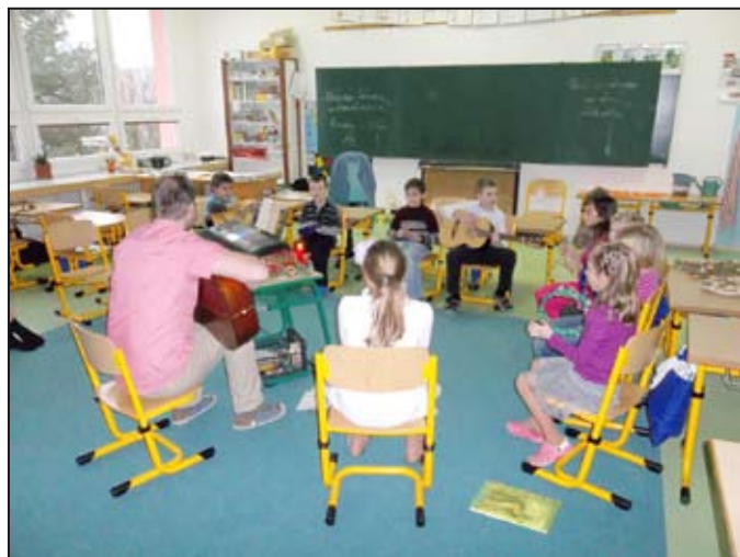
Všude vládla příjemná atmosféra.