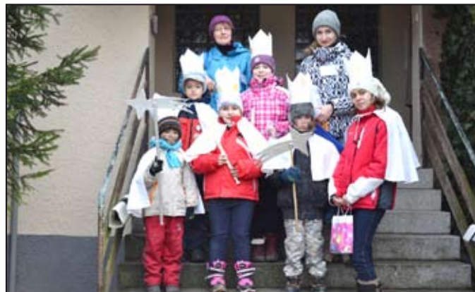
Koledníci v Libivě