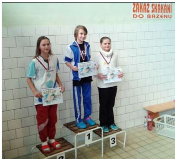
Na stupních vítězů