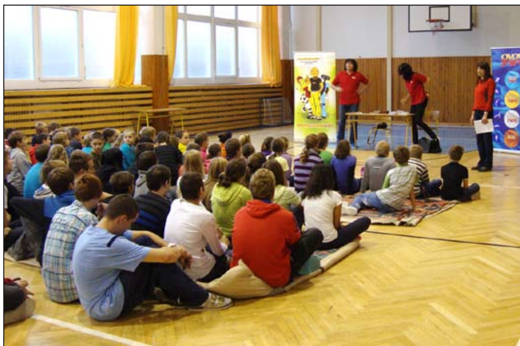
Šárka Kašpárková podporuje sportování dětí

V úvodu se nám Šárka představila - s úsměvem a skromností jí vlastní. Věděli jste, že začínala jako basketbalistka a že na olympiádě v Barceloně reprezentovala tehdejší Československo jako skokanka do výšky? Ke svým největším úspěchům Šárka řadí první místo z Univerziády, stříbro z halového mistrovství Evropy v Göteborgu a bronz z olympijských her v Atlantě. Na mistrovství světa v Athénách v roce 1997 skočila nový český rekord – 15,20 m, a to jí vyneslo na první příčku. Protože Šárka i její trenér jsou sportovci tělem i duší, vyzvali několik chlapců a dívek zasoutěžit si ve skocích přes švihadlo, protože to je jedna z disciplín Odznaku všestrannosti. Povzbuzující huronský potlesk publika přispěl ke správné atmosféře. V další části besedy pohovořili atleti o pohybovém programu „Odznak všestrannosti“ a vyzvali žáky k jeho plnění. K jistě velkým a nezapomenutelným