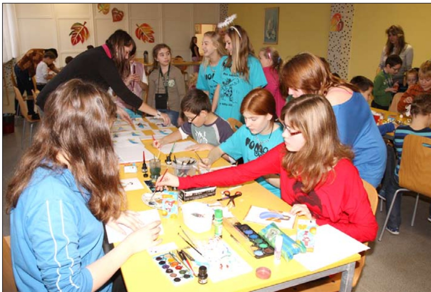
Tvořivé dílny hýřily nápady