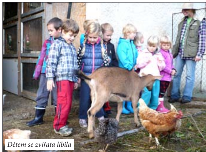
Dětem se zvířata líbila