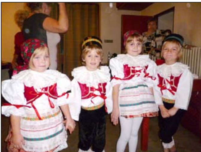
Děti byly šikovné a slušelo jim to.