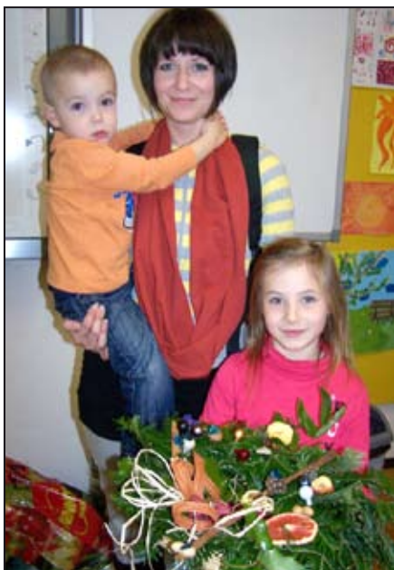
Adventní dílny jsou velice populární