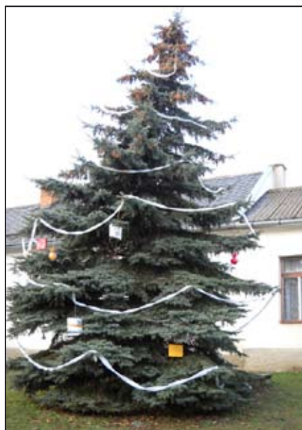
Křemačovský vánoční strom

Při příležitosti tradiční mikulášské nadílky (7.12.2013), která se koná v prostorách obecní budovy - staré školy, byl poprvé v historii Křemačova rozsvícen venkovní vánoční strom. Strom je umístěn v parčíku mezi obecní budovou a místní hasičskou zbrojnicí. Pohled na něj jistě potěší každého obyvatele Křemačova i návštěvníky. Dobrovolní organizátoři z řad občanů se rozhodli, že tento strom nazdobí a také zajistí odpovídající elektrické připojení.