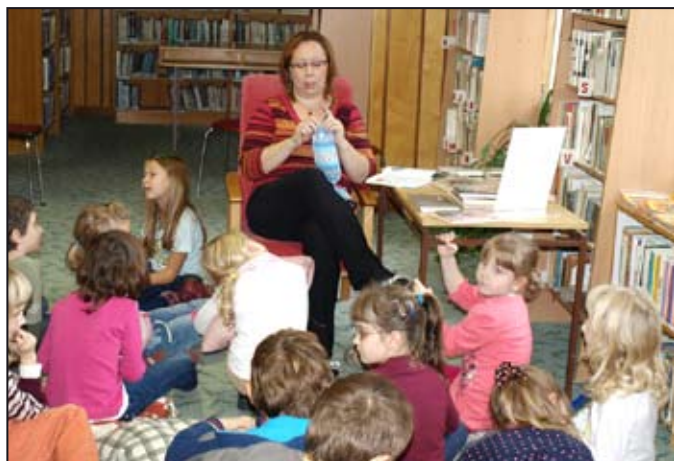
Děti si poslechly pohádku