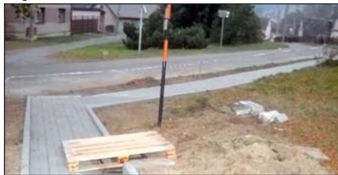
Opravy vpusti

Občané Křemačova se po více jak 35 letech dočkali opravy chodníku na návsi. Zadání bylo následující - chodník kvalitně opravit současnou technologií, zvednout jeho rovinu na úroveň okolního terénu a použít zámkovou dlažbu po celé délce.