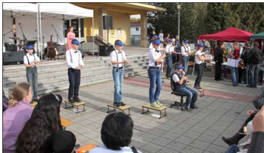
Na Dni Charity vystupovaly také mohelnické děti