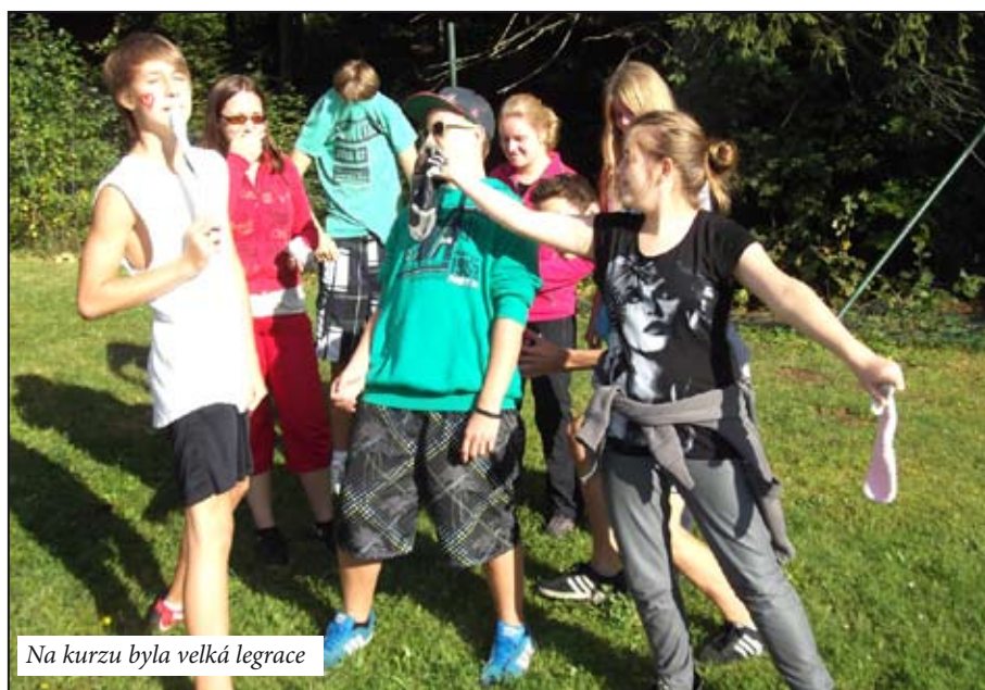
Na kurzu byla velká legrace