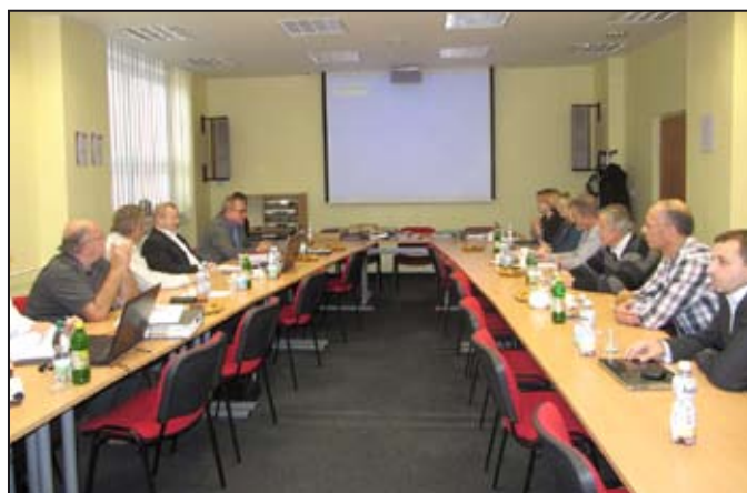
První obchodní den 18.10.2013