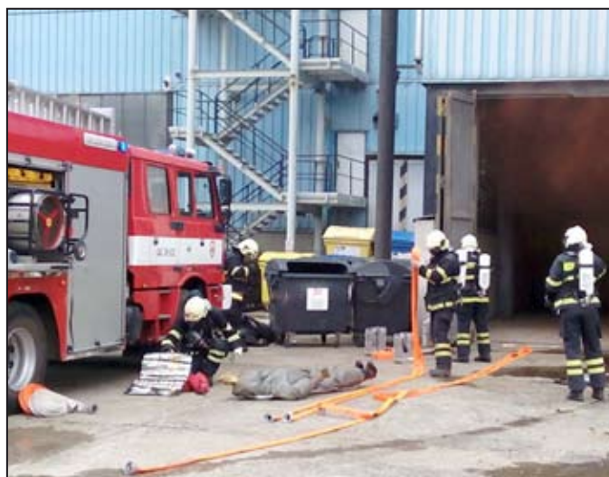
Foto z taktického cvičení