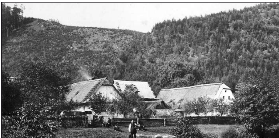
Markrabka ve 40. letech minulého století, foto: archiv autora.

POHÁDKY A POVĚSTI, Martin Strouhal (Fajrmón - hraniční kámen, Ohnivý pes - kříž u zatačky, Ohnivě sudy - Obersko, Poslední kámen z královské cesty - Hamperk)