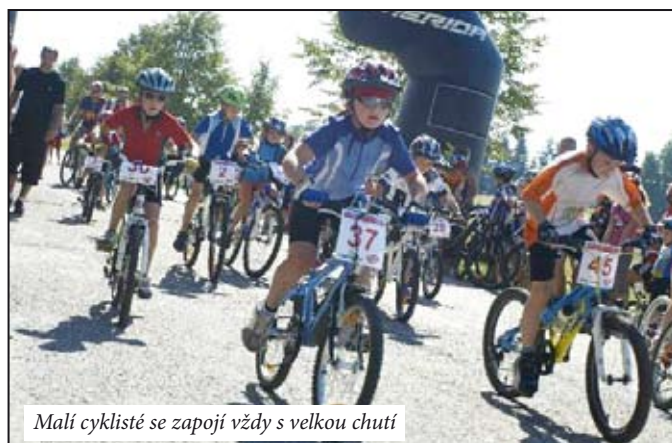
Malí cyklisté se zapojují vždy s velkou chutí

tu ATC Morava, pro vítěze byly připraveny hodnotné ceny a pro všechny závodníky bohatá tombola. Děti svou nevyčerpatelnou energii soustředily po závodě na skákacím hradu, zdárnému průběhu akce a příjemné atmosféře přispělo krásné letní počasí, které panovalo celou neděli. Ke startu se přihlásilo včetně nejmenších dětí 190 závodníků. Tento počet svědčí o vysokém zájmu cyklistů o absolvování Mohelnického ½ maratonu, a o tom, že pořadajícím Bikesport teamem organizováním teprve třetího ročníku získal pevné místo a oblibu mezi dalšími mnoha závody v pohárové soutěži pro amatérskou cyklistickou veřejnost Šumperský pohár horských kol. A že se závod líbil i letos, dokazují pozitivní ohlasy, zveřejněné na diskusním fóru pohárových webových stránek: „ Super závod, super trať, super ceny, výborná organizace, výborné značení - prostě Mohelnice neměla chybu! “ Za náročnou přípravu celého závodu patří poděkování především pořadajícím Bikesport teamu Mohelnice