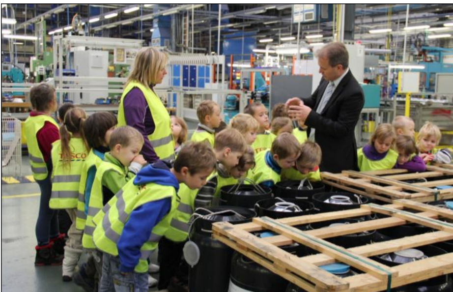
Návštěva dětí z mohelnických mateřských škol v areálu Siemens Elektromotory Mohelnice.

Počáteční obavy, zda bude pro děti celý počin natolik zajímavým zpestřením, jak dospělí předpokládají, se rozplynuly již po návštěvě výrobního závodu. „Děti byly