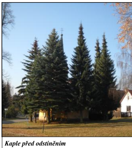
Kaple před odstíněním

Výborná spolupráce mezi osadním výborem, sborem dobrovolných hasičů a klubem maminek zajistila pro občany Křemačova i blízkého okolí nemálo společenských setkání. Tyto setkání jsou vždy ku prospěchu obce. Na začátku roku se v obvyklém termi-