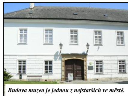
Budova muzea je jednou z nejstarších ve městě.