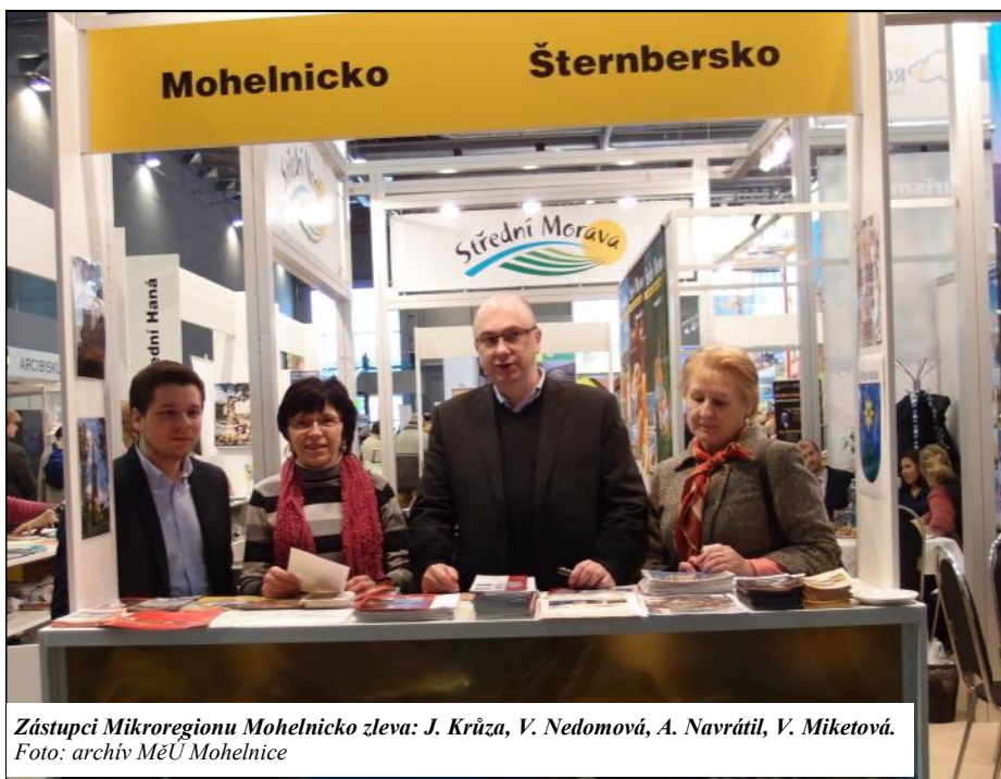
Zástupci Mikroregionu Mohelnicko zleva: J. Krůza, V. Nedomová, A. Navrátil, V. Miketová.