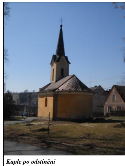
Kaple po odstínění

Z investičního hlediska byla zahájena kompletní oprava dominanty na návsi – kaple.