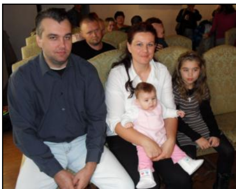
Ilustr. foto z vítání občánků.

? Zajímá vás něco a chcete se zeptat vedení města, pracovníků Městského úřadu v Mohelnici nebo z organizací zřízených městem? Můžete poslat svůj dotaz do redakce. My za vás potom