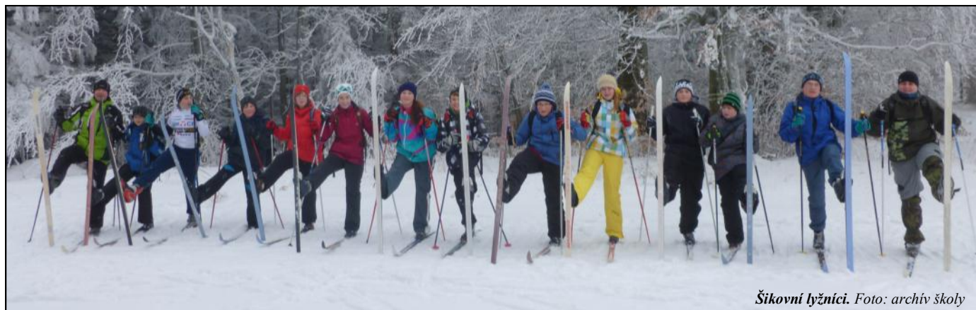
Šikovní lyžníci.

V týdnu od 19. do 25. ledna vystřídaly děti ze 7. A a 7. B své spolužáky na školní chatě v Moravském Karlově. Společně se svými učiteli, instruktory a zdravotnicí se děti vydaly na lyžařský kurz proniknout do tajů a krás zimních sportů na sněhu. Mnozí už přijeli jako ostřílení borci a mohli se věnovat hlavně zdokonalování a pilování své techniky. Pro velkou část z nich to ale bylo vůbec první setkání s „létajícími prkýnky“. Začátečníci na lyžích i na snowboardu se s nadšením pustili do boje s kluzkým povrchem a na konci kurzu byla sjezdovka poseta plynule sjíždějícími žlutozelenými a oranžovými bezpečnostními vestami a bylo kolikrát těžké odhadnout, kdo přijel na kurz jako lyžař a kdo jako nelyžař.