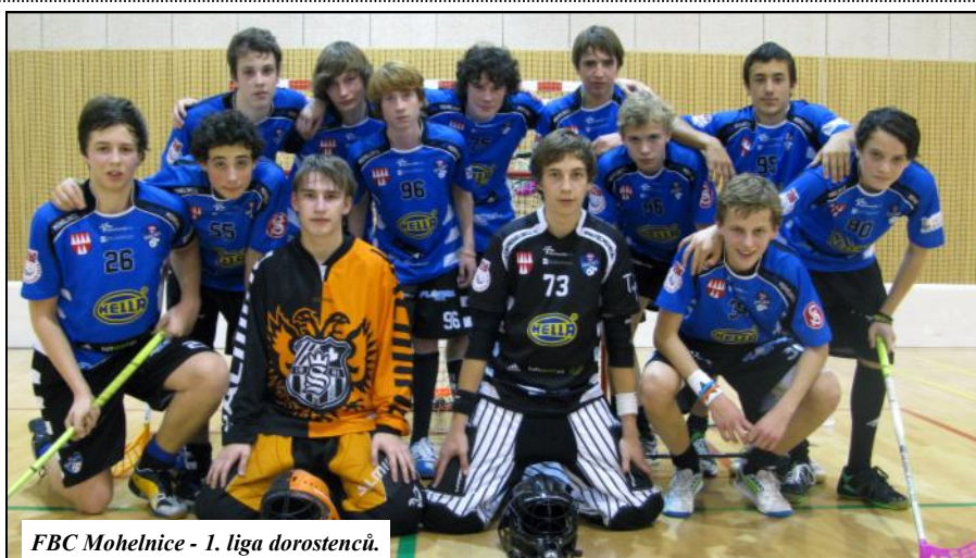
FBC Mohelnice - 1. liga dorostenců.

Sezóna zahájila se už koncem září a mohelnická družstva právě dohrávají podzimní části soutěží. Mohelnický florbalový klub vyslal do bojů 10 týmů. Je vidět správná práce s mládeží, jelikož mládežnická družstva FBC Mohelnice obsazují přední příčky na svých turnajích. Starší žáci se ve své olomoucké lize drží ve střední části tabulky. Chloubou mohelnického oddílu jsou týmy dorostenců a juniorů, kteří hrají celostátní soutěže. Dorostenci sbírají cenné zkušenosti v nejvyšší možné lize pro tuto kategorii v ČR s názvem 1. liga dorostenců - divize IV, nutno podotknout, že jsou v této lize poprvé a potřebují se herně „otřkat“. Mohelníci borci jsou však více než dobrými soupeři nejlepším týmům Moravy. Junioři válčí již druhou sezónu v 2. lize juniorů - divize IV a i pro ně je čest hrát celostátní soutěž se špičkovými kluby na vynikající úrovni. Mužské „béčko“ je naopak spokojeno se svými výsledky a drží se v olomouckém