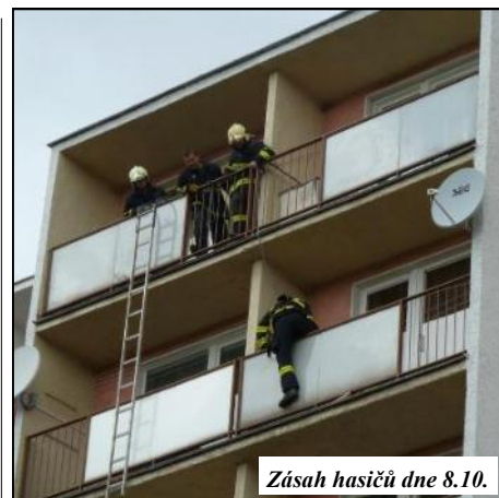
Zásah hasičů dne 8.10.

10. 10. zásah u dopravní nehody tří osobních aut na křižovatce u obce Palonín. Na místě