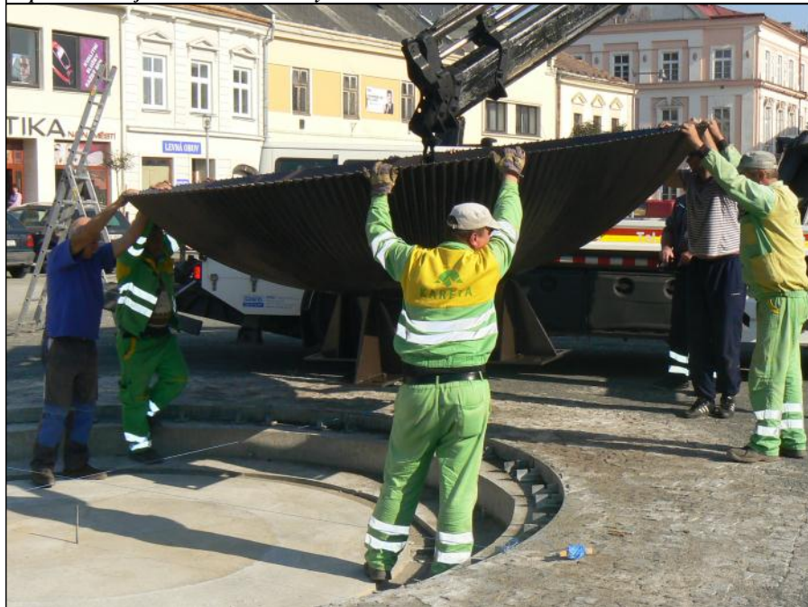
V pondělí 22. října na náměstí Svobody usadili novou kašnu.

POHÁDKY O MAŠINKÁCH DIVADLO TRAMTARIE 11. 11. v 15 hod. DK