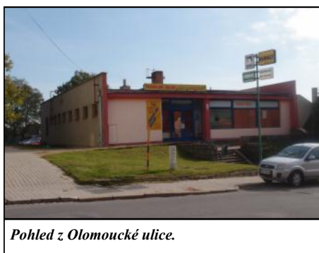
Pohled z Olomoucké ulice.