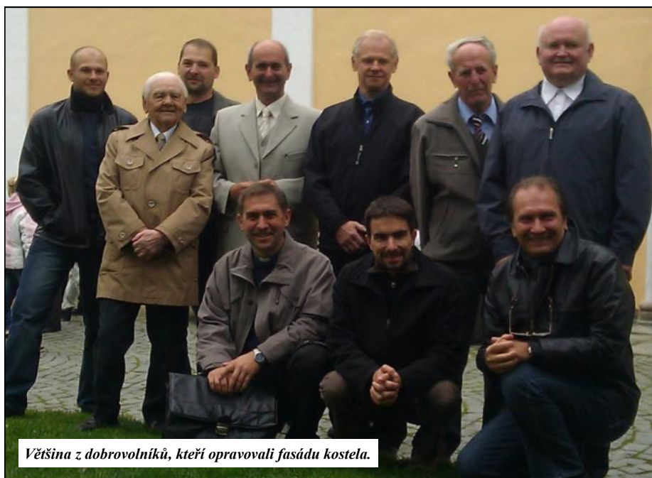
Většina z dobrovolníků, kteří opravovali fasádu kostela.