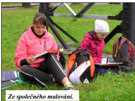
Ze společného malování.

Jak jsme Vás informovali v zářijovém čísle, partnerství mezi městy Mohelnice a Radlín pokračuje v podobě projektu „Dělí nás hranice, ale pojí tradice“.