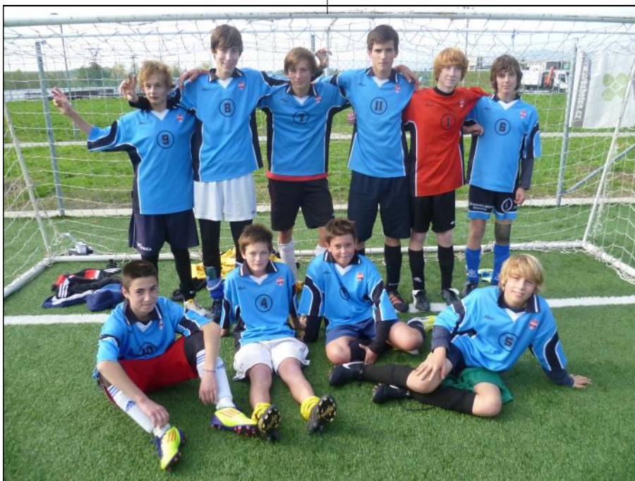
Borci z Mlýnské.