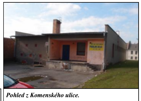
Pohled z Komenského ulice.

dojednat s majitelem objektu, zda přistoupí na navržený splátkový kalendář, protože původní dohoda počítala se splátkami do konce roku 2014, avšak to bylo rozhodnutím zastupitelstva změněno. V tomto ohledu je třeba podotknout, že současný vlastník koupil zmiňovaný objekt za 4.940.000 Kč. K tomuto propojení se již kladně vyjádřil i Dopravní inspektorát policie ČR, který souhlasí s navrženým řešením za předpokladu doplnění dopravního značení a vybudování zvýšeného příčného prahu pro přecházení. Tyto obě podmínky lze dodržet. Výhodou tohoto řešení je také možný vznik nových parkovacích ploch v blízkosti centra města a možnost vybudování autobusové zastávky