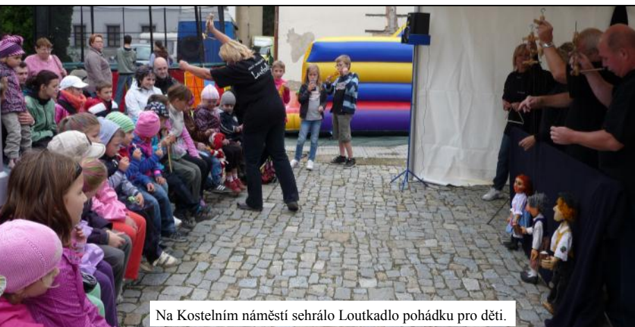
Na Kostelním náměstí sehrálo Loutkadlo pohádku pro děti.