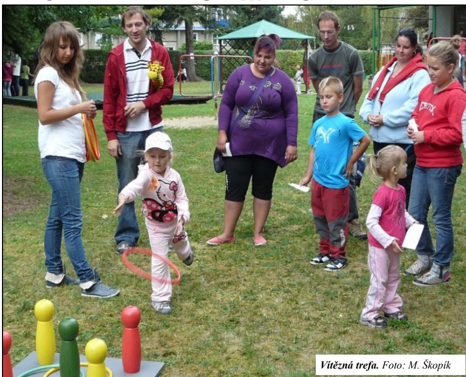
Vítězná trefa.