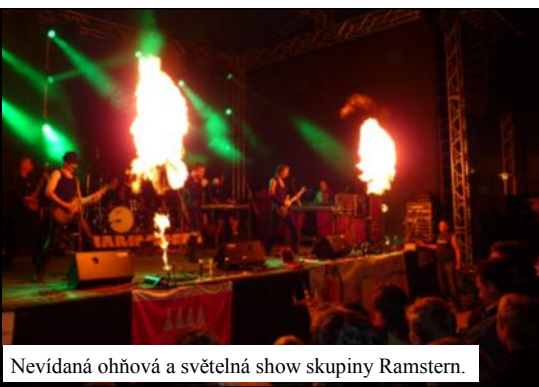
Nevidaná ohňová a světelná show skupiny Ramstern.

S politováním Vám musíme oznámit, že se mezi námi najdou občané, kteří nemyslí na zájmy města a jeho občanů, což některé z Vás zřejmě nepřekvapí. Ti, které máme na mysli, jsou dokonce schopni zajít tak daleko, že zájmy velké části občanů účelově poškozují. V souvislosti s konáním Dnů evropského dědictví si totiž někdo dal práci a rozeslal anonym, kterým se pokusil celou akci zastavit či dokonce zhatit úplně. Ačkoli nikdo nepodal na žádný z odborů Městského úřadu nebo na Město Mohelnice podnět k prošetření či stížnost na konání oslav Dnů evropského dědictví, tak v pátek 14. září 2012 dopoledne, tedy těsně před konáním akce, obdržely některé odbory Krajského úřadu v Olomouci, vyšší složky Policie ČR a manažeři účinkujících anonymní e-mail. Ten obsahoval varování před konáním akce na nedokončeném náměstí s tím, že se prý celá mohelnická veřejnost diví pořádku akce. Úředníci jsou prý bezmocní (akci nepořádal Městský úřad, ale MKC - pozn. red.), pokračuje anonym a dostali pořádku příkazem. Údajně město přistupovalo neodpovědně k celé výstavbě a postupuje tak stále, uvedl závěrem pisatel, který tento email odeslal z adresy „fanda89@email.cz“ a je podepsán jako „Stavební inženýři z Mohelnicka“. Tolik jen pro Vaši informaci, názor necháme na Vás. red.