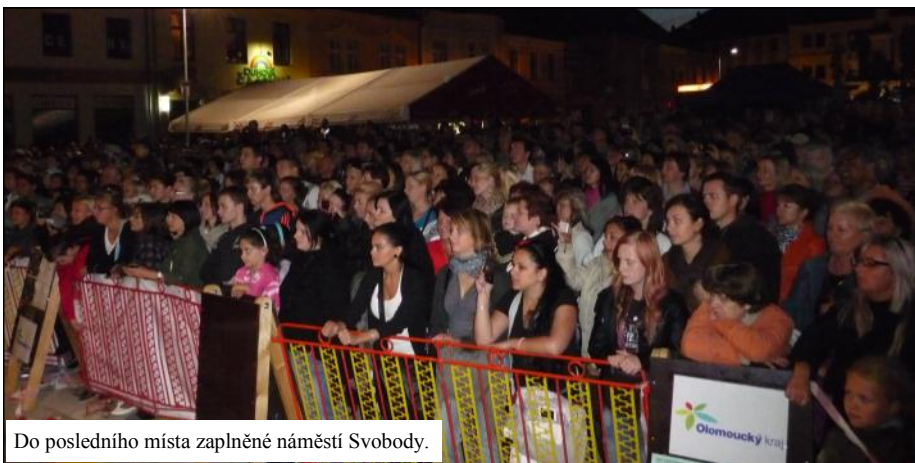
Do posledního místa zaplněné náměstí Svobody.