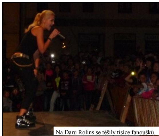
Na Daru Rolins se těšily tisíce fanoušků.