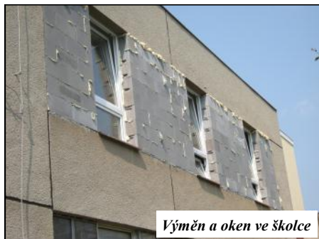
Výměna oken ve škole

V srpnu letošního roku proběhla v rámci částečné realizace projektu „Udržitelné využívání zdrojů energie na MŠ Na Zámečku“