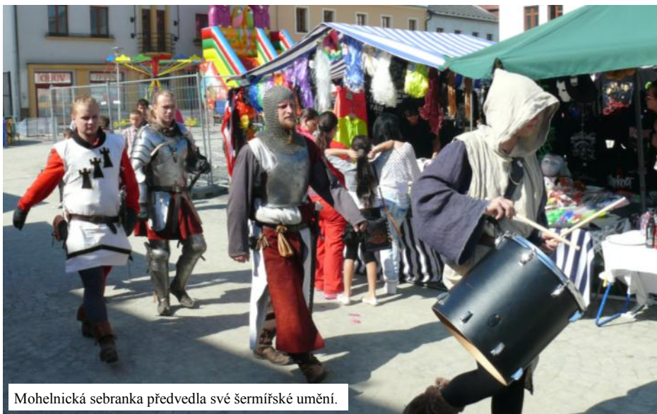
Mohelnická sebranka předvedla své šermířské umění.