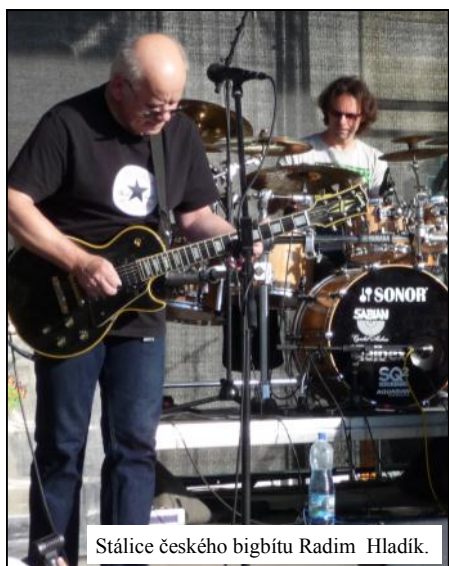
Stálíce českého bigbítu Radim Hladík.