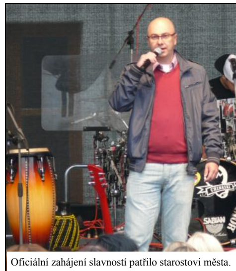
Oficiální zahájení slavností patřilo starostovi města.