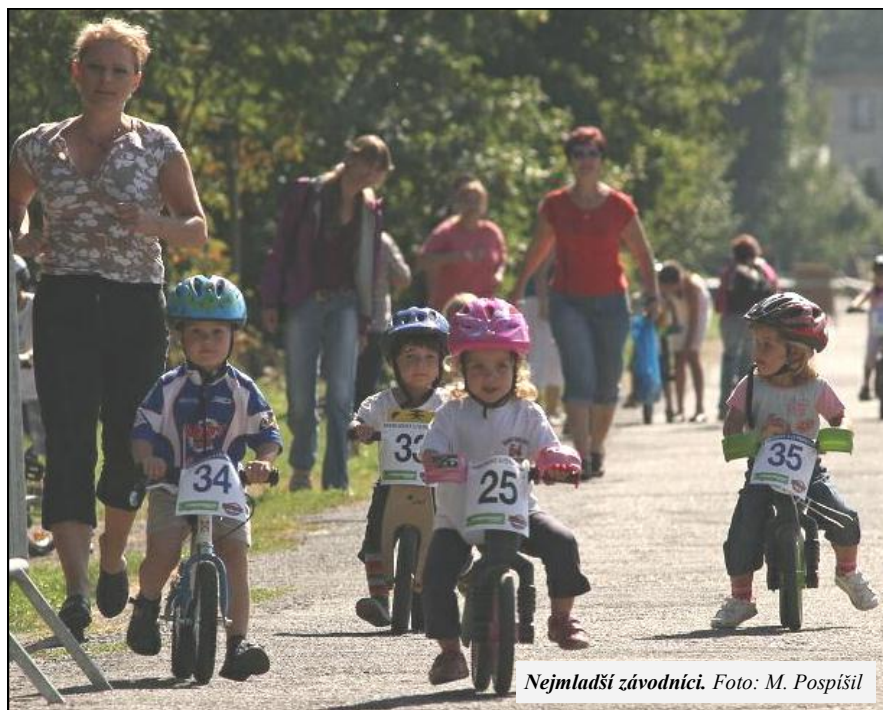
Nejmłodší závodníci.