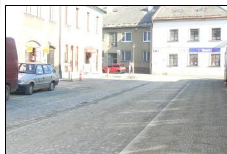
ul. S. K. Neumanna

Jak je již vidět na opravených ulicích Olooucká, S. K. Neumanna, Třebovská a nakonec na samotném náměstí Svobody, bude se měnit pohyb lidí po městě. Konkrétně jde o zužování vozovek v centru, stavění zvýšených příčných prahů a zavádění zón s rychlostí 30 km. Výsledkem by mělo být zpomalení aut, jež vytvoří prostor pro chodce a cyklisty, kteří se v ulicích přestanou bát. Sebevědomí chodců v památkové zóně (vnitřní město) se posílí odstraněním vyvýšených chodníků, čímž se chodci přestanou zahánět ke straně a staví se tak na roveň aut.