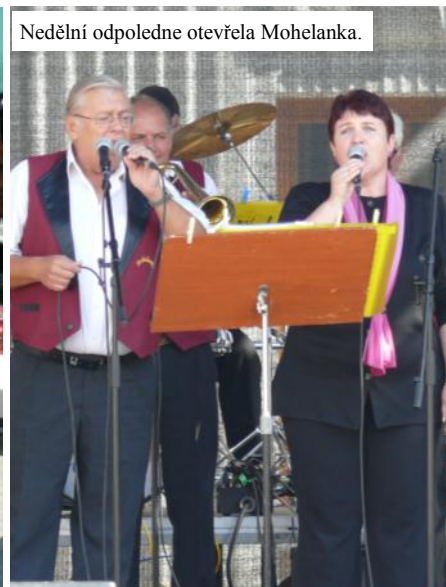
Nedělní odpoledne otevřela Mohelanka.