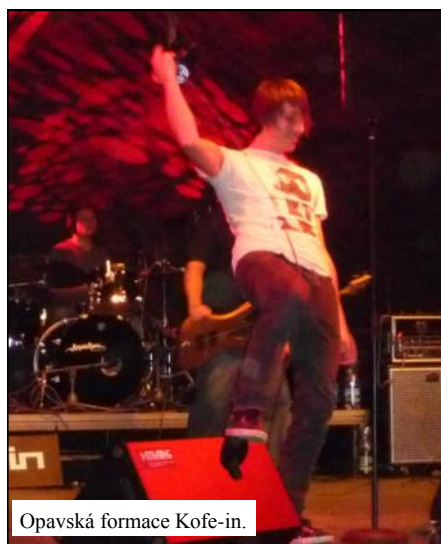
Opavská formace Kofe-in.