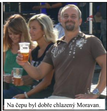
Na čepu byl dobře chlazený Moravan.