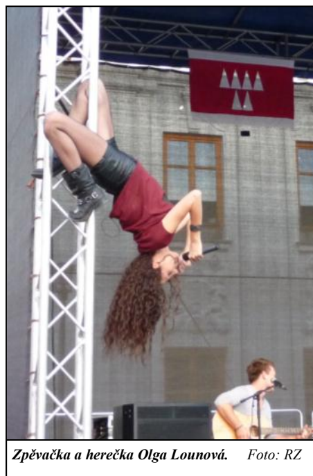
Zpěvačka a herečka Olga Lounová.