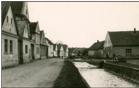
Vodní ulice počátkem 60. let 20. století

rit posledně jmenované předměstské části byl dán tokem říčky Mírovky, rozdělující podélně Vodní ulici, a mlýnského náhonu, který procházel ulicemi Mlýnskou a Na Příkopech. Tvář starého města byla silně poznamenána rozsáhlým požárem v roce 1841, kdy byla velká část původní městské zástavby zničena či poškozena. Od konce 18. století bylo postupně bouráno opevnění vnitřního města, včetně tří z původních čtyř městských bran. Jediná z nich – východní – se vedle zachovaných částí opevnění stala trvalým dokladem bohaté historie města (zároveň častým objektem zájmu fotografů). Počínaje závěrem 19. století byla zástavba města obohacena několika monumentálními