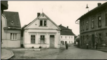
Zábřežská ulice, konec 50. let 20. stol.

Ke klenotům sbírkového fondu mohelnického muzea náleží poměrně rozsáhlá sbírka fotografií a pohlednic. Staré fotografie a