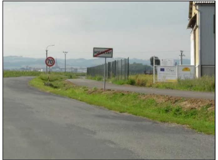
... a v Moravičanech

města Mohelnice bylo jasné řečeno, že Mohelnice je ochotna zaplatit svůj podíl na cyklostezce, avšak pouze ve výši, který se předpokládal v rámci schvalování smlouvy o partnerství a spolupráci mezi oběma obcemi na této cyklostezce v únoru 2011. Ten se pohyboval kolem částky 1,3 milionu Kč, který odpovídal asi jedné třetině nákladů vyplacených z rozpočtů zúčastněných obcí. Další dvě třetiny vyplacené z rozpočtu obcí měly hradit Moravičany. Zbytek, do předpokládané celkové ceny cyklostezky ve výši zhruba 10 milionů Kč, měla krýt přibližně 6 milionová dotace z ROP Střední Morava, o kterou následně Moravičany zažádaly. Mezitím podaly Moravičany žádost o další, tentokrát krajskou dotaci ve výši jednoho milionu.