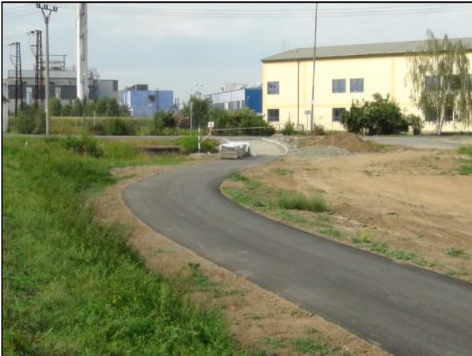
Ústí cyklostezky v Mohelnici...

měl být tento dodatek schválen na Zastupitelstvu obce Moravičany 7.8.2012 a následně na Zastupitelstvu města Mohelnice konaného 9.8.2012. Moravičany však dodatek na zmíněném zastupitelstvu neschválily. Mohelnické zastupitelstvo jej i přesto schválilo. Podle posledních informací starosty Pospíšila