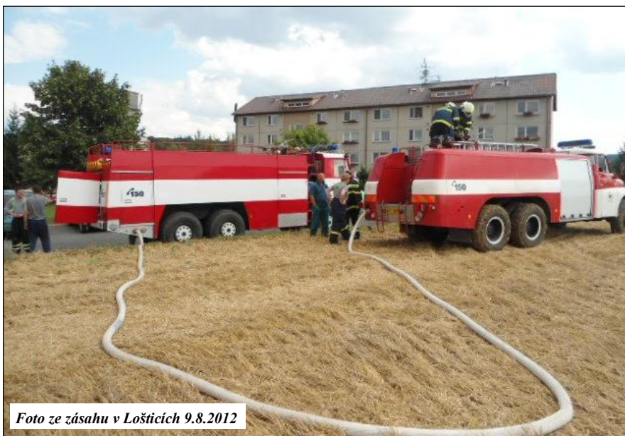
Foto ze zásahu v Lošticích 9.8.2012