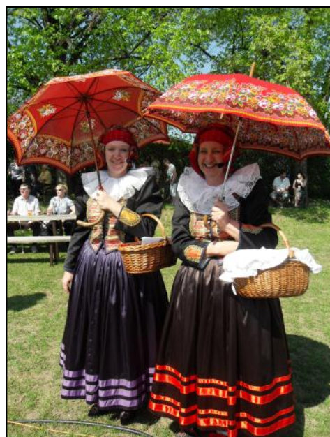
Dvě rozkošné dámy z FS Haná Přerov.