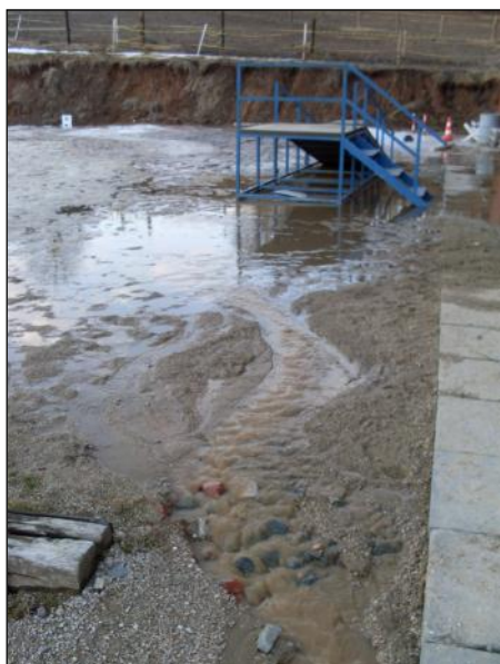
Nástupní rampa umožňuje klientům snadnější a hlavně bezpečné nasedání a sesedání z koně.

OS Ryzáček je nezisková organizace pomáhající lidem, kteří se ocitají ve velmi obtížných životních situacích, zdravotně postiže-