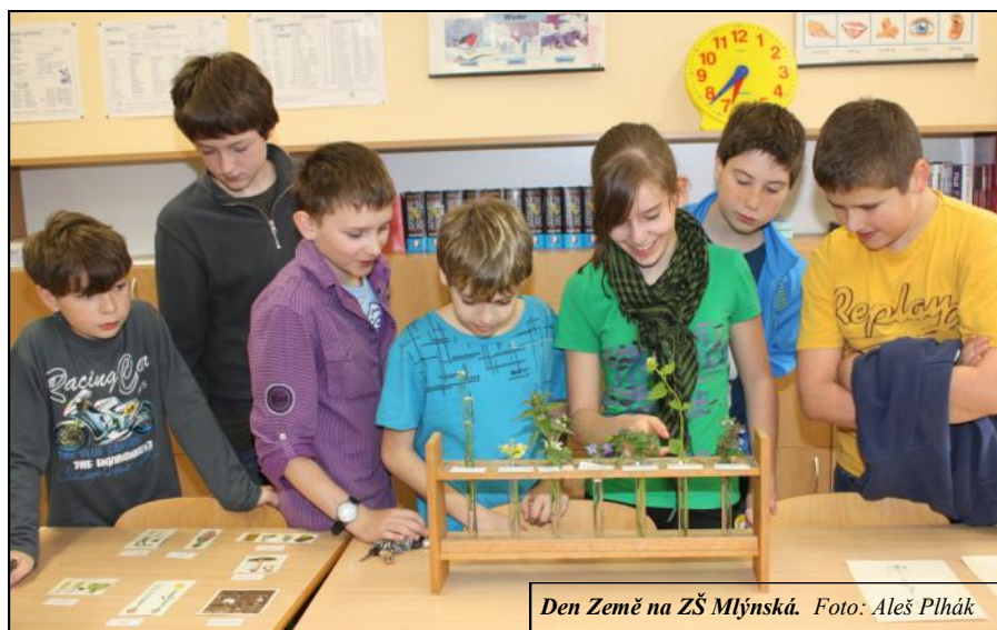
Den Země na ZŠ Mlýnská.

V úterý 24. dubna se na obou budovách naší školy uskutečnila tradiční oslava Dne Země. Letošní oslava byla zaměřena na prohloube-