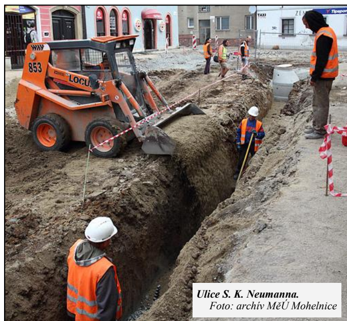
Ulice S. K. Neumanna.

Zajímavým zjištěním je doklad osídlení středu města již v mladší až