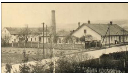
Vchod do Müllerovy autodilny, pozdější STS.

bylo v letech 1921 - 1939 budováno místním německým stavebním a bytovým družstvem 21 rodinných domků se 24 byty a činžovní dům. Mimo tuto výstavbu bylo prodáno 40 stavebních míst členům družstva, kteří stavěli soukromě. Zastavená plocha má výměru 8 ha a 87 arů. Na protější straně ulice se v té