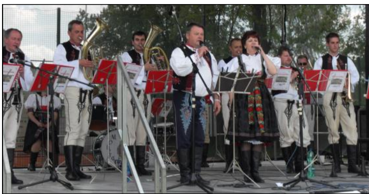
Vlčovanka Trenčín sklídila take obrovský aplaus.