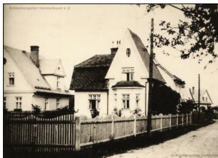
Domek v lokalitě dnešního Havlíčkova náměstí.

Za starým „černým křížem“, na poli po pravé straně silnice na Moravskou Třebovou,