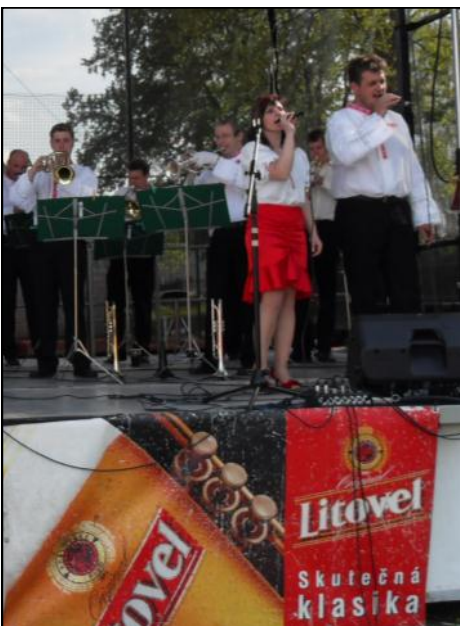
Děkujeme sponzorům Pivovar Litovel a Město Mohelnice.