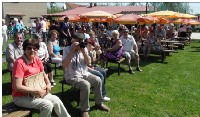
Počasi přálo, a tak nic nebránilo se zaposlouchat do pěkné hudby.