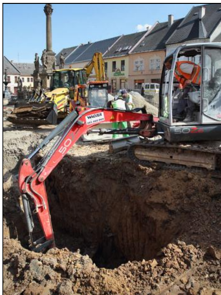
Práce na revitalizaci historického náměstí jsou v plném proudu.