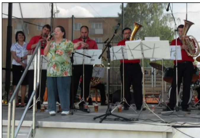
Jedna z návštěvnic festivalu si s chutí zazpívala s Moravskými muzikanty.