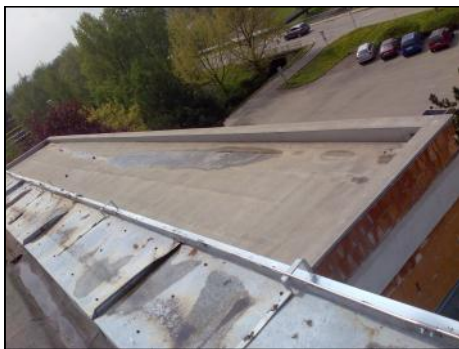
Špatně vyspádovaná střecha bazénu.

Vzduchotechnika – navržená vzduchotechnika nezahrnovala odvětrání a odvlhčení centrálních sprch, šatny, společné prostory a saunu. Nápravné řešení – místo dvou vzduchotechnických jednotek jsou navrženy čtyři, které zajistí potřebnou výměnu vzduchu a zabrání další devastaci stavebních konstrukcí. Cena nové dokumentace byla 75 000 Kč a zhotovitelem bude firma Zmrzlik ze Šternberka s cenou díla cca 4,9 mil. Kč.