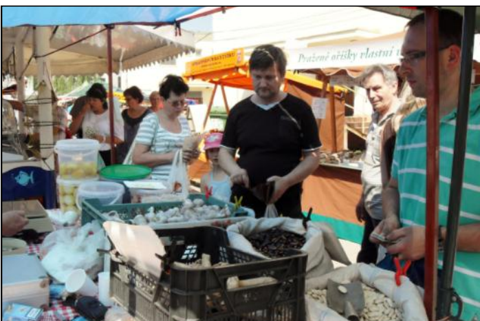
Na trzích se už před oficiálním začátkem prodávalo.