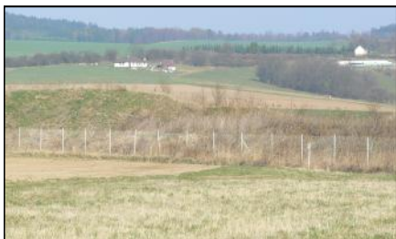
Skládka v Líšnici.