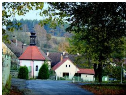
Mohelnice u Nepomuku.

Celkem pět sesterských stejnojmenných sídlišť má naše město. Jsou to: město Mo-