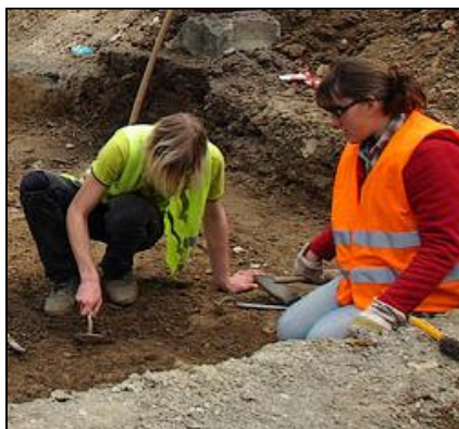
Archeologové našli mj. minci z doby Marie Terezie.

cháží u jednotlivých nemovitostí k zaústění dešťových svodů a k výstavbě ramene dešťové kanalizace, která nově vznikne na náměstí Svobody a v ulici S. K. Neumanna, kde bude dočasně napojena na stávající jednotnou kanalizaci v ulici Třebovská. V prostorách ulic S. K. Neumanna, Třebovská a Olomoucká jsme vyzvali občany k výměně – případně rekonstrukci jednotlivých přípojek inženýrských sítí v havarijním stavu, proto v těchto ulicích vznikají Dokončení na straně 9.