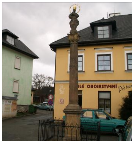
Mariánský sloup na Zábřežské ulici.

Tentokrát se budeme zabývat sloupy se sochou Panny Marie, které byly od raného baroka až do 1. poloviny 20. století velmi oblíbeny. Na území Městské památkové zóny Mohelnice se nachází barokní sloup se