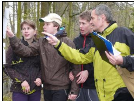
Na ekologickém stanovišti.

V letošním roce probíhá v celé České republice již 40. ročník soutěže v přírodovědně - ekologických disciplínách s názvem ZELENÁ STEZKA - ZLATÝ LIST. Zúčastněné