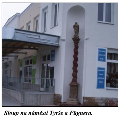
Sloup na náměstí Tyrše a Fügnera.

Hranolový podstavec s diamantovým řezem na bočních stěnách nese na přední straně latinský nápis: „K větší slávě Boží trikrát nejlépe a nejvíce a Jeho bez poskvrny počaté Matce Nejsvětější Panně k ozdobě a po-