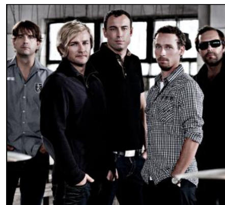
Support Lesbiens zahrají v Mohelnici.