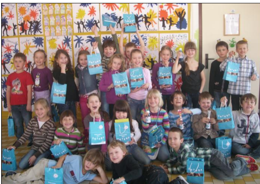
Prvňáčci se určitě budou o svoje zoubky starat pečlivě.