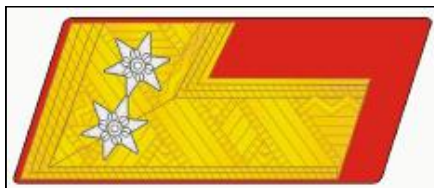
Hodnostní označení polního maršál-poručíka, na límci uniformy.

V celé dosavadní historii města Mohelnice dosáhl zřejmě nejvyšší vojenské hodnosti zdejší rodák Josef Fiedler , který se narodil 17. března 1789. Jeho otec se oženil s Češkou Annou Jírkovou a v Mohelnici působil jako člen rady města a městský lékař. Mladší syn Josef se roku 1806 stal kadetem u pluku č. 19, jako praporčík prodělal protinapoleonské tažení v roce 1809 a jako nadporučík absolvoval válečné osvobozovací akce v letech 1812, 1813 a 1814. Roku 1815 padl do zajetí u Ospedalu a po svém osvobození se jako hejtman účastnil tažení proti italskému Piemontu a poté následovala jeho strmá vojenská kariéra. Roku 1833 byl povýšen na majora, za tři roky nato byl nobilitován do šlechtického stavu, roku 1841 se stal plukovníkem a v roce 1848 generálem. Jako brigádní velitel obklíčil po propuknutí revoluce v Haliči město Lemberg a v letech 1848 a 1849 se zúčastnil tažení Schlickova armádního sboru proti povstání v Uhrách. Za statečnost a věrnost vlasti a císaři byl jmenován polním maršálem-poručíkem (Feldmarschlleutnant) a r. 1853 se stal držitelem pluku č. 3.