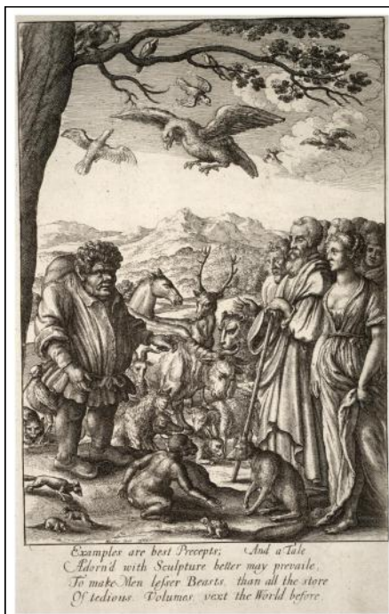
Václav Hollar - Ezopovy bajky, titulní list, lept, 1665.

Od pátku 3. února do soboty 10. března 2012 hostí mohelnické muzeum výstavu s názvem Václav Hollar (Praha 1607 - Londýn 1677). Výběr z díla ze sbírek Vlastivědného muzea v Šumperku. Výstava prezentuje grafické listy slavného českého rodáka, kreslíře, rytce a grafika, Václava Hollara, umělce, jehož životní osudy a umělecká tvorba jsou spjatá zejména se zahraničím, a