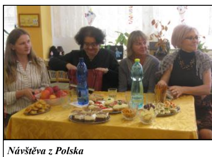
Návštěva z Polska

Již v roce 2010 začala družba mezi polským