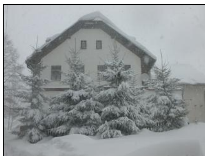
Zasněžená romantika v Moravském Karlově.

gu se žáci z Mlýnské seznamují i s běžkami.