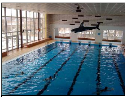
Krytý bazén v Mohelnici

Při mé návštěvě sportovní komise, která pracuje jako poradní orgán rady města, jsme o plánovaných opravách krytého bazénu rozsáhle diskutovali. Padl i nápad, že by bylo dobré v rámci služeb pro veřejnost