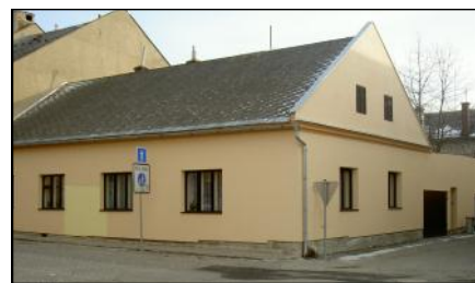
Pekařský dům u bývalé Loštické brány.

13 skrývá přestavěný pekařský domek. Na západní straně města byla Horní brána, zvaná Třebovská, na ulici směrem na Moravskou Třebovou. Mezi domy č. 13 a č. 15 je na obdobném sloupu jako ve Smetanově ulici biskupský znak z roku 1714. Šest stříbrných jehlanů v červeném poli představuje bývalá ochranná města olomouckého biskupství: Osoblahu ve Slezsku věnoval biskupství vévoda Otta II. z Olomouce jako přínos k rozestavěnému chrámu sv. Václava (dnešní dóm) už na začátku 12. století, Mohelnice, Vyškov a Kroměříž byla poprvé jmenována roku 1131, Kelč a Místek roku 1260. Císař Rudolf II. dal městu Mohelnice 10. srpna 1588, kdy byl pražským arcibiskupem mo-