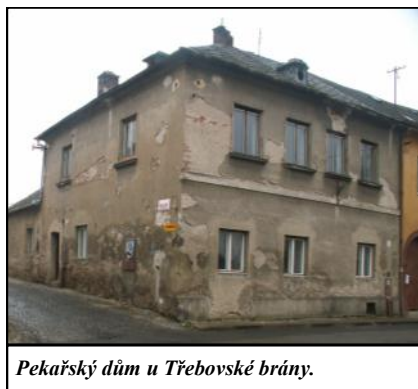
Pekařský dům u Třebovské brány.

13 skrývá přestavěný pekařský domek. Na západní straně města byla Horní brána, zvaná Třebovská, na ulici směrem na Moravskou Třebovou. Mezi domy č. 13 a č. 15 je na obdobném sloupu jako ve Smetanově ulici biskupský znak z roku 1714. Šest stříbrných jehlanů v červeném poli představuje bývalá ochranná města olomouckého biskupství: Osoblahu ve Slezsku věnoval biskupství vévoda Otta II. z Olomouce jako přínos k rozestavěnému chrámu sv. Václava (dnešní dóm) už na začátku 12. století, Mohelnice, Vyškov a Kroměříž byla poprvé jmenována roku 1131, Kelč a Místek roku 1260. Císař Rudolf II. dal městu Mohelnice 10. srpna 1588, kdy byl pražským arcibiskupem mo-