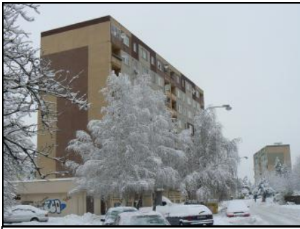
Ul. Stanislavova