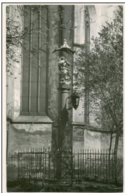
Historická fotografie sochy Panny Marie.

Nejstarší z nich je sloup se sochou Panny Marie z maletínského pískovce, jehož vznik je přesně datován dnem 6. srpna 1698. Na kvádru v diamantovém tvaru je sloup, na něm je asi v polovině výšky umístěn nápisový štítek, jehož horní okraj tvoří stylizovaná královská koruna. Detail sloupu s německým