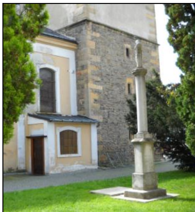
Sloup se sochou Panny Marie Neposkvrněné.

nápisem v českém překladu město Mohelnice vydalo jako malý kalendář pro rok 2012. Sloup má patku i hlavici toskánského typu. Prostovlasá postava Panny Marie se sepjatými rukama a hlavou obrácenou k nebi stojí