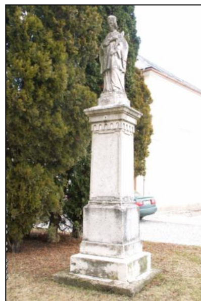
Socha sv. Jana Nepomuckého.

Kamenný kříž u hlavního vchodu s reliéfem