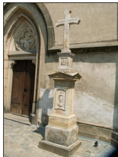
Kamenný kříž u hlavního vchodu kostela.

na zeměkouli. Výraz sochy vyjadřuje nábožné zanícení, přestože detaily jsou již působením času setřeny. Sochu chrání plechová