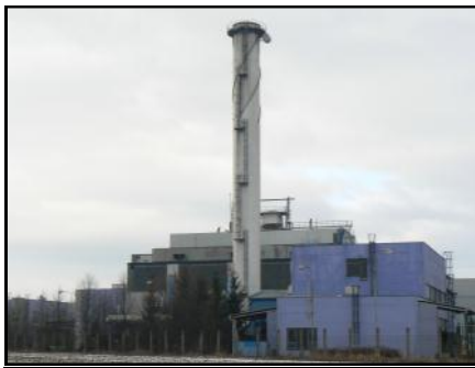
Mohelnická teplárna by mohla likvidovat odpad.