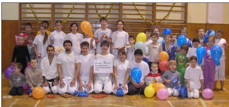
Závodníci po vyhlášení výsledků.