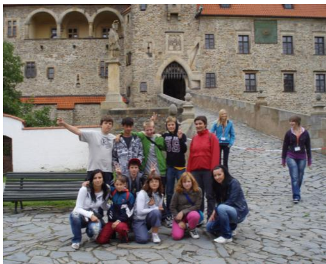
Výlet uživatelů NITKA Zábřeh a Mohelnice na hrad Bouzov.

Sdružení RES-SEF, o. s. je od roku 2008 novým prvkem v síti sociálních služeb v okresním měřítku a nabízí své služby terénního programu STREETWORK, nízkoprahového zařízení pro děti a mládež NZDM NITKA a podporovaného zaměstnávání INTEGRA v Šumperku, Zábřehu, Mohelnici a na Hanušovicích. Sdružení se připravuje k realizaci projektu INTEGRA-CE, který je zaměřen na mladé lidi do 25 let, jež z důvodu nízkého vzdělání mají problém nalézt stabilní práci. Projekt je podporován z Evropského sociálního fondu, konkrétně Operačního programu Lidské zdroje – zaměstnanost. V průběhu dvou let by mělo jeho motivační a praktickou částí projít 64 uživatelů rovnoměrně zastoupených z celého okresu. Výsledkem projektu je zaměstnání dvaceti uživatelů v režimu společensky účelného pracovního místa. Nezbytná je v tomto ohledu spolupráce s komerční sférou zejména pak s významnými podniky a firmami v okrese Šumperk. Projekt bude připraven k realizaci od 1. 10. 2011, kdy u tohoto programu končí podpora z Individuálního projektu Olomouckého kraje, který jej podporoval v předchozích dvou letech. Projekt je výzvou pro nezaměstnané, kteří budou osloveni v průběhu září na seminářích na všech pobočkách úřadu práce v okrese Šumperk. Obyvatelům spadajícím do cílové skupiny projektu z oblasti Hanušovic bude nabídnuto hrazené dojíždění do střediska v Šumperku a zpět. Realizace projektu je naplněním komunitních