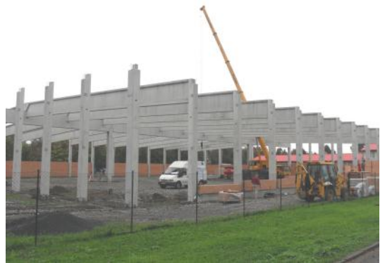
Na ul. Sadová rychle roste víceúčelová hala.

která je i stavebníkem haly. Stavba se skládá ze tří částí a to vlastní haly o rozměrech 50,50 m x 65,50 m, přístavby pro administrativu o rozměrech 7,00 m x 28,50 m a zázemí pro zaměstnance o rozměrech 12,00 m x 22,00 m. Vlastní hala bude soužit stavební společnosti pro doplňkový provoz jako jsou přípravné práce, skladování s možným využitím pro sportovní účely a motorsport.