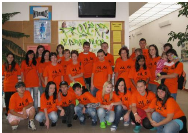
Žáci propagují nekuřáctví na Kralickém sněžníku i ve škole.