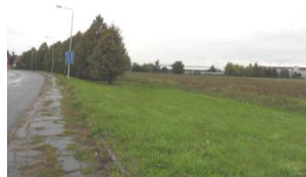
Pozemek, na němž by měl stát hypermarket.

Na křižovatce ulic Družstevní a I. Máje se plánuje vybudování dalšího hypermarketu, což jednak zlepší našim občanům nakupování a jednak zajistí další pracovní místa. Podle vedoucího odboru stavebního úřadu, rozvoje a investic Mgr. Jiřího Pokorného je na stavbu TESCO vydáno platné územní rozhodnutí, které se však změní na základě veřejnoprávní smlouvy, o jejíž odsouhlasení nyní TESCO požádalo. V současné době vyřizuje věc EDEN Development, a.s., který je smluvní stranou veřejnoprávní smlouvy. Samotná prodejna bude mít rozměry cca 76 x 44 m a výšky 6 m. Původní parkoviště mělo mít 170 parkovacích míst s tím, že v mezidobí