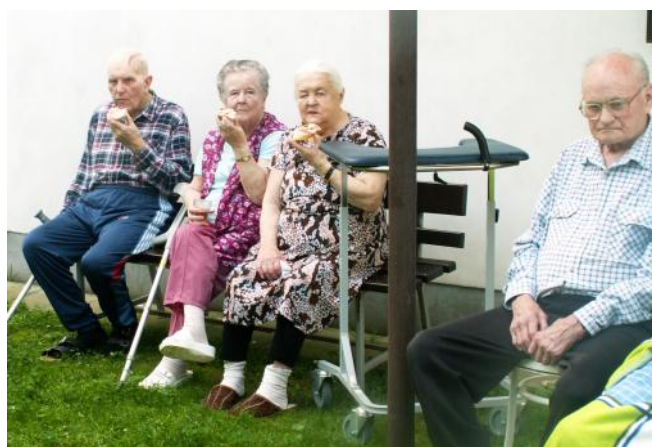
Klienti Domova pro seniory na Lidické ul. se skvěle bavili.

Za doprovodu své harmoniky zazpíval, a potěšil tak naše seniory