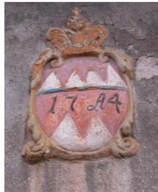
Znak na mohelnické západní bráně.