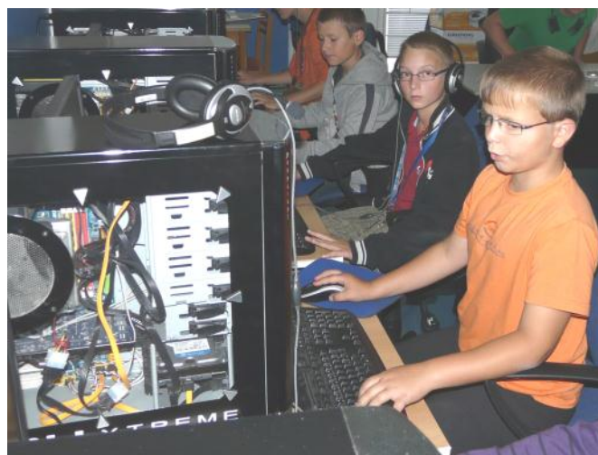
Počítače v plném vytižení..

Zábavné odpoledne, které prezentovalo činnost DDM Magnet Mohelnice, se vydařilo. Přineslo spoustu zábavy a všem přítomným napově-