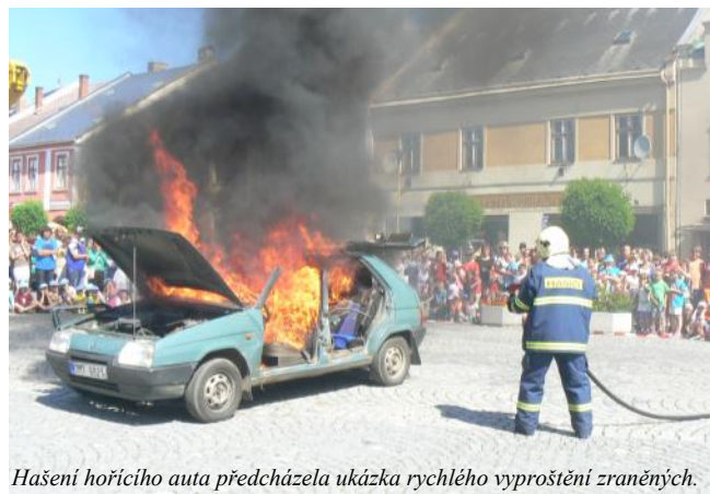
Hašení hořícího auta předcházela ukáзка rychlého vyproštění zraněných.