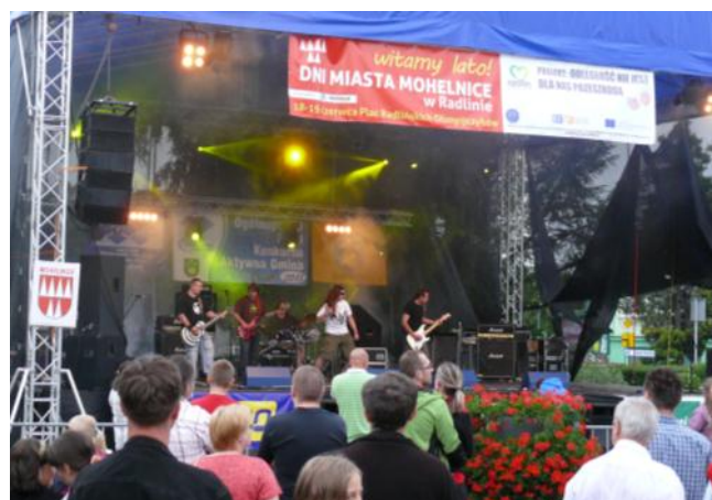
Mohelnici reprezentovala i kapela Herrgott