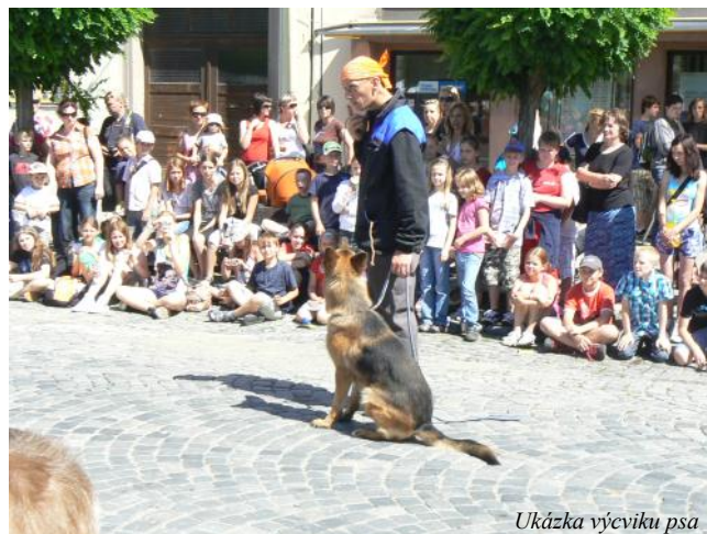
Ukázka výcviku psa