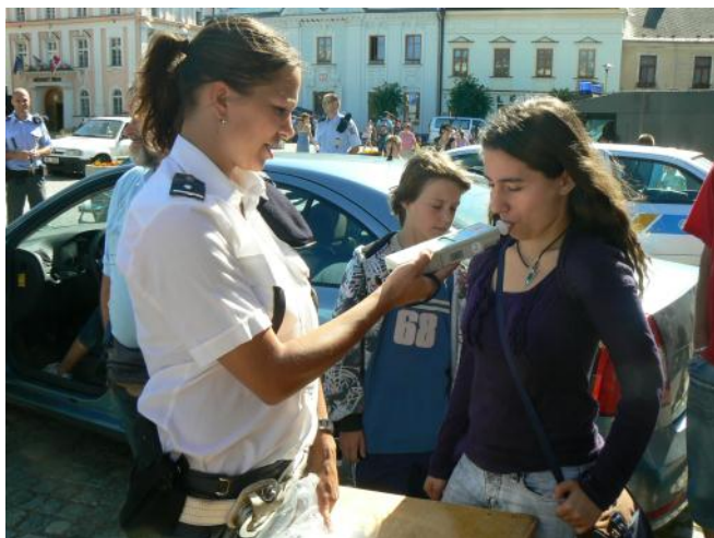
Stanoviště Dopravní policie. Dechová zkouška děti velmi lákala.

Zdá se to neuvěřitelné, ale akce, kterou jste mohli v úterý 28. června 2011 navštívit, se začala plánovat již na začátku tohoto roku. Aby se akce mohli zúčastnit všichni ti, kteří na ni skutečně přijeli, museli být s dostatečným předstihem osloveni. Byli prostřednictvím starosty města požádáni o účast a spolupráci. Všichni oslovení opravdu přijeli a pomohli k tomu, že akce proběhla bez komplikací a že splnila to, co