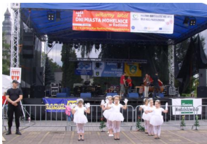
Vystoupení malých mohelnických tanečnic sklídilo obrovský aplaus.

Jednalo se o prezentaci našeho města, které se zúčastnilo téměř 100 dětí a dospělých, ať už v roli účinkujících, doprovodů, diváků či organizátorů. Svá vystoupení si pro polské