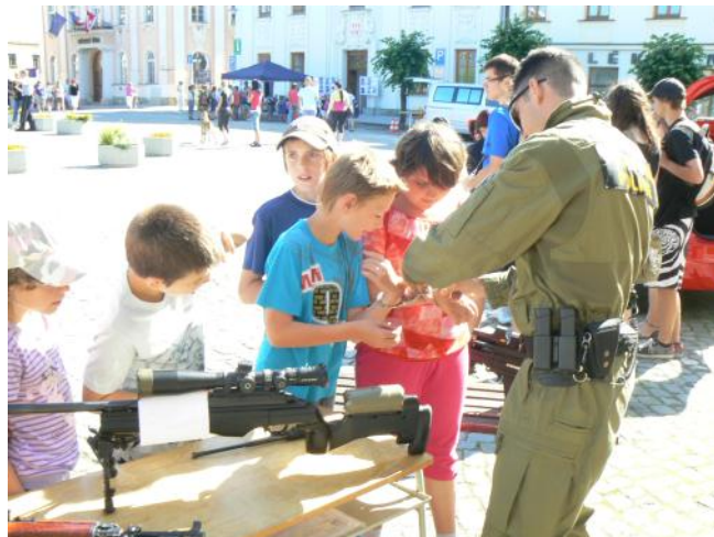
Vojenská policie byla v obležení převážně chlapců.

Očekávalo se, že si uvědomíme, že prázdniny nejsou jenom chvíle radosti a odpočinku. Je to období zvýšeného výskytu cyklistů, větší provoz na silnicích, odjezdy a příjezdy na dovolenou. Nesmíme však ani při prázdninách zapomínat na základní pravidla, abychom nezažili na vlastní kůži nějakou z dynamických ukázek úterního dopoledne. Snahou proto bylo oslovit takové složky, které mají co říci k problematice bezpečnosti – Autoškola J.P.S. Moravičany, Dopravní policie Šumperk, Vojenská policie Olomouc, Jednotka sboru dobrovolných hasičů města Mohelnice, Dopravní hřiště provozované mohelnickým domem dětí, Cykloškola Přerov a Bike Sport Mohelnice - obchod, kde si koupíte nejenom kola, ale i ochranné a bezpečnostní prvky. Svůj stánek měl i odbor dopravy městského úřadu. Něco na