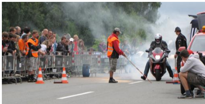
Loňský ročník Mohelnického Winklu.

Tímto jménem 1. Motoklubu Mohelnice srdečně zveme všechny závodníky i diváky na nevšední den plný zajímavých zážit-