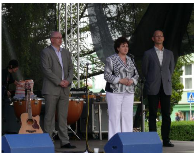
Radlinská starostka s mohelnickým starostou a místostarostou

V rámci projektu „Vzdálenost pro nás není překážkou“ spolufinancovaného z prostředků ERDF prostřednictvím Euroregionu Glacensis se ve dnech 18. – 19. 6. 2011 uskutečnila akce s názvem „Dny města Mohelnice v Radlinu“.