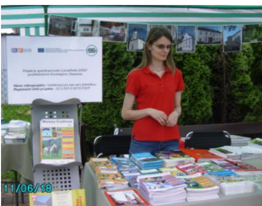
Informační stánek nabízel brožury a bulletiny.

V rámci projektu „Vzdálenost pro nás není překážkou“ spolufinancovaného z prostředků ERDF prostřednictvím Euroregionu Glacensis se ve dnech 18. – 19. 6. 2011 uskutečnila akce s názvem „Dny města Mohelnice v Radlinu“.