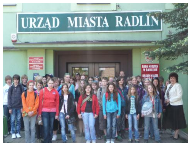
Mohelnické děti se starostkou Radlinu.

Barbora Chalupová, MěÚ Mohelnice, odbor školství a kultury