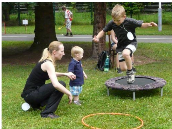
Snad se trefím...

Velmi pěkného úspěchu dosáhli žáci 5. a 6. ročníku ze ZŠ Mlýnská v Dopravní soutěži mladých cyklistů (DSMC). Po 2. místě v okrskovém kole a následném postupu do kola okresního si v něm vybojovali titul okresního přeborníka v této soutěži. Obě kola se jela v pěkném prostředí mohelnického dopravního hřiště. Díky tomuto umístění pak měli právo postupu do kola krajského, které letos pořádal okres Prostějov na svém dopravním hřišti a to v úterý 24. května. Ani zde se žáci z Mlýnské neztratili a bojovali na špičce umístění. Nakonec o pár restných bodů skončili na místě druhém a tudíž nepostupovém (republikové kolo se jede v červnu v Třeboni), ale v tak vyrovnané konkurenci nejlepších škol z 5 okresů Olomouckého kraje jde o