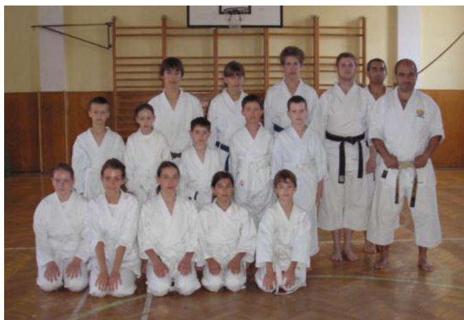
Zkoušky a seminář karate.