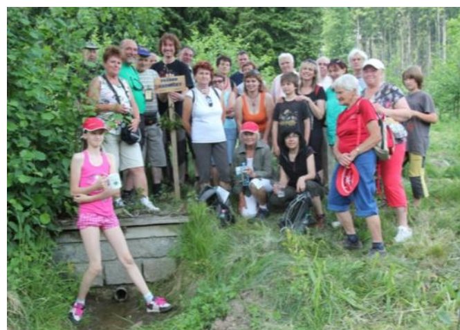
Mohelničtí a loštičtí turisté u pramene potoka Radničky 4. června.

Mohelničtí oddíl turistů naplánoval výlet k prameni říčky Mírovky v sobotu 21. května. Většina účastníků se vydala do oblasti maletínských lomů na kolech. A jelikož je pramenů několik, hledali jsme