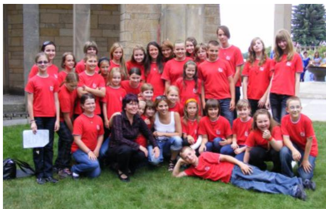
Arietta s Anetou Langerovou v civilu.