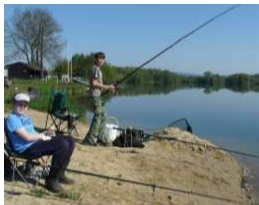
U vody bylo úžasné.

Pro členy zájmového kroužku „Rybář“ a jejich kamarády rybáře připravili