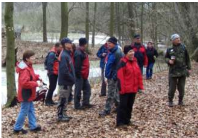
Kolem chatek u Bočkových děr je ještě souvislá vrstva ledu zalitá vodou.

Zvláště po letošní nepříjemné zimě. Ovšem každý jej přivítá dle svého. Mohelnícti turisté společně s turisty z Loštic vyrazili na první jarní výšlap do přírody jako každý rok. Tentokrát z Bílé Lhoty přes