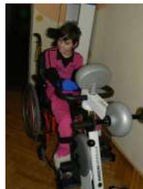
Žákyně školy předvádí nový přístroj.