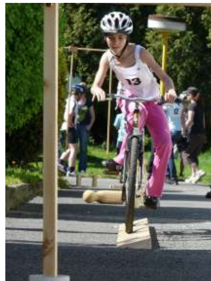
Obávaná jízda zručnosti.

S nástrahami soutěže se všichni závodníci s menším či větším úspěchem vypořádali. Po tříhodinovém klání a chvíle napětí při vyhodnocování stanovil počítač tyto výsledky. V mladší kategorii si vítězství a postup do krajského kola vybojovalo družstvo ze ZŠ