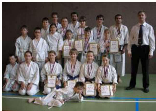
Všichni zúčastnění.