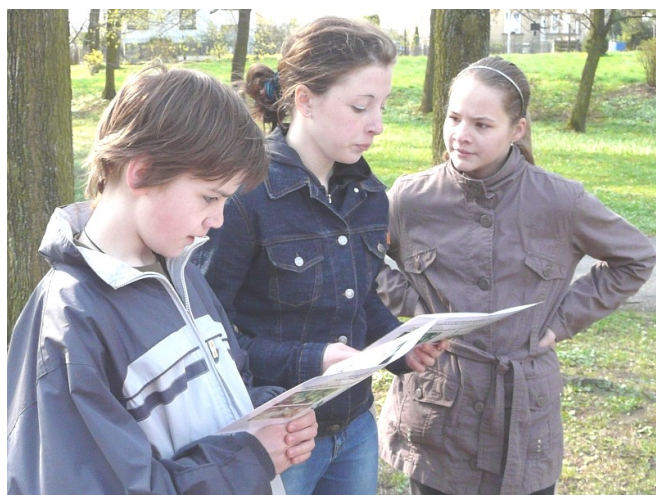
Na stanovištích se urputně přemýšlelo.

Místní kolo Zelené stezky se uskutečnilo v pátek 15. dubna 2011 v městských sadech pod patronací Domu dětí a mládeže Magnet Mohelnice. Každý kolektiv byl reprezentován tříčlennými hlídkami ve dvou kategoriích - mladší žáci do 6. třídy a starší žáci ze 7. - 9. třídy. První místo v kategorii mladších žáků vybojovalo družstvo ze ZŠ Vodní Mohelnice, druhé místo družstvo ze ZŠ Mlýnská Mohelnice.