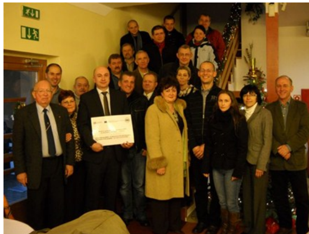
Setkání představitelů města s českými a polskými trenéry (prosinec 2010).