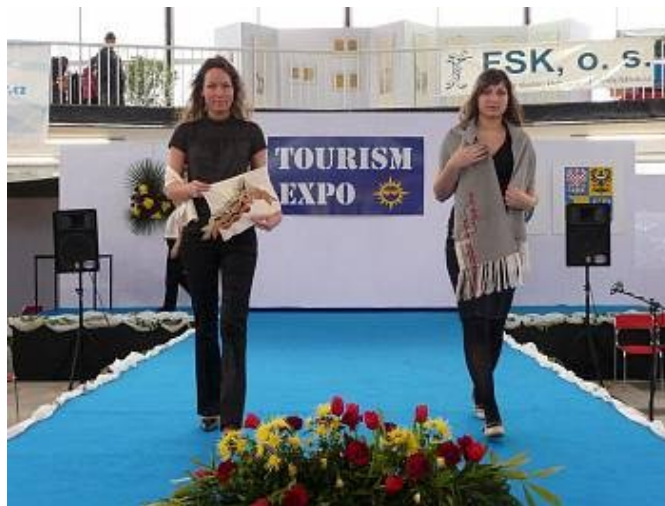
Renáta a Alena Drozdov na přehlídkovém molu předvádějí šály

Martina Wolfová, MěÚ Mohelnice, vedoucí odboru školství a kultury