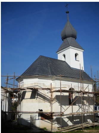
Oprava kaple v Květíně