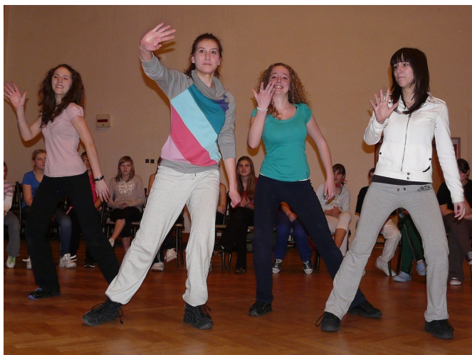
Večerní show.