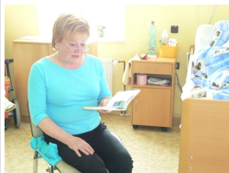
Knihovnice předčítá imobilním klientům

Dobrovolník bude pomáhat při jednorázových akcích a při pravidelných aktivitách.