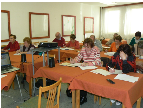
Studenti VU3V v minulém semestru