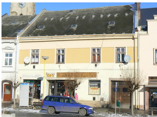
Alena Fialová, MěÚ, Odbor správy majetku a rozvoje města,

Záměr města odprodat majetek obce je zveřejněn na úřední desce a webových stránkách města od 23.12.2010 do 7.2.2011 do 17.00 hodin. Bližší informace poskytnete odbor správy majetku a rozvoje města tel. č. 583 452 118.