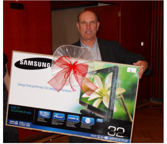
První dvě ceny - zahraniční zájezd a LCD televizor