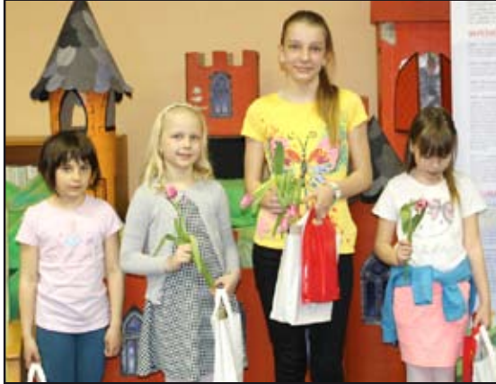
Výherci soutěže Vyhledáváme nové čtenáře.

V rámci projektu „Zpracování Místního akčního plánu rozvoje vzdělávání na území ORP (Obec s rozšířenou působností) Mohelnice“ reg. č.: CZ.02.3.68/0.0/0.0/15_005/0000409