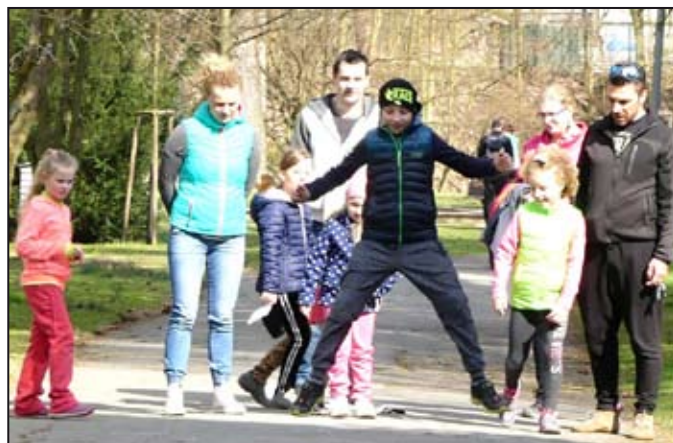
Při skákání „zajíčka“.