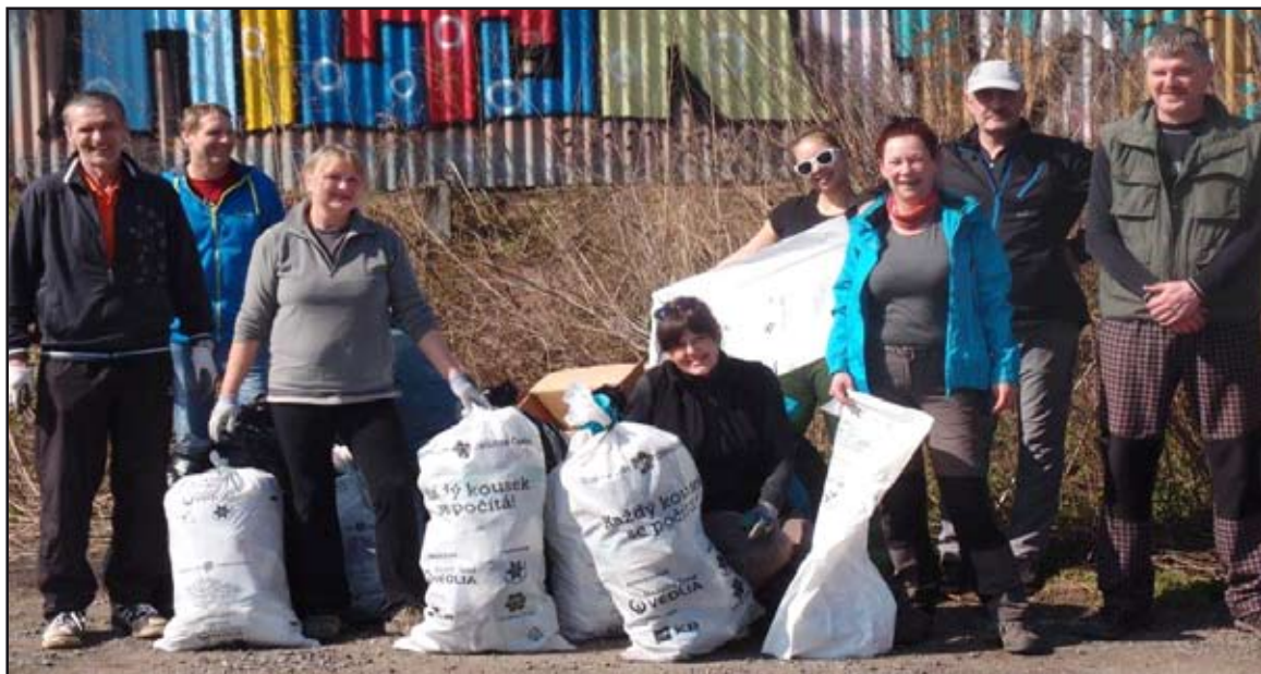
Dobrovolníci uklízeli po nezodpovědných.

lek STURM, společně s mohelnickými skauty. Tato parta 64 dobrovolníků měla sraz u Kovárny a rozjela se uklízet povodí Moravy, okolí Nových Mlýnů a Nových Zámků. I oni se při sběru odpadků hodně zapotili, jelikož sesbírali více než 3 tuny.