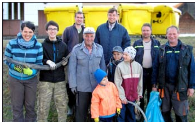
Dobrovolníci ze Studené Loučky.

Obyvatelé Studené Loučky a Bukové se v letošním roce poprvé zapojili do akce Uklidme Česko. Je potěšující, že se přišli nejen dospělí, ale i děti. Zejména kolem státní silnice měla necelá dvacítko dobrovolníků plné ruce práce. Tři pracovní skupiny sesbíraly několik vleců odpadů.