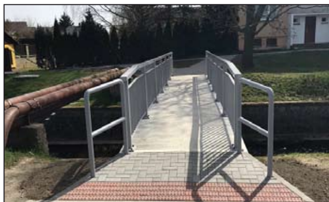
Nově opravená lávka přes Mírovku.