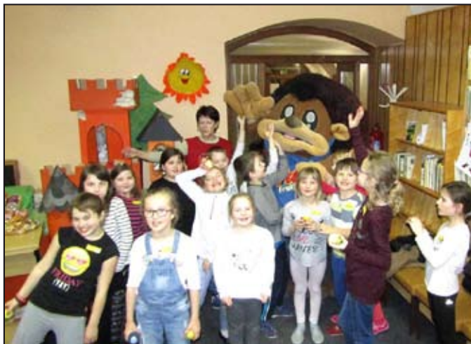
Noc s Andersenem v Mohelnici.

V pátek 23. března se v mohelnické knihovně, stejně jako na dalších 1700 místech, konal 18. ročník Noci s Andersenem. Dvacet mohelnických školáků a zároveň čtenářů knihovny se připojilo k dalším 97 000 dětí a dospělých po celém světě, aby si společně užili noc plnou dobrodružství, čtení a pohádek, pojmenované podle slavného dánského spisovatele.