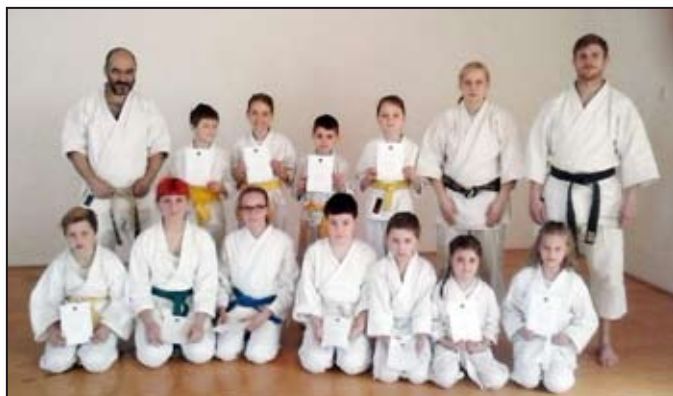
Děti po zkouškách i se svými instruktory.