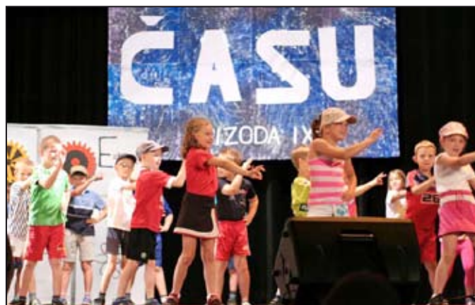
Foto z předchozí Akademie