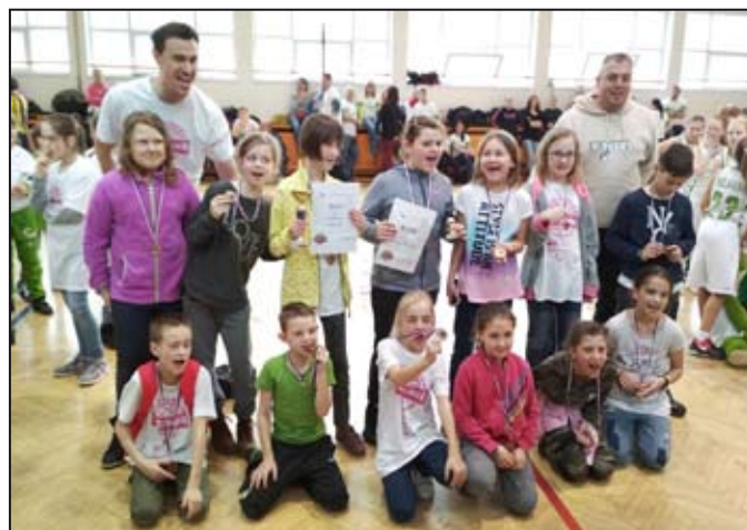
Velký úspěch pro Mohelnici

Tak proběhl náš první velký mezinárodní turnaj, kde Mohelni-