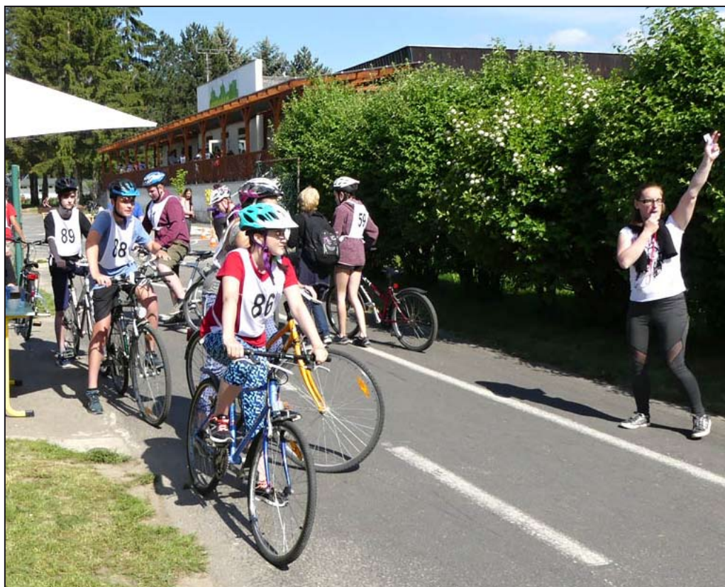
A je odstartováno.