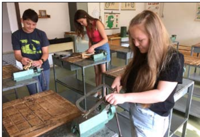
Žáci ZŠ Vodní jsou v pracovních činnostech zruční.

Grand Veteran podporuje iniciativu Mezinárodní federace historických vozidel FIVA v oblasti Trade and Skills, týkající se uchování tradičních a ohrožených řemesel. V souvislosti s činností a posláním FKHV se jedná o řemesla potřebná při renovaci historických vozidel. Tato řemesla nejsou součástí běžné výuky na školách, nebo jsou vyučována pouze okrajově na minimálním počtu škol, a to často formou nadstavby či specializace. V dnešní době je veteránismus rozvinutou a stále se rozšiřující aktivitou. S tím souvisí rostoucí poptávka po odbornících ovládajících tradiční řemesla. Ti mají značnou šanci na kvalitní a lukrativní uplatnění na trhu práce. Bohužel takových odborníků ubývá a některá řemesla dokonce již úplně vymizela. Pokud mají být tradiční řemesla uchována, což je nutné pro zachování historie a kulturního dědictví, pak je třeba