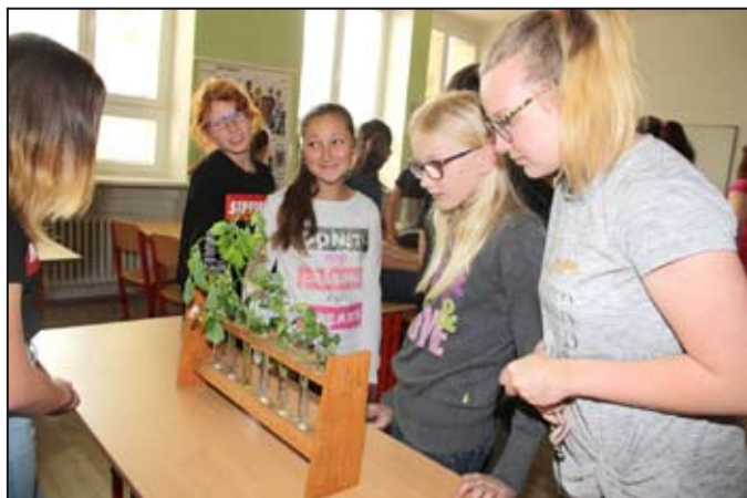
Na Mlýnské slavili Den Země.

Energie – to bylo hlavní téma 9. ročníků. Motta jejich aktivit zněla: „Rozsviťme další lampu“, „Modifikované potraviny“ či „Konec ropy na Zemi“. Žáci se zapojili i do úklidu kolem školy. Oslavy Dne Země se na naší škole opravdu vydařily.