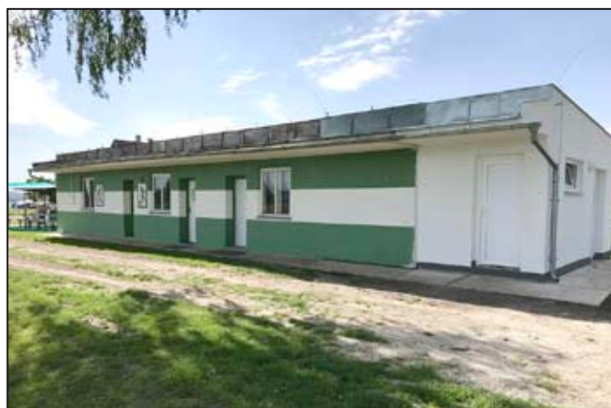
Opravené kabiny pro sportovce.

Libivá poskládala mužstvo fotbalistů s názvem Celtic. V místní části Libivá je fotbalové hřiště středobodem setkávání a zábavy. Aby vše šlo lépe, rozhodl se Osadní výbor prosadit rekonstrukci fotbalových kabin a zázemí pro občerstvení.