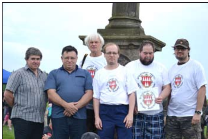
Společnost přátel historie Mohelnicka