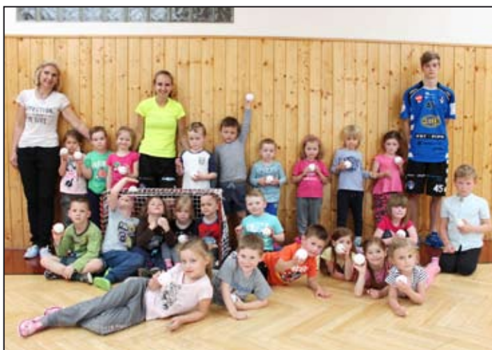
Děti florbal bavil.

Ve čtvrtek 26. dubna si děti z MŠ Na Zámečku přišly do prostorů malé tělocvičny na ZŠ Vodní zasportovat. Z malých školáčků se stali florbalisté. Trenéři z klubu FBC Mohelnice si pro děti nachystali ukázkou hry florbal. Před praktickou částí, kde si děti samy zkusily být v kůži hráčů, trenéři školáčkům představili hru florbal, jednotlivé pomůcky a vybavení pro hru, klub FBC Mohelnice či úspěchy i akce klubu.