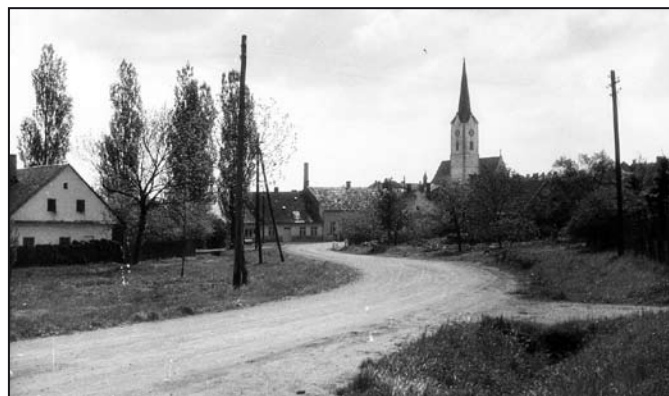
Pohled na Mohelnici ze silnice Mohelnice – Křemačov, 50. léta 20. století.

Vstupné: plné 30 Kč, snížené 15 Kč, děti do 3 let zdarma