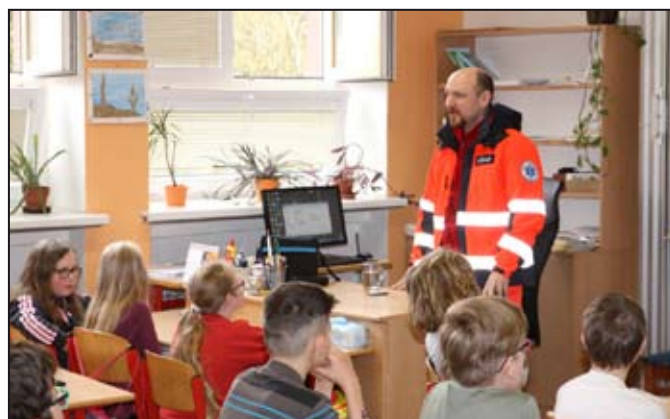
Projektový den na ZŠ Mlýnská