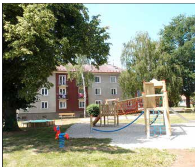
Na fotografiích jsou nová dětská hřiště v ulicích Na Příkopech a Staškova.