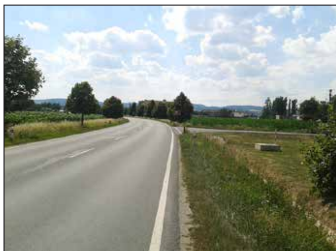
Jižní obchvat s odbočkou do ulice Jižní.