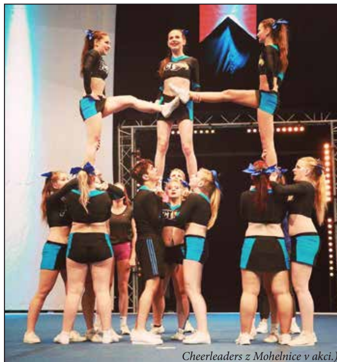
Cheerleaders z Mohelnice v akci.)