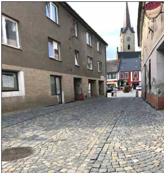
Podchodu zvoní hrana.