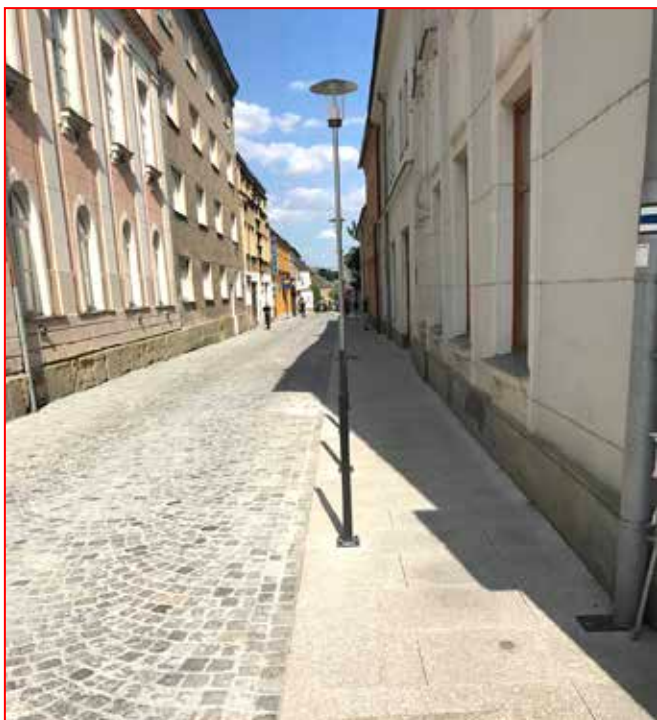
Facelift Smetanovy ulice.