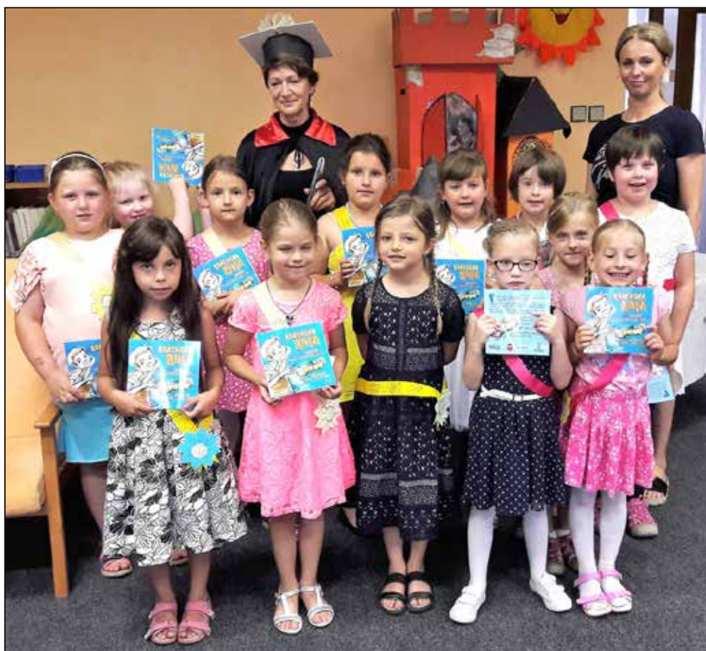
Slavnostně pasování čtenáři.