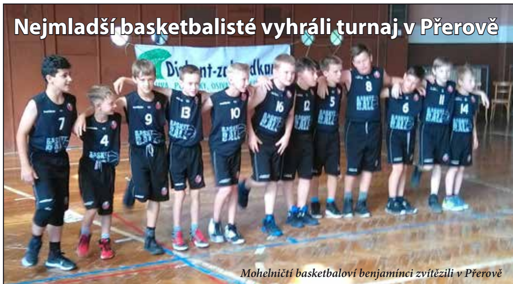
Mohelničtí basketbaloví benjamínci zvítězili v Přerově

V neděli 20. května vyhráli nejmladší basketbalisté TJ MEZ Mohelnice turnaj kategorie U11 v Přerově. Na turnaji, který je součástí „Květnového mládežnického basketfestu v Přerově“, se utkalo ve dvou skupinách osm