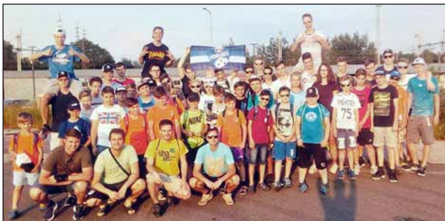
Mohelnický florbal získává cenné zkušenosti.

V základních skupinách se mohelnickým hráčům dařilo, avšak zlomové bylo následné playoff. Nejúspěšnější kategorie našeho oddílu, elévové a dorostenci, ukončily svoji cestu v turnaji v osmifinále, kde narazily na opravdu kvalitní soupeře. Elévové byli vyrazeni tý-