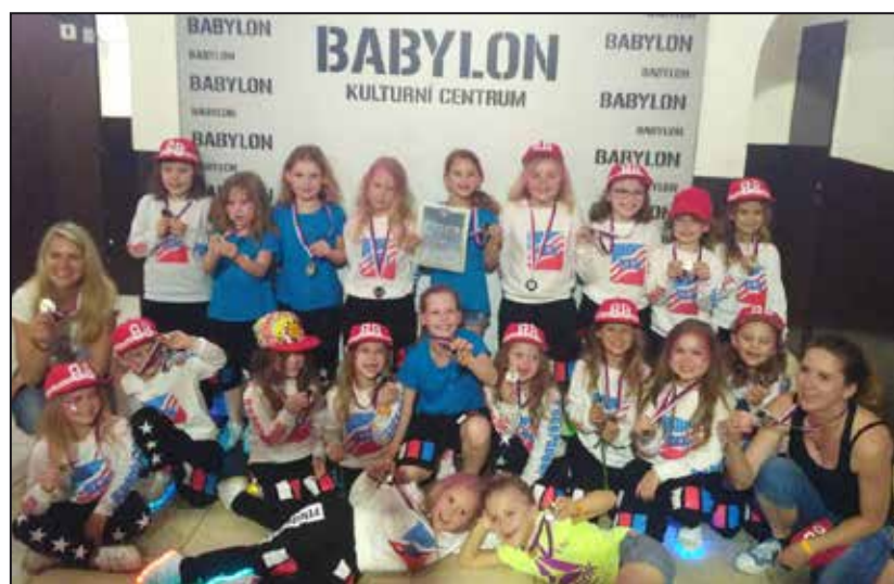
Taneční skupina X-Treme dává o sobě vědět.