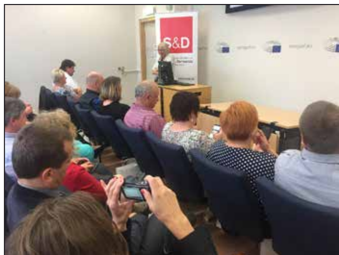
Europoslankyně Olga Sehnalová pozvala zástupce mikroregionu.

Zástupci Mikroregionu a Místní akční skupiny Mohelnicko s radostí přijali pozvání paní europoslankyně Olgy Sehnalové a navštívili „srdce a další životně důležité orgány“ Evropské unie v Bruselu. Krom před-