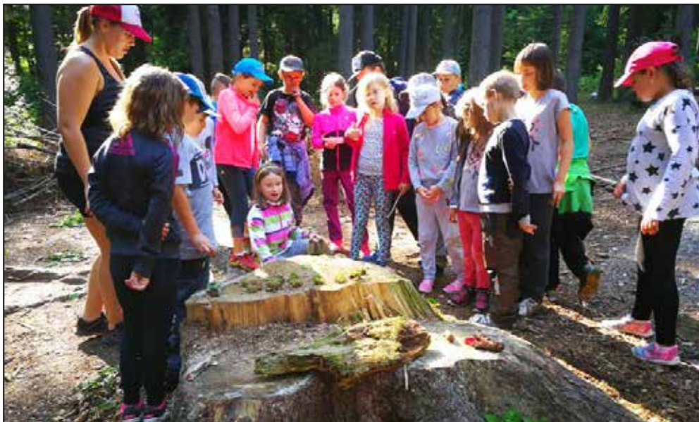
Pobyty v přírodě jsou velmi oblíbené.