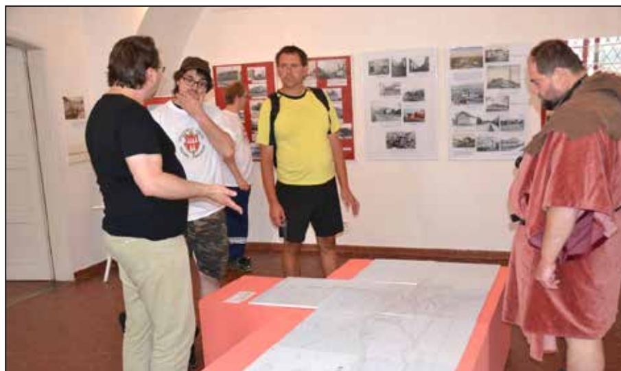
Diskuze nad historickými materiály.

Vstupné: plně 30 Kč, snížené 15 Kč, děti do 3 let zdarma