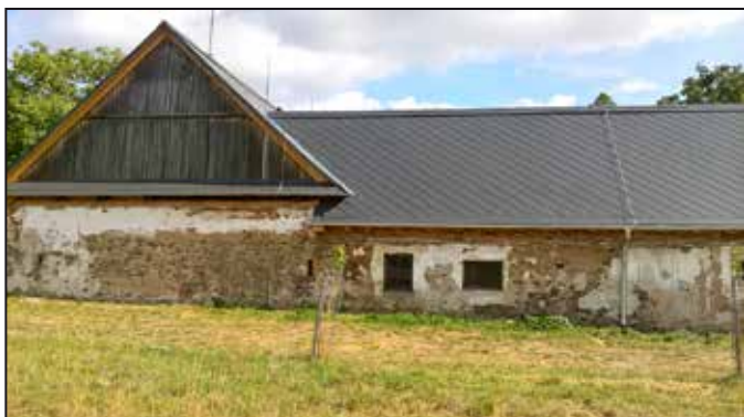
Zdevastovaný statek se postupně rekonstruuje