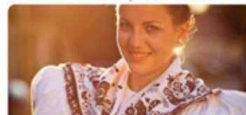
Informace o dění v obci