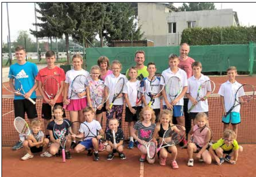
Tenisová družstva na společném setkání 15. 6. 2018