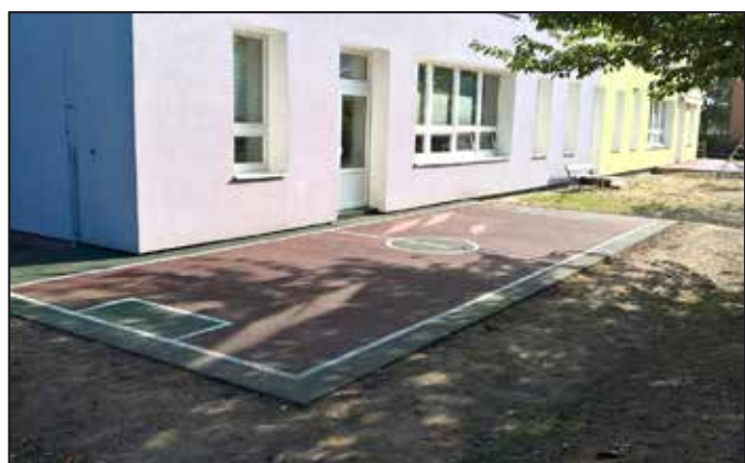
Umělý povrch na terase MŠ Na Zámečku