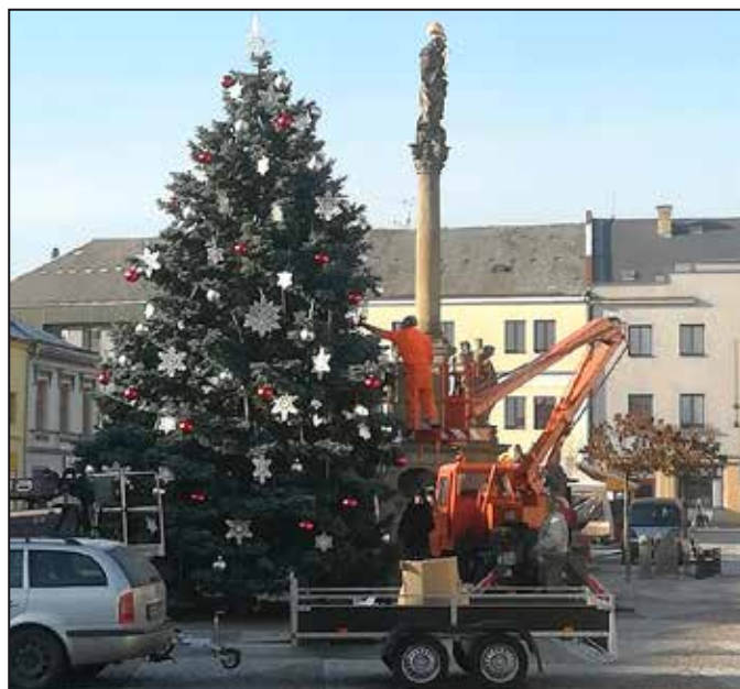
Zdobení stromu