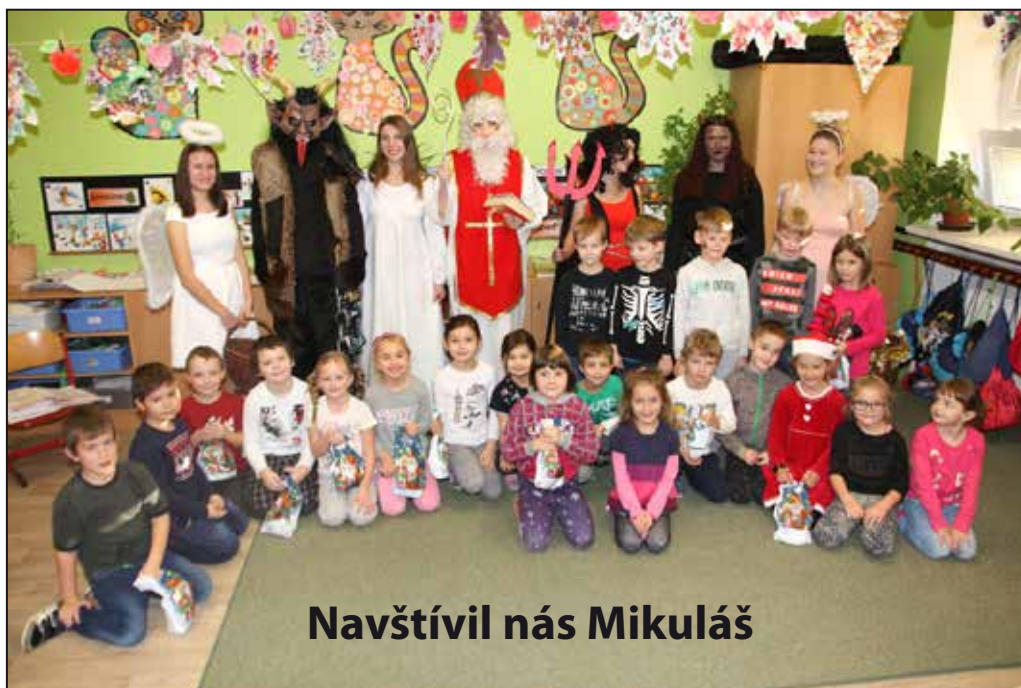
Navštívil nás Mikuláš