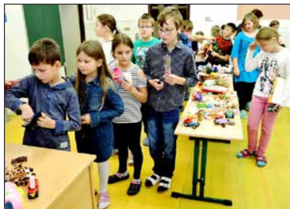
Děti dokázaly, že mají laskavé srdce.