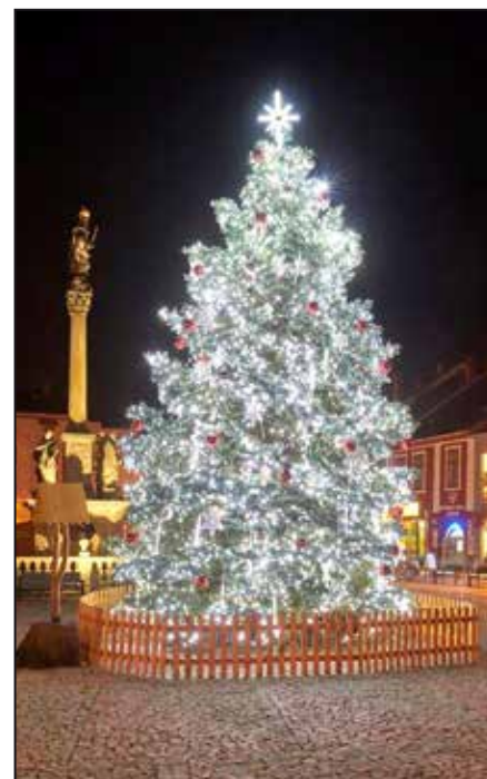
Vánoční strom na náměstí Svobody

S vyšší cenou plynu od roku 2019 samozřejmě stoupne i cena dodávané tepelné energie z CZT. U domovních kotelů je situace obdobná a samozřejmě vzroste cena tepelné