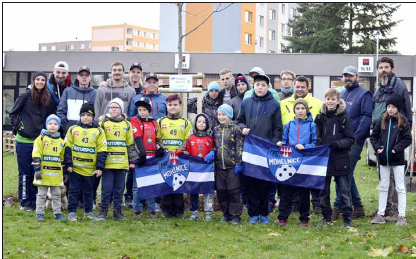
Mohelnický florbalový klub zasadil strom.

Mohelnický zpravodaj. Měsíčník. Vydává Město Mohelnice, U Brány 2, 789 85 Mohelnice, IČO 00303038, DIČ CZ00303038. Evidenční číslo MK ČR E 12893. Redakce: Mohelnické kulturní a sportovní centrum, s.r.o., Lazebnická 2, 789 85 Mohelnice, tel.: 583 430 915. Redakční rada: Mgr. Dagmar Čepová, Mgr. Tereza Konečná, Šimon Švub, Ing. Ivo Višinka. Redakční radu jmenuje Zastupitelstvo města Mohelnice. Redaktor: Mgr. Petra Rosipalová <mohelnickyzpravodaj@gmail.com>. Příjem plošné inzerce: Iveta Zapletalová, <zapletalova@mkssdk.cz>, tel.: 583 430 915. Vychází prvního dne daného měsíce a nese i jeho pořadové číslo. Uzávěrka: 20. dne ve 12 hodin předchozího měsíce. Výtisk zdarma. Náklad: 4 300 ks. Tisk: Tiskárna Křupka Mohelnice. Nevyžádané rukopisy a obrazové materiály se nevracejí. Redakce se nemusí ztotožňovat s názory prezentovanými ve článkách dopisovatelů. Nepodepsané příspěvky nezveřejňujeme. V redakci jsou k nahlédnutí Zásady pro vydávání Mohelnického zpravodaje. Vydavatel neodpovídá za věcný obsah uveřejněných inzerátů. Vydavatel si vyhrazuje právo zveřejnit publikované materiály na internetu. Přetiskování redakčních materiálů bez souhlasu redakce není dovoleno. Za případné chyby se omlouváme. Periodický tisk územního samosprávného celku.