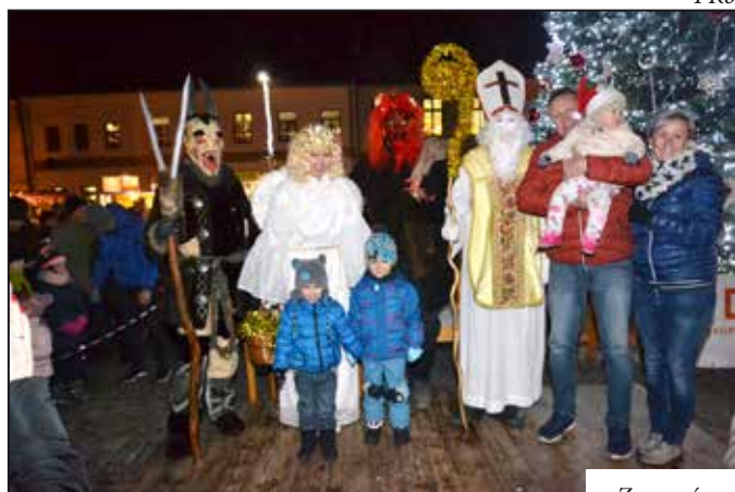
Z rozsvícení stromu