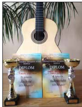
Úspěch mohelnických kytaristů.