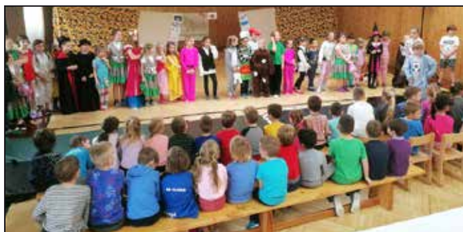
Malí herci pilně nacvičili nové představení.

Výsledky naší práce mohli nejprve hodnotit rodiče i prarodiče na premiéře, která se konala 22. ledna. Vystoupení sklidilo velký úspěch, a proto jsme se rozhodli zahrát další reprízy a udělat radost dětem ze školky i našim spolužákům z I. stupně. Ve čtvrtek 7. března čekal naše malé herce náročný den, který zvládli opět výborně. Během dopoledne odehráli dvě představení – pro své spolužáky z I. stupně a další pro děti z MŠ Na Zámečku. Těšíme se i na další reprízy, na níž přivítáme dětské diváky z MŠ Hálkova.