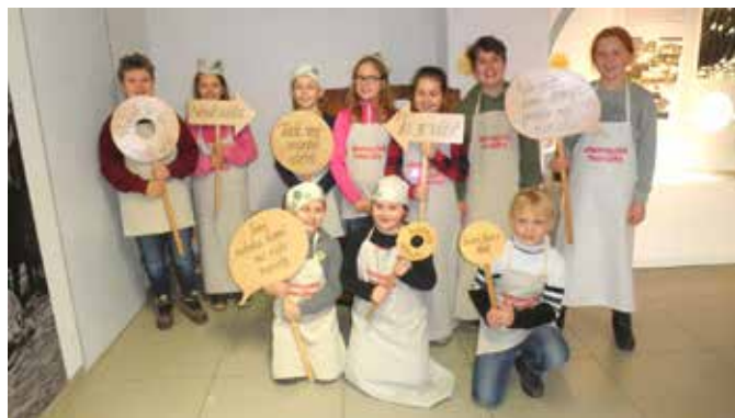
Z exkurze v Muzeu tvarůžků

Další ze souboru exkurzí byla připravena na 6. března. Tentokrát jsme se vypravili do Ruční papírny ve Velkých Losinách. K této exkurzi byla přizvána také třída 5. B. Papírna je jedinou svého druhu ve střední Evropě. Již více než 400 let se zde vyrábí ruční papír tradiční metodou z bavlny, lnu a vody. Tento papír využívají umělci pro své kresby, grafiky, dále pak vysoké školy k tisku vysokoškolských diplomů. Pro reprezentativní korespondenci jej dokonce využívá prezidentská kancelář. Papír má více než stoletou trvanlivost a slouží i restaurátorům. Součástí ruční papírny je od roku 1987 muzeum papíru. Zde se žáci dověděli o počátcích výroby papíru vůbec i o rozvoji papírnictví u nás. Zhlédli stroje na výrobu papíru a celý postup výroby. I zde v rámci výuky prokazovali žáci své