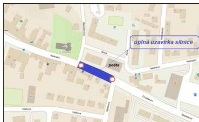
Místo uzavírky na Nádrazní ulici